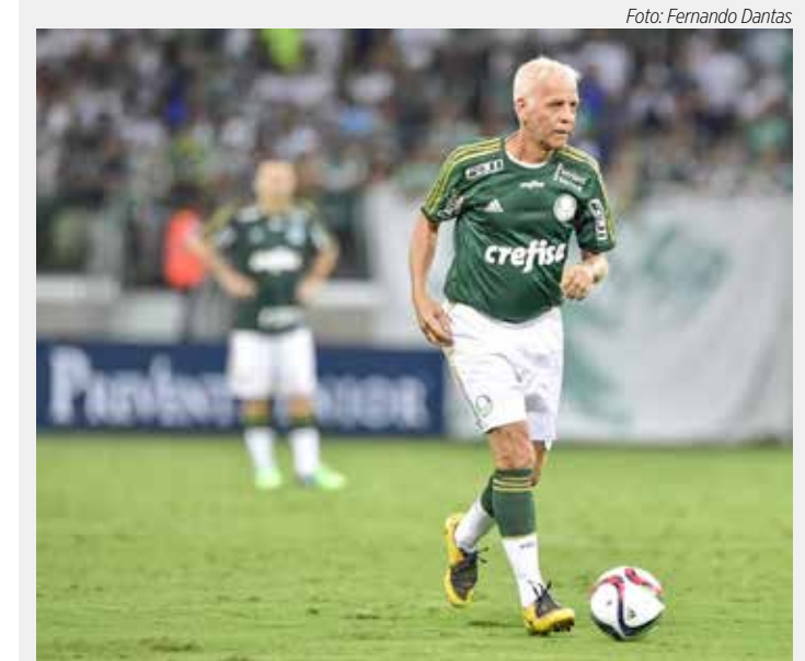
Ademir da Guia em Rio Claro

E a partir das 9h30, no Centro Universitário Claretiano, grande festa de encerramento com entrada a 1 quilo de alimento não perecível ou 1 litro de leite. Haverá atrações musicais e a presença de craques palmeirenses do passado, entre eles, Ademir da Guia. Organização do Consulado Palmeiras de Rio Claro.