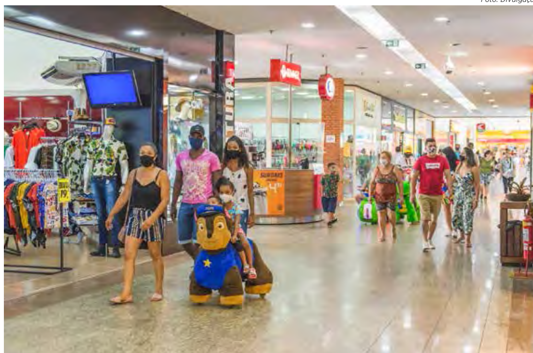
Lojas do Shopping Center atendem das 13 às 19 horas no feriado desta quarta-feira

Rio Claro não terá atendimento presencial e expediente administrativo no feriado desta quarta-feira (7). Assim, neste dia, o atendimento será feito somente pelo telefone 0800-505-5200, que funciona 24 horas e atende telefones fixos e celulares. O atendimento presencial e por WhatsApp retorna na quinta-feira (8).