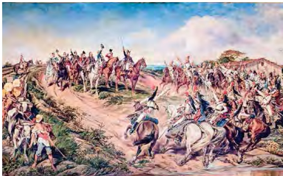
O quadro de Pedro Américo (em destaque) é uma metáfora sobre o dia do Grito do Ipiranga. A pintura, feita em 1888, chama-se Independência ou Morte e está exposta no Museu do Ipiranga (SP)

Padre Belchior de Oliveira, conselheiro de Dom Pedro, estava lá em 1822 e no seu depoimento escrito, em momento algum, lembra-se do famoso “independência ou morte!”. Para o padre, Dom Pedro teria dito algo assim, “Nada mais quero com o governo português e proclamo o Brasil para sempre, separado de Portugal”.