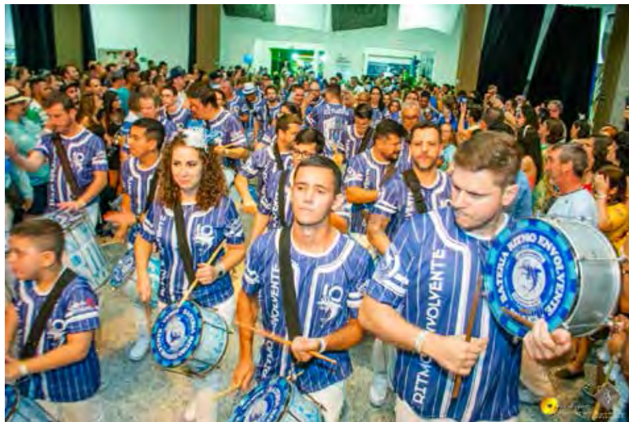
A bateria Ritmo Envolvente, da Samuca, fará uma apresentação revivendo os sambas-erredos históricos da escola

A Samuca vai comemorar os 40 anos de batismo pela GRES Beija-Flor, que é madrinha da Escola. A bateria da Beija-Flor fará uma apresentação, que ao lado da bateria da Samuca, promete ser o ponto alto da noite. Com uma pro-