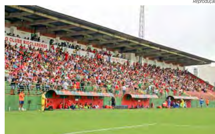
Estádio Benitão completa 50 anos