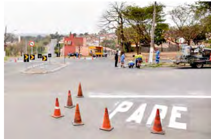
Mini rotatória foi implantada entre os bairros Benjamin de Castro e Paulista 1