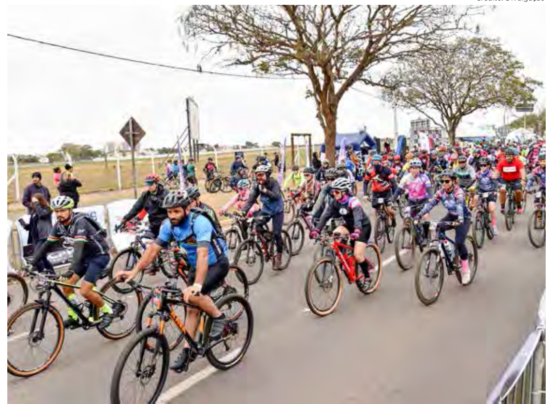
1º Passeio Ciclístico Pedala Rio Claro reuniu dezenas de participantes

Pessoas e empresas interessadas em contribuir com o trabalho do Fundo Social podem fazer doações de alimentos diretamente no paço municipal, na Avenida 5 esquina da Rua 3. Quando se tratar de grandes quantidades, o doador poder ligar para 3526-7171 e solicitar transporte dos produtos.