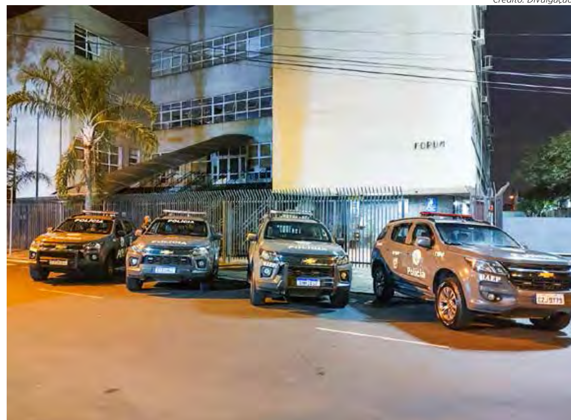
Operação foi realizada nesta terça-feira (6) na cidade de Itirapina pelo GAECO com o apoio da Comissão de Prerrogativas da OAB/SP – Rio Claro e do BAEP de Piracicaba

O Gaeco já havia oferecido denúncia no caso por associação criminosa e por vários crimes de receptação, em curso material. A Justiça acolheu o pedido, suspendendo, cautelarmente, três acusados de suas atividades profissionais e estabelecendo fianças que superam 1.500 salários mínimos.