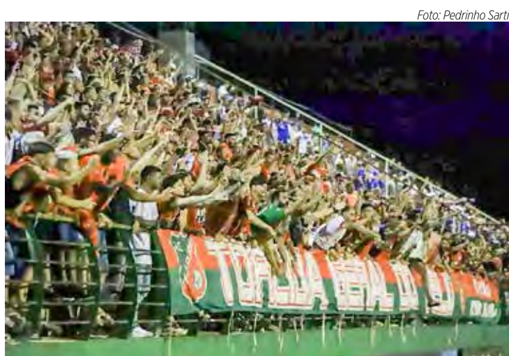
Torcida do Velo no Benitão em dia de dérbi