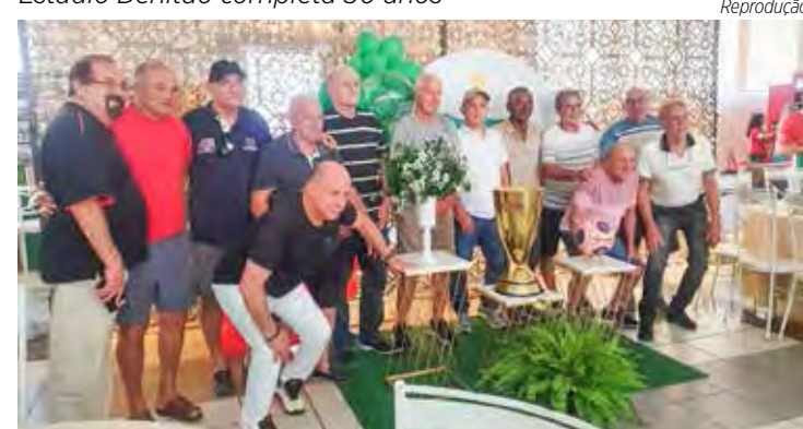
Bonita festa reuniu craques velistas do passado, no último dia 28