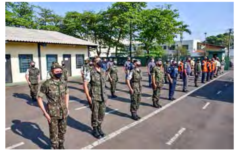
Rio Claro terá ato cívico para celebrar o bicentenário da Independência do Brasil

A solenidade será iniciada às 9 horas, no Museu Histórico e Pedagógico Amador Bueno da Veiga, na Rua 7 com a Avenida 2, com a presença de autoridades civis e militares. O evento é aberto ao público.