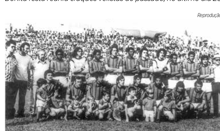
Velo Clube 1972 inauguração do Benitão