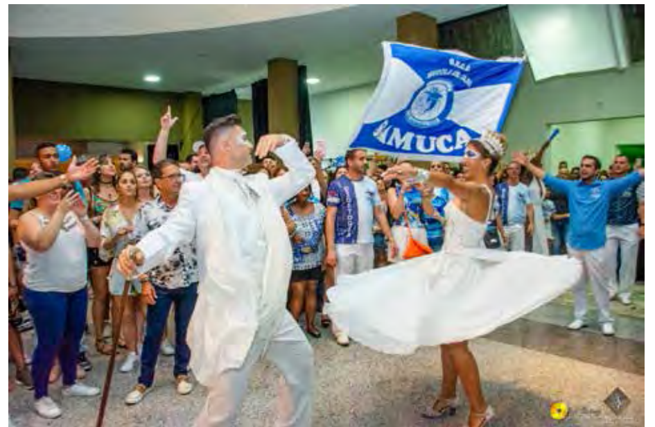
Mestre-sala e porta-bandeira da Escola de Samba Samuca

Os abadás do Bendito Samba estão à venda na Samuca e na secretaria do GG por R$ 15 para os sócios do GG, da Samuca e do Clube de Campo. Os não sócios pagam R$ 40. São parceiros do Bendito Samba as seguintes empresas: Xavier e Camargo Imobiliária, Ápia, Sicoob e Buffet Giramundo.