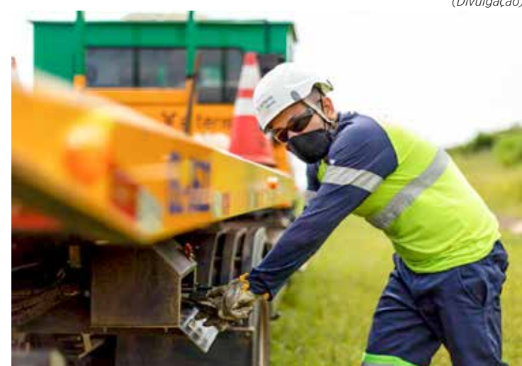
A previsão é que mais de 80 mil veículos passem pelo trecho administrado pela concessionária – o maior fluxo deve ser registrado na Rodovia Anhanguera

– Realize um check-up completo no veículo antes de iniciar a viagem, verificando itens de