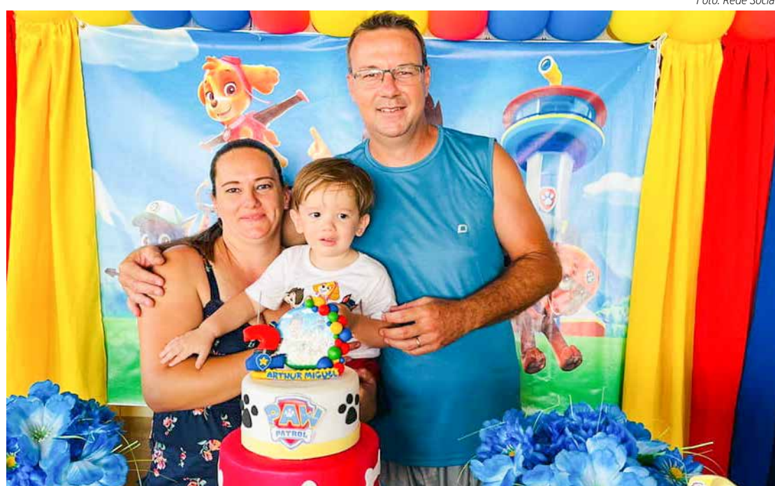
Com a família