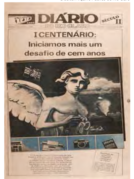
Edição de 23 de novembro de 1916

Hoje, a situação é bem diferente. A cidade tem centenas de quadras distribuídas em dezenas de bairros, e população estimada em 209.548 mil habitantes (2021), segundo o IBGE (Instituto Brasileiro de Geografia e Estatística). E o Diário acompanhou todas essas mudanças levando essas e outras informações para a casa dos leitores.