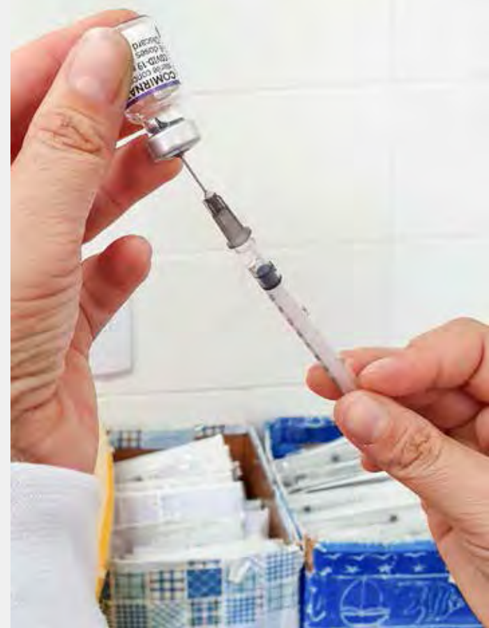
Vacina contra a Covid-19 está disponível em oito unidades de saúde

As primeiras doses são aplicadas em quem tem a partir de 3 anos. Para a segunda dose, é necessário observar a data de retorno, marcada a lápis no cartão de vacinação. Já nos maiores de 12 anos a terceira dose é aplicada quatro meses após a segunda dose. A quarta dose é para pessoas com 18 anos ou mais que tomaram a terceira dose há no mínimo quatro meses.