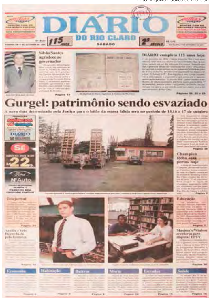
Capa da edição de 1º de setembro de 2001, primeiro aniversário do DRC no século XXI

O escritor e colunista Jaime Leitão lembrou de sua relação com o Diário que começou em