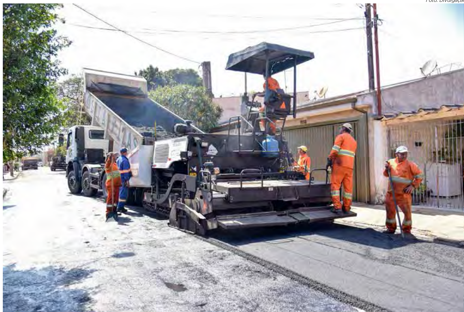
Nesta quarta-feira (31), os serviços foram realizados na Rua 7-A entre as avenidas 58 e 64, no bairro Vila Nova