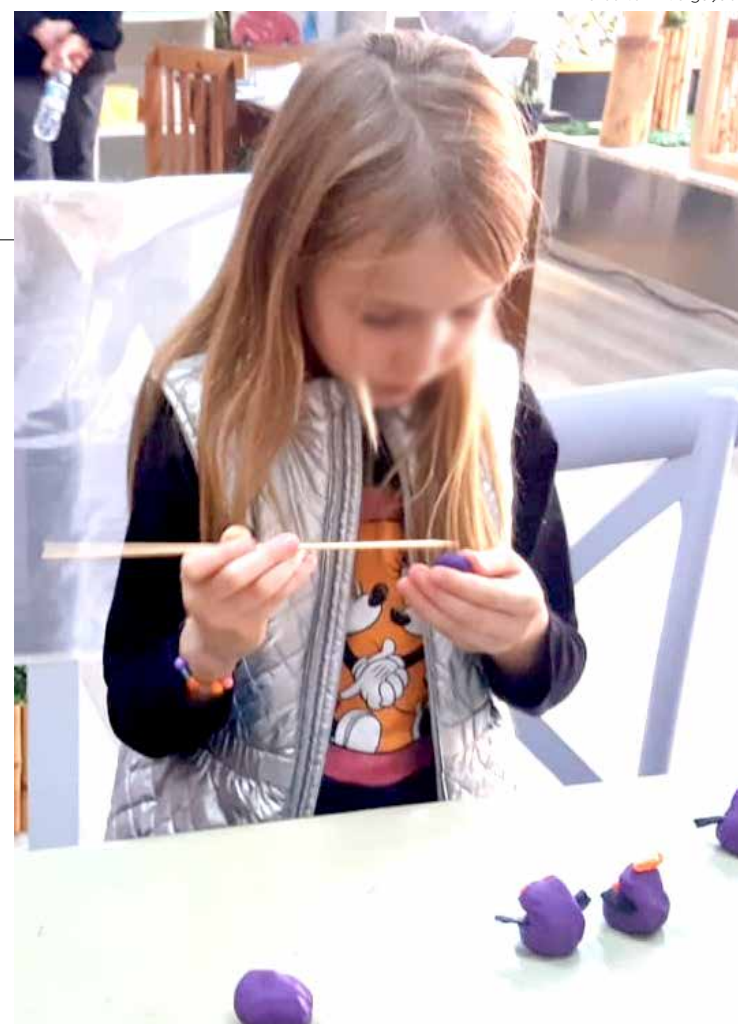
Nas oficinas, as crianças aprendem novas brincadeiras que despertam a criatividade e o conhecimento

Local: loja em frente ao deque do Shopping Rio Claro Atividades gratuitas