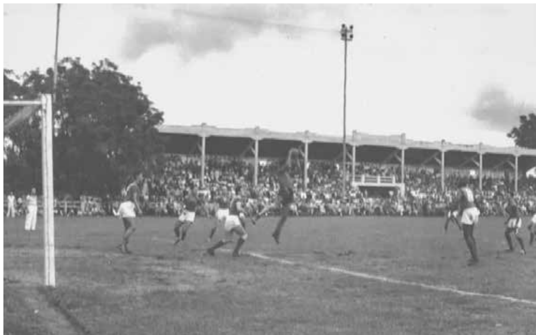
Lance de jogo disputado no antigo estádio do Velo, em 1949, no mesmo local onde hoje está o Benitão

Já os torcedores mais antigos do Velo poderão matar a saudade de momentos memoráveis vividos no Benitão, que foi inaugurado no dia 7 de setembro de 1972, na partida em que o Velo Clube recebeu a Sociedade Esportiva Palmeiras.