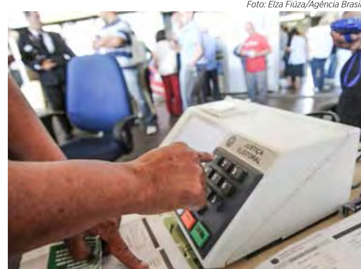
Em 2020, o número de ausentes às urnas bateu recorde impulsionado pela pandemia de Covid-19

xar de votar a cada pleito no país. Historicamente a média de nacional de abstenções giram em torno de 20% do eleitorado. Em 2018, quase 30 milhões de eleitores não compareceram às urnas. O nível de abstenção foi de 20,3%, o mais alto desde as eleições de 1998, quando 21,5% do eleitorado não votou. Em 2014, o índice de abstenções foi de 19,39% no primeiro turno e 21,10% no segundo.