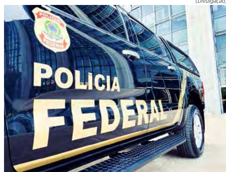
Nessa terça-feira (30), foram cumpridos 28 mandados de busca e apreensão

Com a análise do material apreendido nas fases anteriores, foi possível verificar que os investigados permaneceram atuando à margem da lei ao longo dos últimos dez anos (até 2021), agora em conluio com outros autores, para a prática de crimes de falsificação de docu-