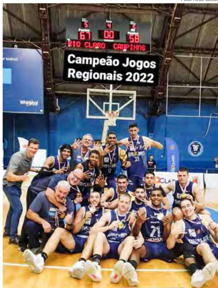
Basquete masculino de Rio Claro faturou ouro nos Regionais