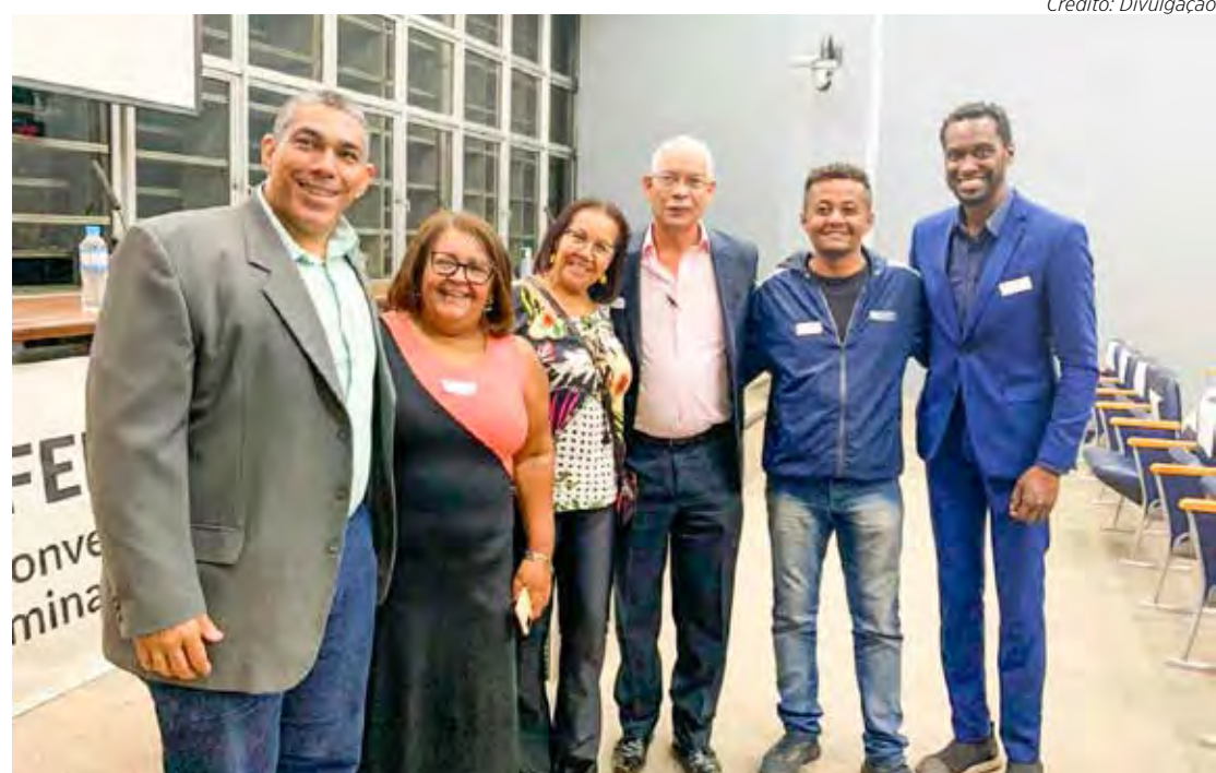
A Convenção foi realizada na Assembleia Legislativa de São Paulo

A Convenção Interamericana contra o Racismo, a Discriminação Racial e Formas Correlatas de Intolerância foi promulgada pelo presidente da República Jair Bolsonaro, em 11 de janeiro deste ano, como publicado na data pela Agência Brasil. O texto apro-