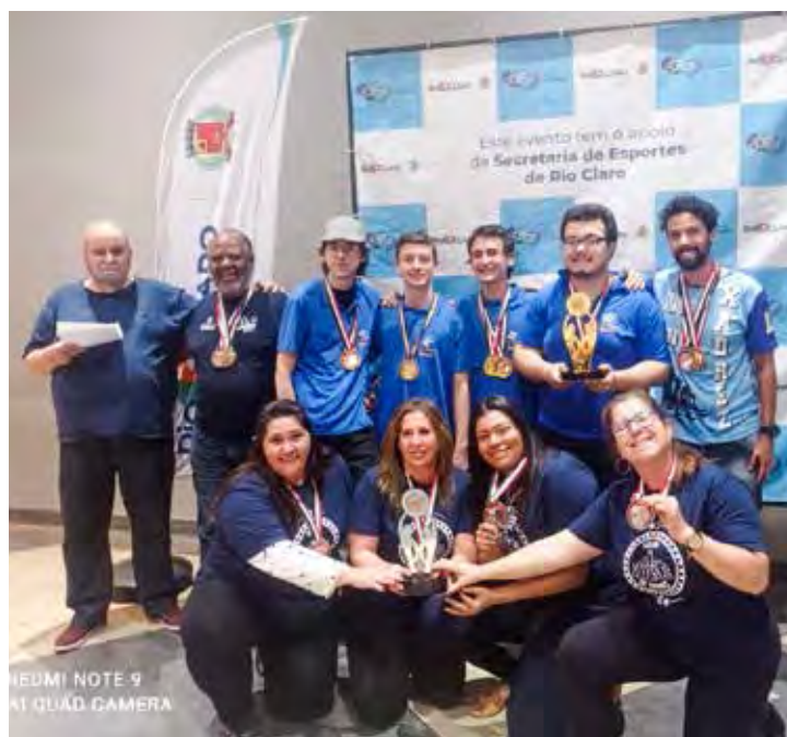
Xadrez rioclarenses conquista medalhas