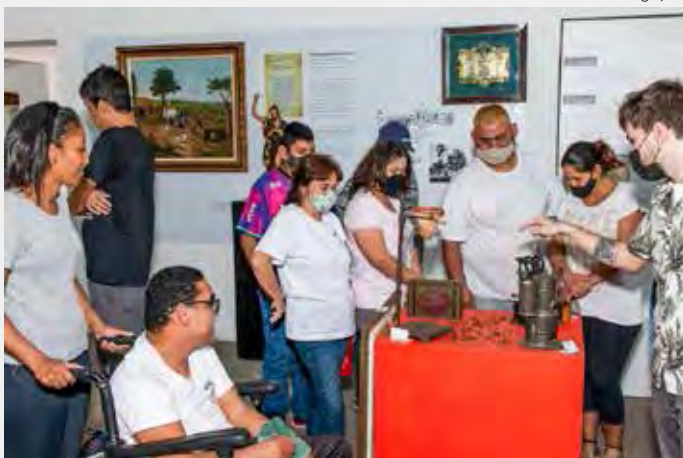
As visitas contam com a participação de aproximadamente 100 alunos