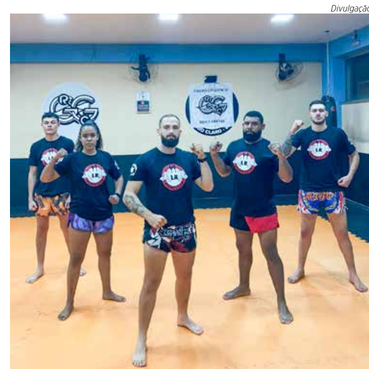
Equipe LR Fight Club de Rio Claro