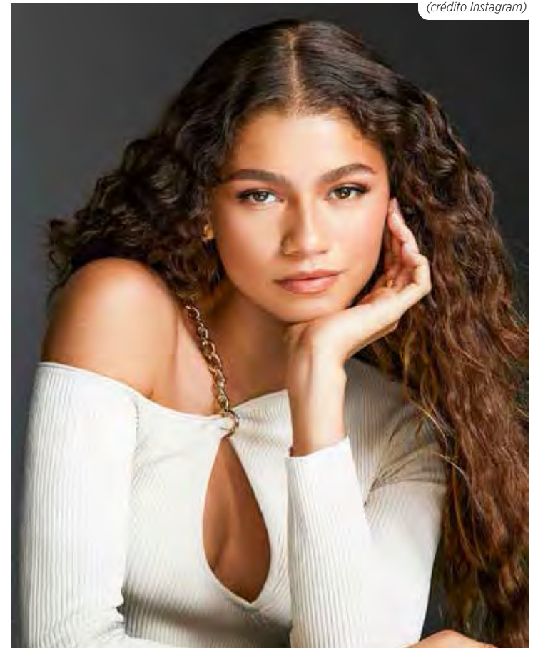
Zendaya, estrela de 'Euphoria'

A direção da Band entendeu que não tem mais como segurar a estreia do "Nóis na Firma". Desta forma, já pode ser confirmada a sua exibição para este próximo sábado, logo após a propaganda política da noite.