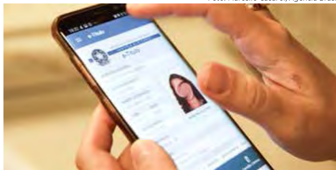
Eleitor pode fazer consultas pelo site do TSE e aplicativo e-Título