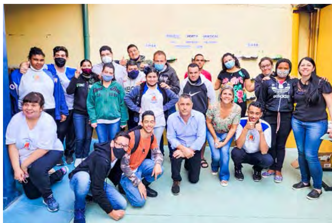
A horta se constitui em vasos feitos garrafas pet fixados numa parede

Os professores explicam que, por meio de uma metodologia que propiciou a observação de imagens, realização de experimentos