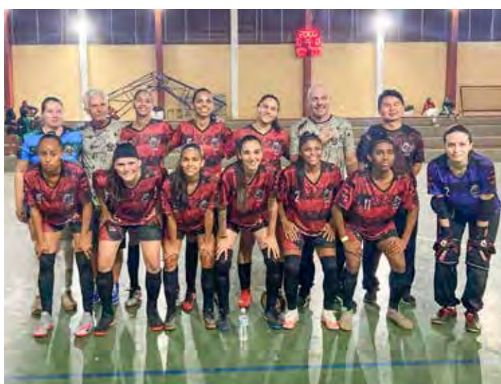
Futsal feminino foi medalha de bronze