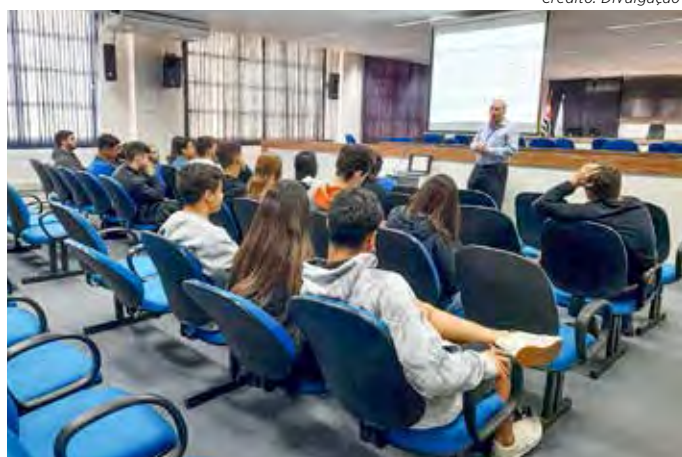
Estudantes visitaram a Câmara Municipal nesta terça-feira (23)