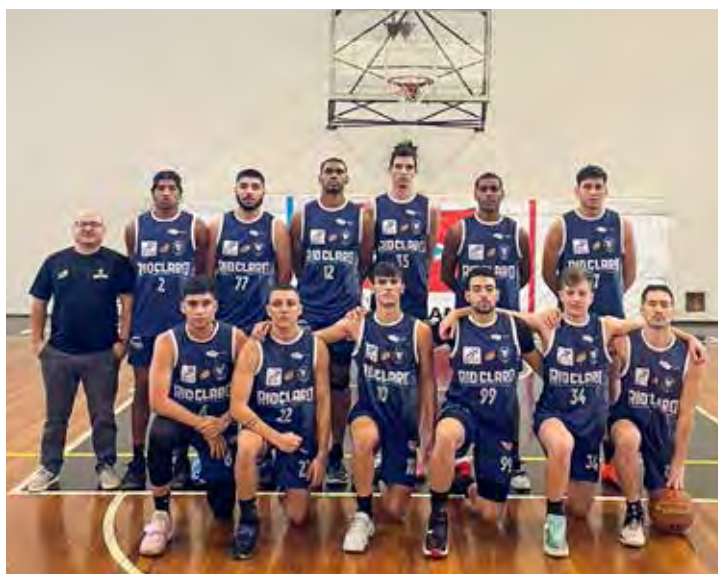
Basquete Masculino é finalista dos Jogos Regionais

Os dias, locais e horários dos próximos jogos ainda serão definidos pela Secretaria de Esportes do Estado de São Paulo.