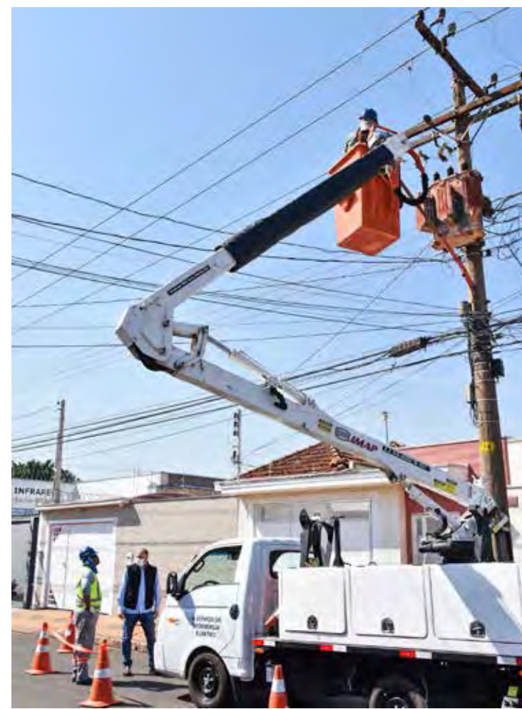
Troca de lâmpadas de iluminação pública na Avenida 23, na região sul de Rio Claro

Além da Avenida 23, a troca de lâmpadas também será feita nas avenidas 19, 21, 25 e 27, na região sul da cidade, e na Avenida 1, na região central. Também serão atendidas nesta etapa a Avenida Conde Francisco Matarazzo, Via da Saudade, Avenida Ulysses Guimarães e Avenida Visconde do Rio Claro.