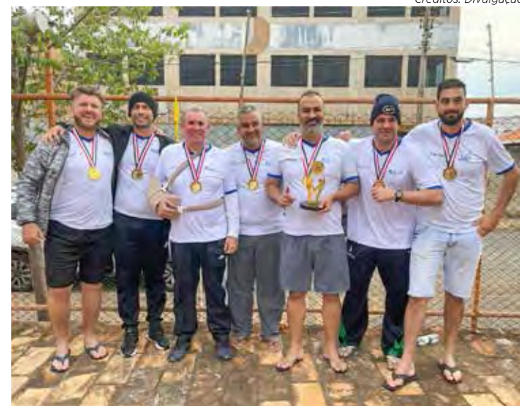
Biribol rioclarense conquistou medalha de ouro