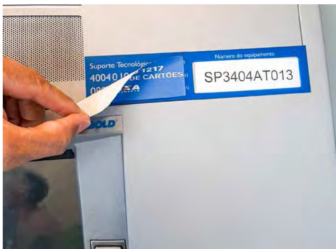
GCM acionou a perícia que constatou um dispositivo que de fato bloqueava o cartão na máquina

A viatura 4.1742 da Guarda Civil, foi acionada a comparecer em uma Agência bancária na Av. 1, na área central, na manhã de domingo (21), onde um cliente do banco teve seu cartão magnético retido em um dos caixas eletrônicos. O cliente que é aposentado, informou aos Guardas que ao utilizar o caixa eletrônico, notou que seu cartão ficou preso no dispositivo de leitura, sendo que na máquina havia um adesivo colado de forma grosseira, o qual indicava um número 0800 para efetuar ligação, quando suspeitou de uma possível fraude e resolveu ligar para a Guarda Civil. No local, os Guardas constataram o fato e acionaram a perícia técnica, onde foi verificado que o caixa utilizado estava com um dispositivo que