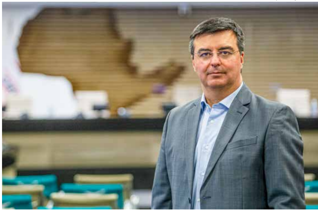
Rafael Cervone, presidente do Ciesp, fala sobre o desempenho da indústria nas exportações

No período analisado, os destinos mais importantes das exportações de Rio Claro foram China (12,2%), Bélgica (9,2%) e Reino Unido (7,1%). Por sua vez,