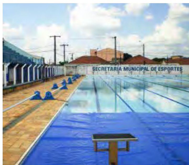
Piscina Municipal Herta Clara Koelle recebe aulas de natação e hidroginástica

E atenção, as inscrições para as aulas de natação e hidroginástica oferecidas pela Secretaria Municipal de Esportes, já podem ser feitas, na Secretaria Municipal de Esportes e