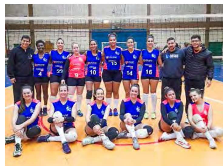
Vôlei feminino fez boa campanha