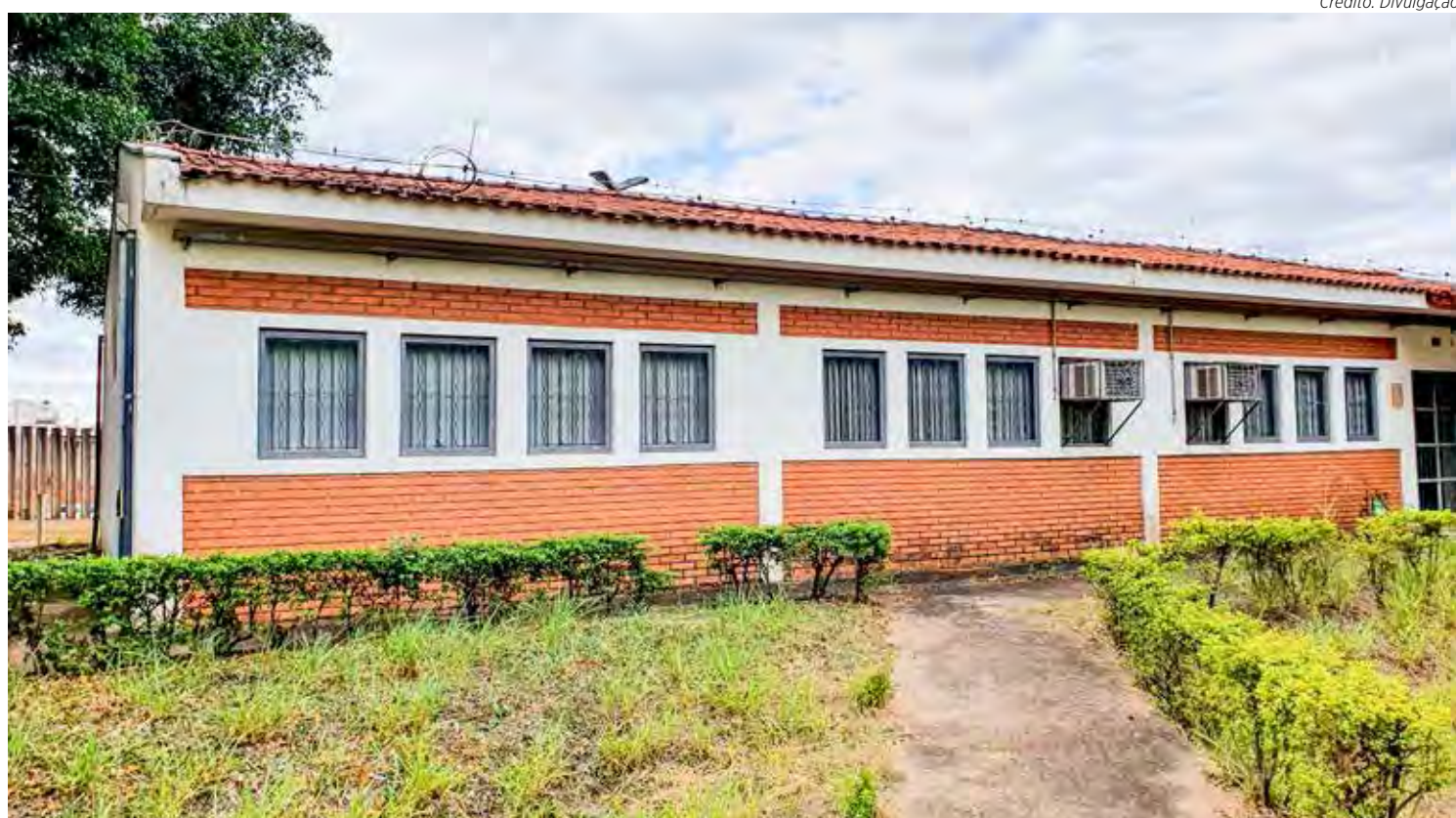
O Centro de Inovação Tecnológica vai funcionar em prédio no câmpus da Unesp no bairro Bela Vista

Tendo como “porta de entrada” a Sala de Inovação Tecnológica localizada na Secretaria de Desenvolvimento Econômico, o Centro de Inovação Tecnológica oferecerá capacitações, mentorias, acesso à plataforma pública de inovação, coworking público e conexões entre os agentes do ecossistema de inovação municipal. O atendimento na sala, na Rua 6 com Avenida 46 no NAM, será das 9 às 12 e das 13 às 16 horas. Informações pelo telefone (19) 3522-1955.