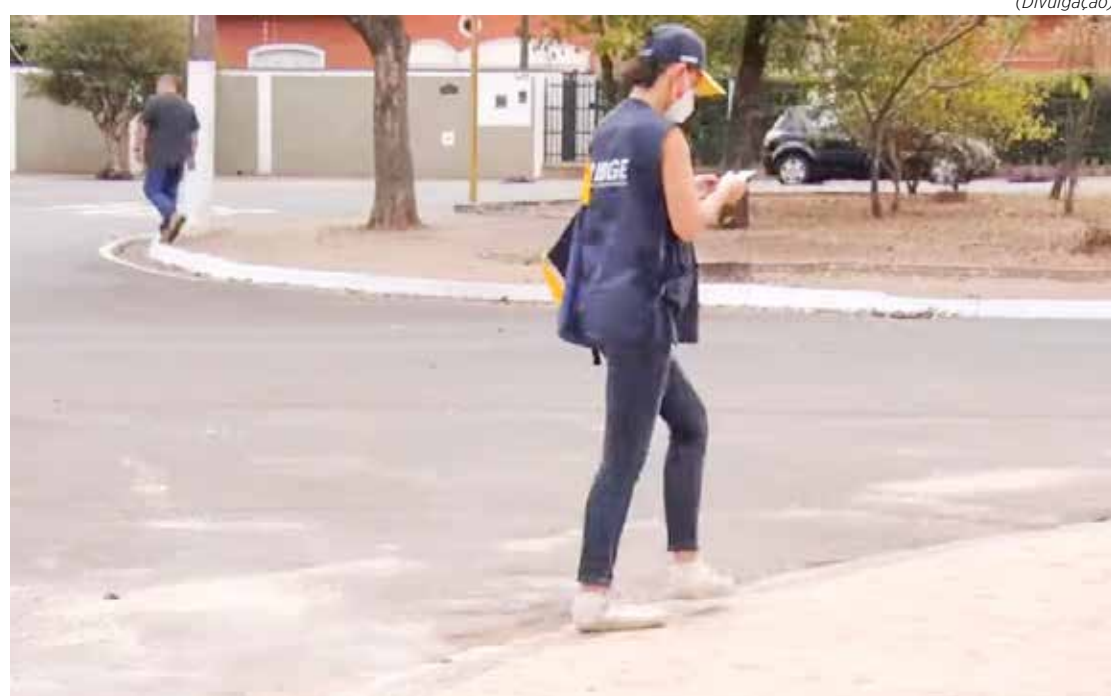
No Brasil, 89 milhões de endereços devem receber os mais de 183 mil recenseadores para a aplicação dos questionários

Informações também podem ser adquiridas pelo telefone (0800-721-8181) ou pelo site Respondendo ao IBGE.