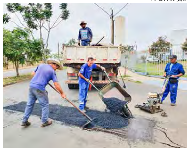
Trechos de Assistência foram atendidos pela operação tapa-buracos

Ainda na terça-feira, a prefeitura concluiu implantação de valeta na Avenida 18 com Rua 21, Jardim São Paulo.