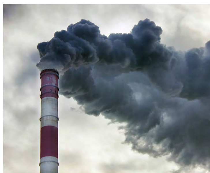
Poluição do ar decorrente das chaminés das fábricas.

cas, químicas e biológicas, causada principalmente pelo despejo de resíduos urbanos em rios e lagos; poluição do solo – causada pelo acúmulo de infiltração de agentes poluentes no solo, contaminação por agrotóxicos e descarte incorreto do lixo; poluição radioativa provocada pela liberação de algum tipo de radiação, causando danos sérios a saúde da população, como surgimento de tumores e mutações e lesões em tecidos e órgãos; poluição sonora causada por vibrações e sons de volume muito alto, é considerada grave, causando mau humor e problemas car-