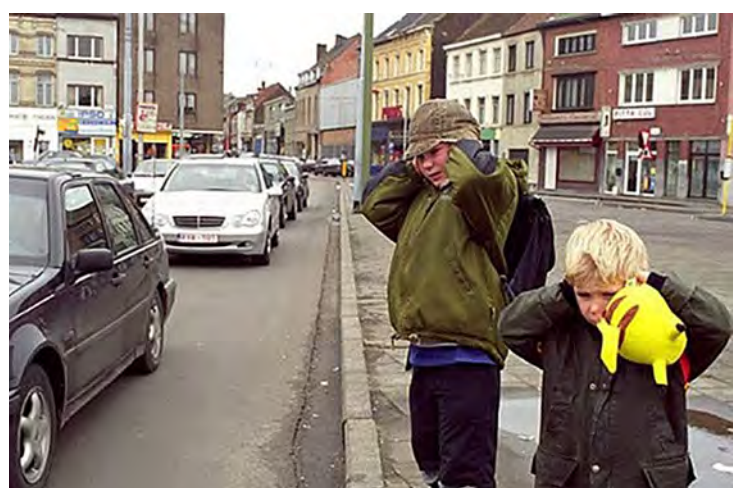
Tráfego é uma das maiores fontes de poluição sonora.

Nesta data lembramos da poluição que é um grande problema ambiental. A mesma foi criada para procurar soluções e conscientizar todas as esferas da população de como enfrentar esses problemas e como barrar a degradação de nosso planeta. Definida como degradação física e química do meio ambiente, a poluição de acordo com a Lei nº 6938 de 31 de agosto de 1981, que dispõe sobre a Política Nacional de Meio Ambiente, é considerada a degradação da qualidade ambiental resultante de atividades que direta ou indiretamente prejudiquem a saúde, a segurança e o bem-estar da população; criem condições adversas às ativi-