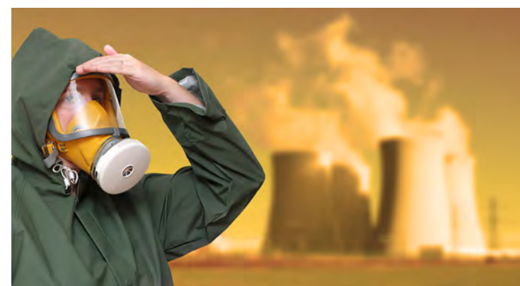
Poluição Radioativa.

díacos; poluição visual gerada pelo número excessivo de propagandas, outdoors, posters e cartazes, deixando o ambiente carregado e causando incômodo a quem vê.