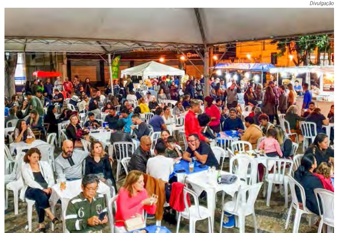
Grande público prestigiou a primeira edição do festival no Jardim Público

O dia de Santa Clara foi celebrado em 11 de agosto, data em que começou mais uma Festa de Santa Clara em Rio Claro. Hoje (13), às 18h30, acontece recitação do terço, com missa às 19 horas e quermesse, com cardápio variado e preços acessíveis. Página 5