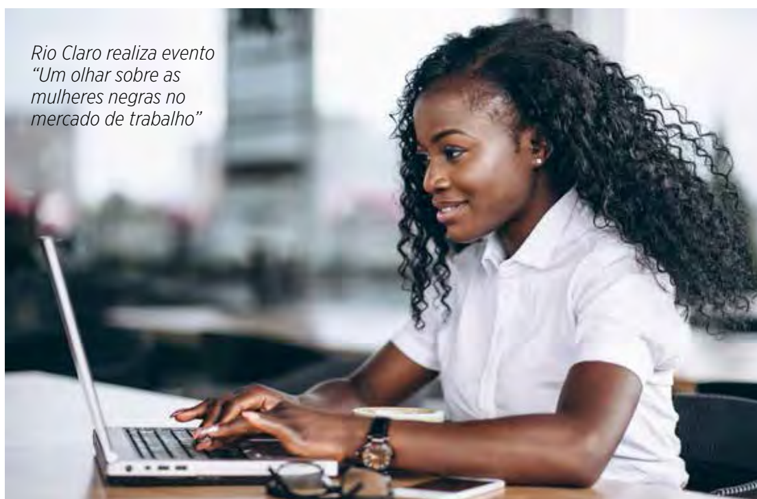
Rio Claro realiza evento “Um olhar sobre as mulheres negras no mercado de trabalho”

As atividades serão realizadas no Casarão da Cultura, na Avenida 3 com Rua 7, das 9 às 12 horas. Não haverá cobrança de ingresso.