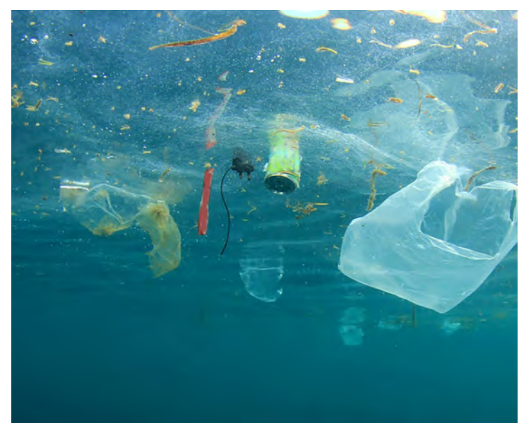
Despejo irregular de resíduos nos resíduos- Poluição Hídrica. Imagem do Portal Site Sustentável

Em resumo, só temos esse planeta para morar, cuide dele, preserve os recursos naturais, consuma menos, recicle, reaproveite, seja responsável com a natureza e animais, plante uma árvore e viva essa sensacional experiência de combate à poluição.