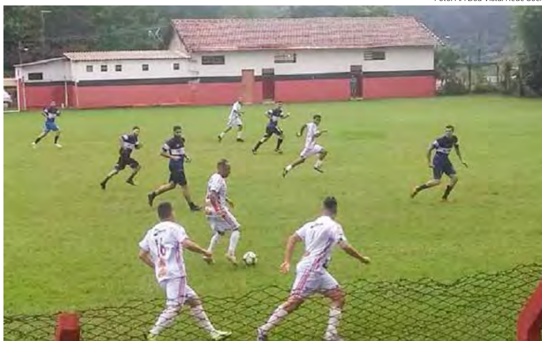
Domingo sem jogos do Amador

Após 7 rodadas, o Grupo A tem a liderança da Família