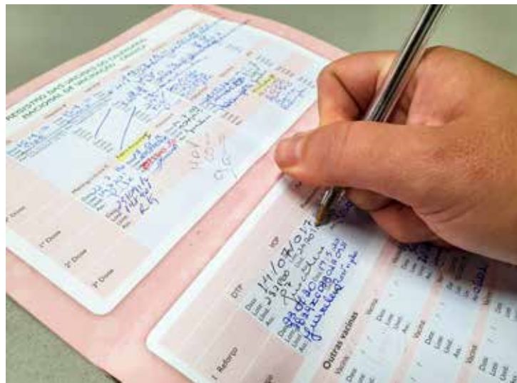
É importante a apresentação da carteira de vacinação para atualização das vacinas

A campanha para atualizar a carteira de vacinação de crian-