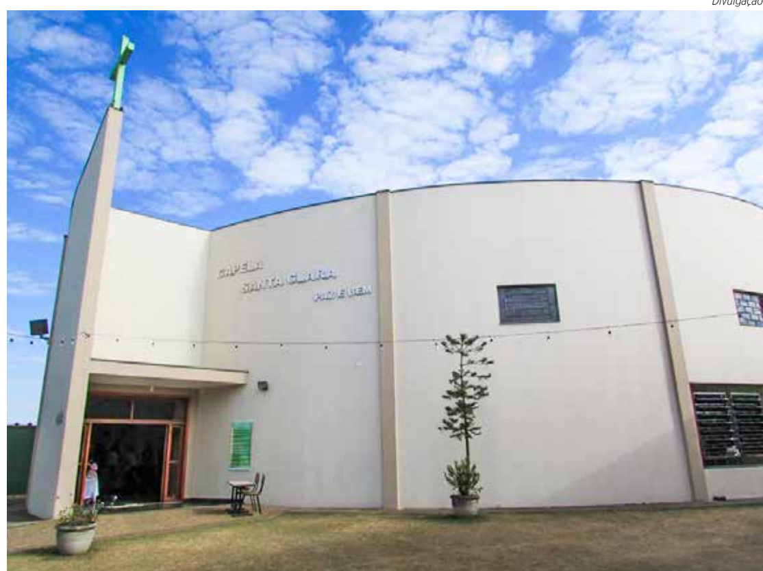
A Capela de Santa Clara fica na Avenida M29, número 408, no Jardim Santa Clara, em frente ao Sesi em Rio Claro

Clara de Assis morreu em 11 de agosto de 1253, aos 60 anos, e em homenagem a data de sua morte foi escolhido o dia 11 de agosto como festa litúrgica pela Igreja. A “dama pobre” foi canonizada em 23 de agosto de 1255, pelo Papa Alexandre IV.