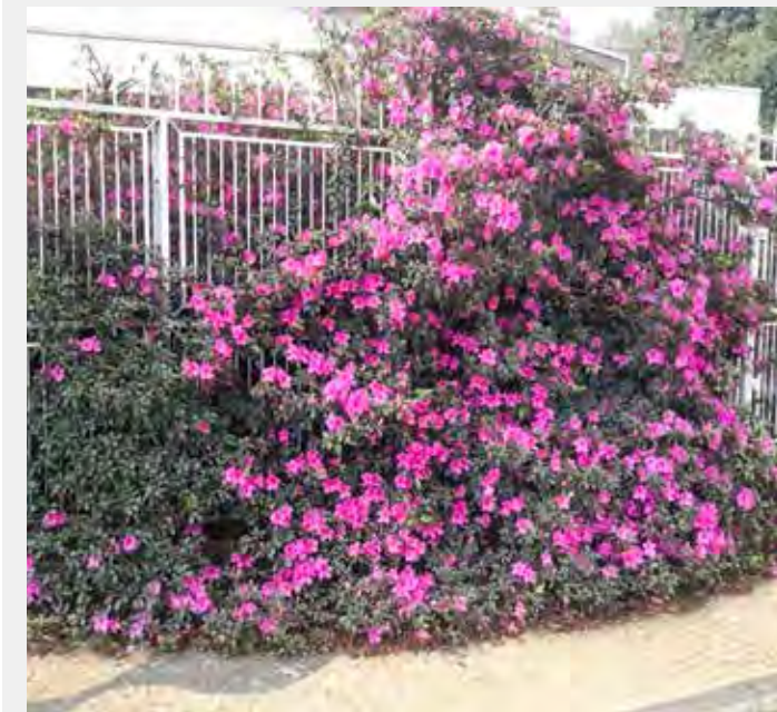
Arbusto de azaleia florida chama atenção de quem passa pela Avenida 30-A na Vila Alemã