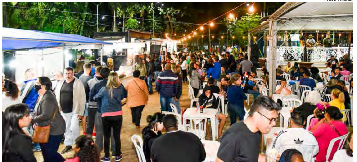
O evento está sendo realizado no Jardim Público, a partir das 10 horas

Nos food trucks o público vai encontrar espetinhos, batata no cone, pasteis, mini pizzas, cachorro-quente, milho verde, comida japonesa, lanches, porções, churros, crepe suíço, chuveite, refrigerantes, sucos, sorvetes, açaí, caldo de cana, doces e bebidas. Também haverá espaço com brinquedos para crianças.