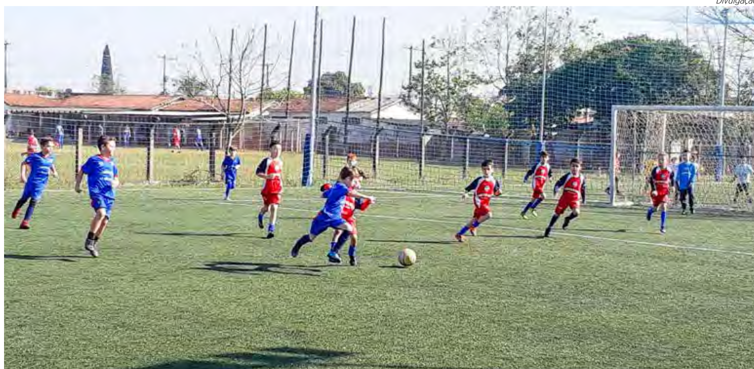
Dente de Leite tem rodada hoje

serão disputados no estádio III Distrital do Cidade Nova FC, que possui arquibancada e serviço de bar, para receber pais e responsáveis da garotada que acorda bem cedo nas manhãs de sábado, pra bater um bolão e correr atrás dos seus sonhos no campeonato dente de leite. Confira a tabela de jogos: