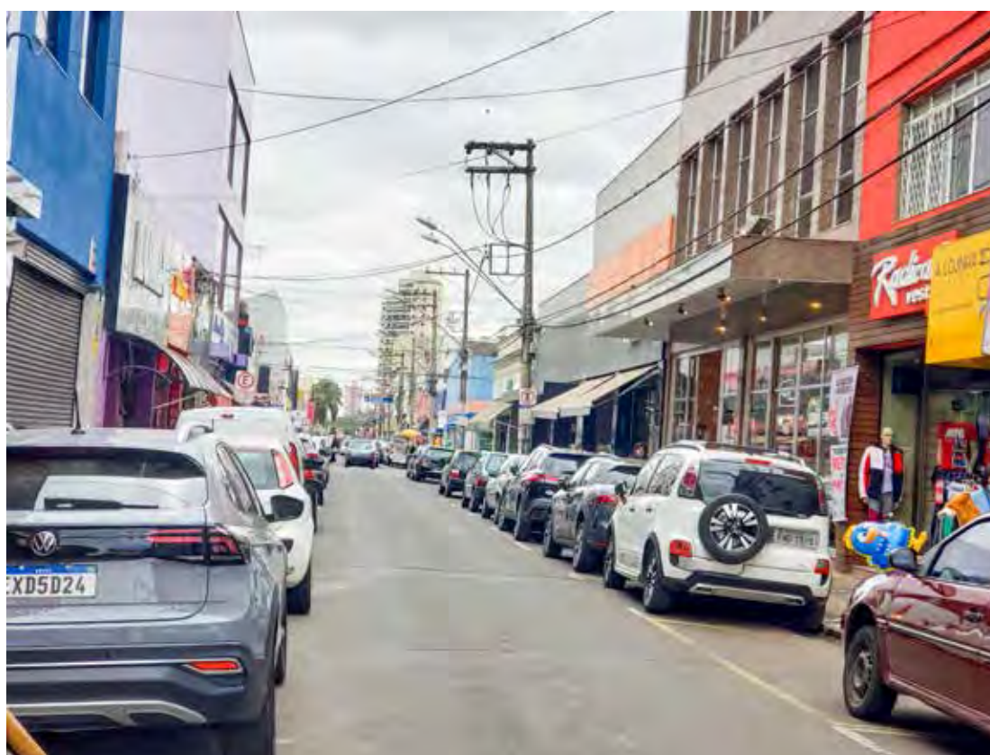
As lojas do comércio de rua funcionam das 9 às 18 horas neste sábado (13) em Rio Claro

O Dia dos Pais é a primeira data comemorativa do segundo semestre e a quarta melhor para o comércio em