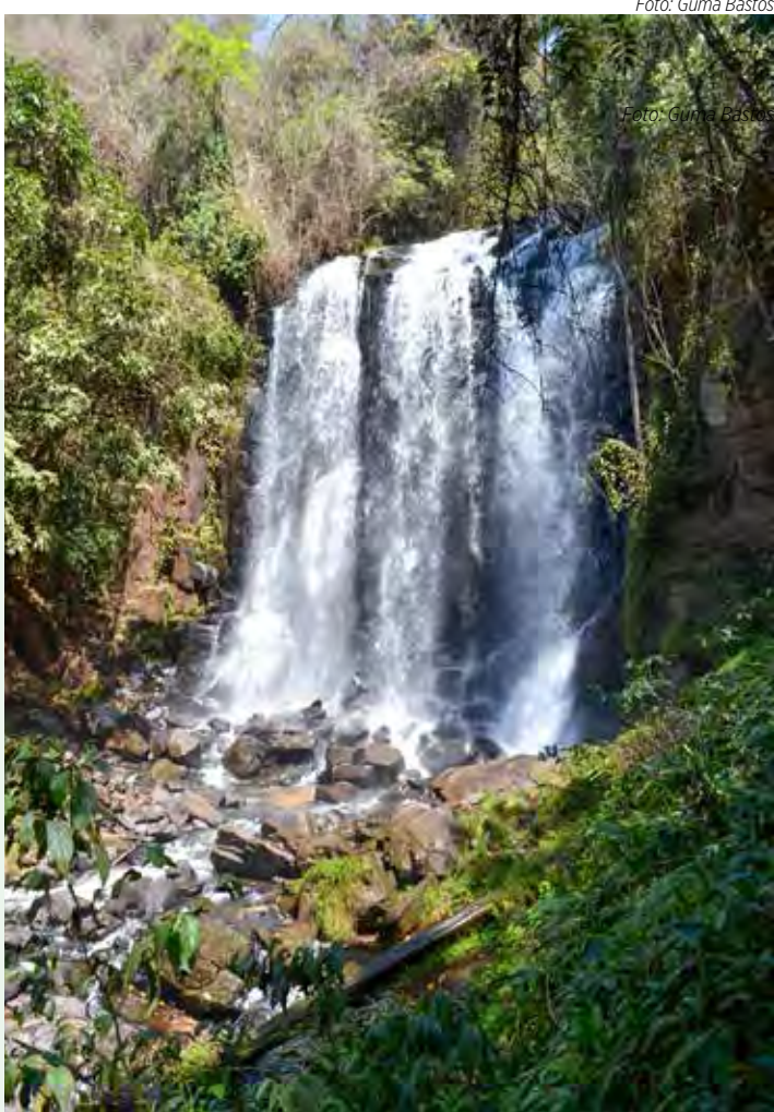
Cachoeira Monte São, em Analândia