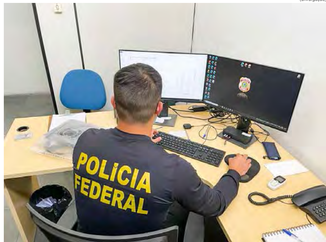
Durante o cumprimento da ordem judicial foram apreendidos 01 notebook e um aparelho de telefone celular

O indiciado, preso preventivamente por conta da comprovação da posse do material,