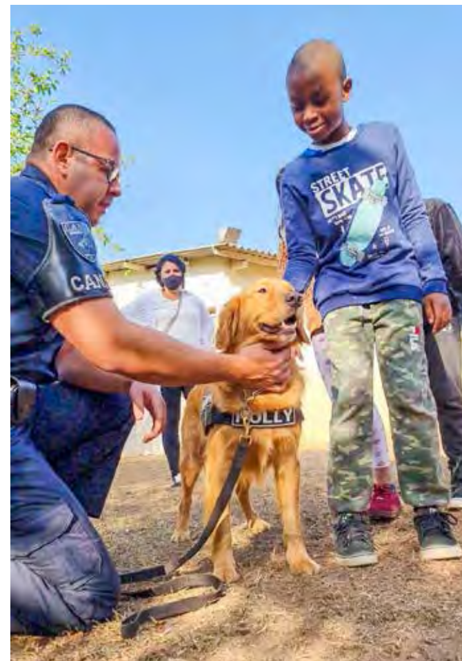
Palestra foi realizada para 300 alunos que tiveram contato também com o o cão Holly do Projeto Cinoterapia

Alunos da Escola Municipal Professor Victorino Machado receberam as orientações