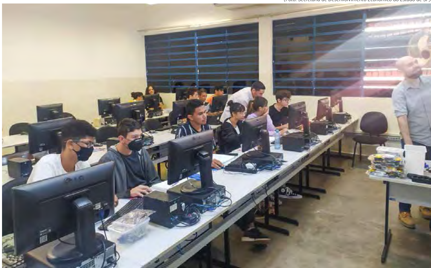
Em Rio Claro são 150 vagas disponíveis para diversas áreas. Os cursos acontecem nos formatos presencial e remoto

Os cursos têm duração de 120 horas e foram desenvolvidos para atender às demandas atuais do mundo do trabalho e aos interesses dos jovens que querem se destacar na hora de buscar seu primeiro emprego. As aulas poderão ser realizadas ao longo de quatro meses nos