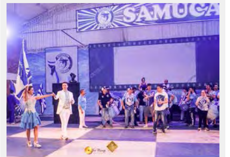
Evento teve como objetivo selecionar participantes para a Ala dos Passistas para o desfile de Carnaval 2023