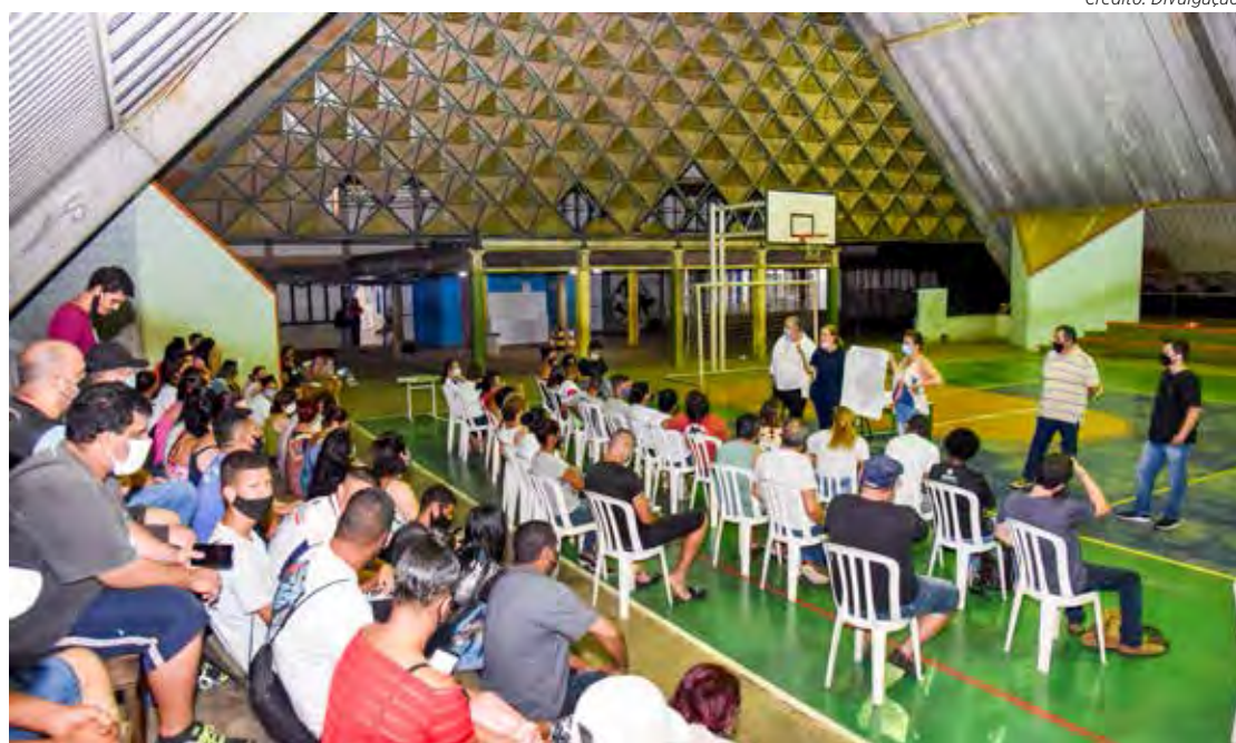
População pode opinar sobre o Plano Diretor participando das audiências públicas

O material de divulgação preparado pela Secretaria Municipal da Comunicação lembra que plano diretor é definido por lei municipal e influencia diretamente a vida das pessoas no município. Cita também que nesse planejamento deve prevalecer o interesse coletivo e, para isso, deve envolver o conhecimento dos especialistas e a necessidade da comunidade. O resultado desse planejamento é um plano que identifica as vocações, os pro-