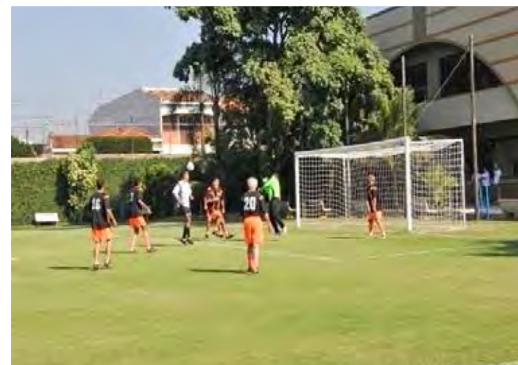
Futebol de campo Grêmio Recreativo recebe iluminação