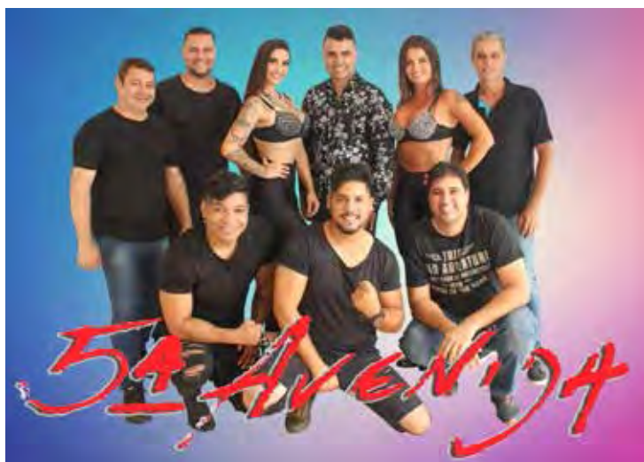
Banda 5ª Avenida no Salão de festa da Aspacer em Santa Gertrudes

LET'S GO ALTERNATIVE BAR – No domingo (7), das 10h às 18h, tem Feira de Discos Afins e muito mais. Endereço: Rua 2 n.º 334 – Centro – Santa Gertrudes.