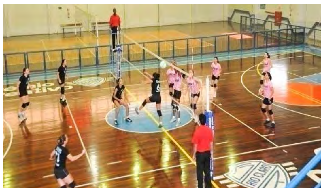
Ginásio do Grêmio Recreativo.

Porém, o Grupo 2 da Copa Paulista, no qual está o Azulão da Rua 9, tem marcado para esta sexta-feira (5), uma partida, entre as equipes do Lemense e XV de Piracicaba, que jogam no estádio Bruno Lazzarini, em Leme, a partir das 19h30.