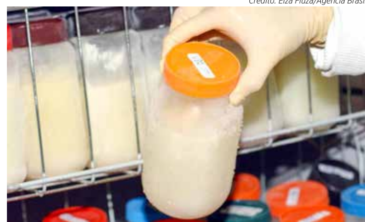
A população pode ajudar doando potes de vidro para armazenamento do leite materno doado

Depois, o armazenamento é feito em cadeia de frio rigorosamente controlada, passando por vários processos como a seleção, classificação, e o nível de calorías do leite, exames microbiológicos de coliformes totais, a pasteurização e fracionamento.