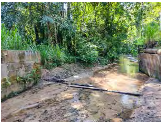
Trilha na Feena segue interditada por atraso na recuperação de ponte