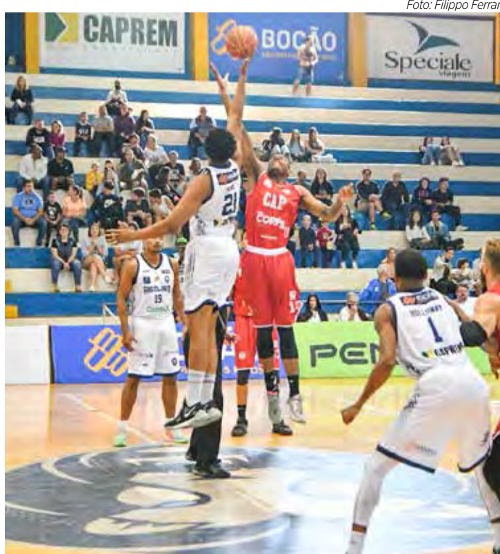
Rio Claro Basquete joga hoje pelo Paulista

Reforçado de 8 atletas em relação ao time que disputou o NBB no primeiro semestre, o Rio Claro Basquete, apesar das derrotas, nos dois primeiros jogos do Paulista, mostra que está em evolução, e pode surpreender no jogo de hoje, trazendo uma vitória de Bauru.