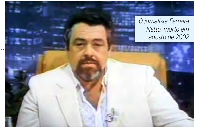
O jornalista Ferreira Netto, morto em agosto de 2002