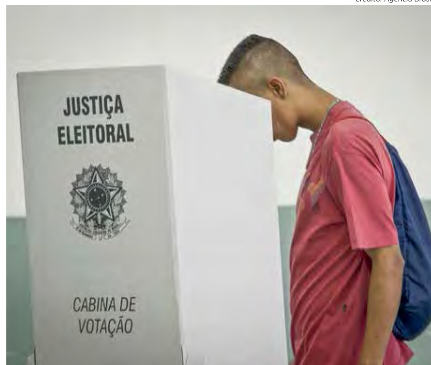
Rio Claro tem 17.058 eleitores de 16 a 24 anos aptos a votar nas eleições de outubro deste ano