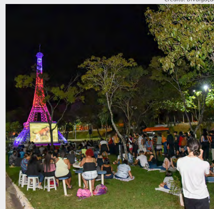
O telão será montado ao lado da réplica da torre Eiffel.