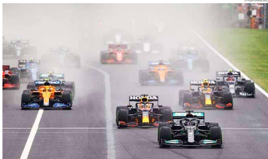
Tradicional prova é a última antes da pausa de verão da categoria, retornando apenas no fim de agosto