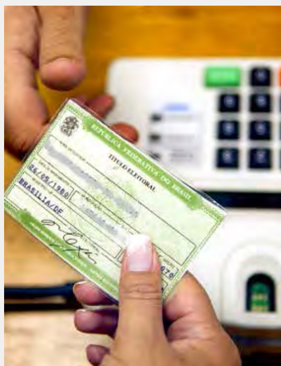
Título eleitor deve ser apresentação do dia da votação

Neste ano, estão em disputa os cargos de presidente da República, governador, senador e deputado federal, deputado estadual ou distrital.