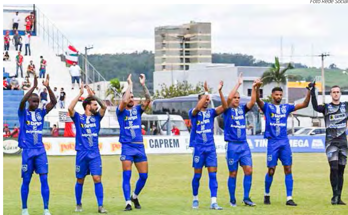
Rio Claro FC em campo hoje, pela Copa Paulista

A 5ª rodada do Grupo 2 da Copa Paulista será completada amanhã, com mais 2 jogos. Às 15h00, em Porto Feliz, o líder Desportivo Brasil enfrenta a equipe do São Bento. No mesmo horário, em Indaiatuba, o Primavera recebe o XV de Novembro de Piracicaba. A classificação do Grupo 2 tem a liderança do Desportivo Brasil com 12 pontos ganhos. Em segundo lugar, estão São Bento e Primavera, empatados com 7. O XV de Piracicaba é o quinto colocado, com 5. E na rabeira da tabela, estão Lemense e Rio Claro, com apenas 1 ponto ganho.