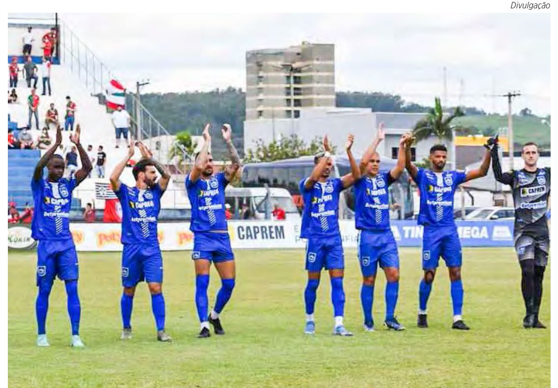
Jogadores do Azulão entram em campo hoje em busca da primeira vitória

De acordo com o TSE, o número de eleitores com menos de 18 anos no município cresceu 60,18% nos últimos quatro anos. Em 2018, a cidade tinha 693 jovens dentre 16 e 17 anos aptos a votar e, neste ano, são 1.110 nessa faixa etária. Página 7