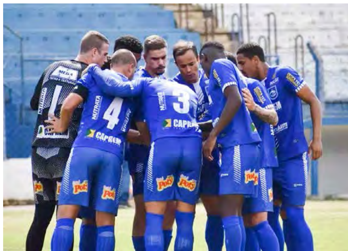
Rio Claro FC foca reação na Copa Paulista

Na abertura da 4ª. rodada do Grupo 2 da Copa Paulista, o XV de Piracicaba foi derrotado em casa pelo Desportivo Brasil, na última quarta-feira (20), por 3x4. Hoje, no estádio Walter Ribeiro, em Sorocaba, jogam São Bento x Lemense, a partir das 15 horas, com transmissão ao vivo pela TV Cultura e Canal Eleven.