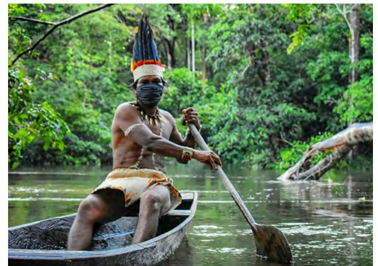
Povos Indígenas e Meio Ambiente

sistentes às mudanças climáticas – Os povos indígenas cultivam um conjunto de espécies nativas de cultura, com maiores variedades, que são mais resistentes as secas, altitudes, inundações e outras condições extremas. Essas plantações poderiam ser usadas de forma ampla nas fazendas, construindo uma resiliência e auxiliando a enfrentar as mudanças climáticas.