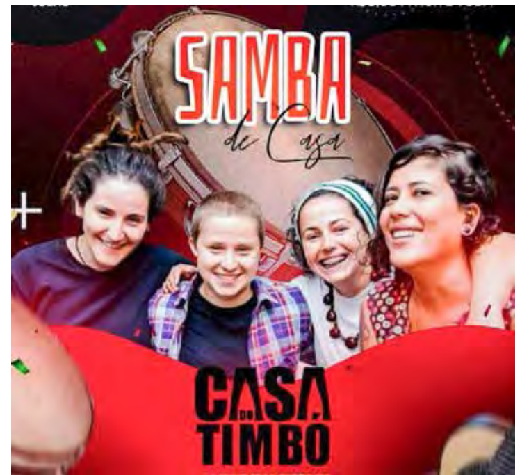
Grupo Casa do Timbó no La Se7e