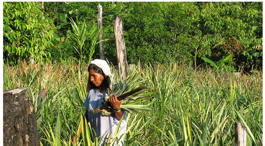
Povos indígenas um dos maiores conhecedores de ervas naturais do ambiente.

A proteção dos direitos dos povos indígenas é essencial, pois os mesmos são gestores importantes na busca de soluções para as mudanças climáticas e um mundo com menos fome, com ações concretas baseadas nesses protetores ambientais.