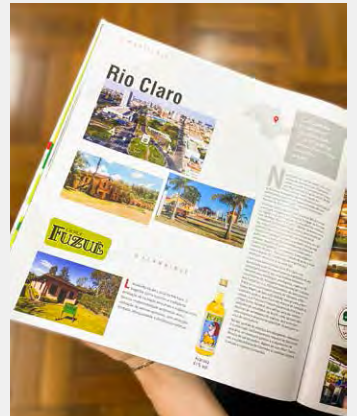
Livro "Cachaça SP - Alambiques do Estado de São Paulo" destacou Rio Claro