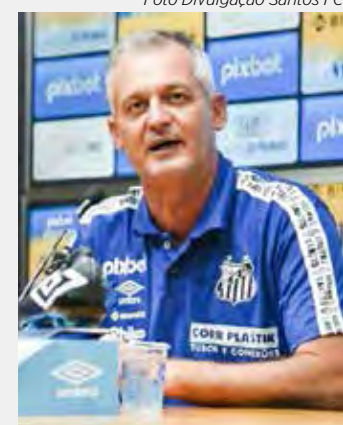
Lisca assume o Santos FC

O Atlético Mineiro, não ficou atrás. A equipe não re-