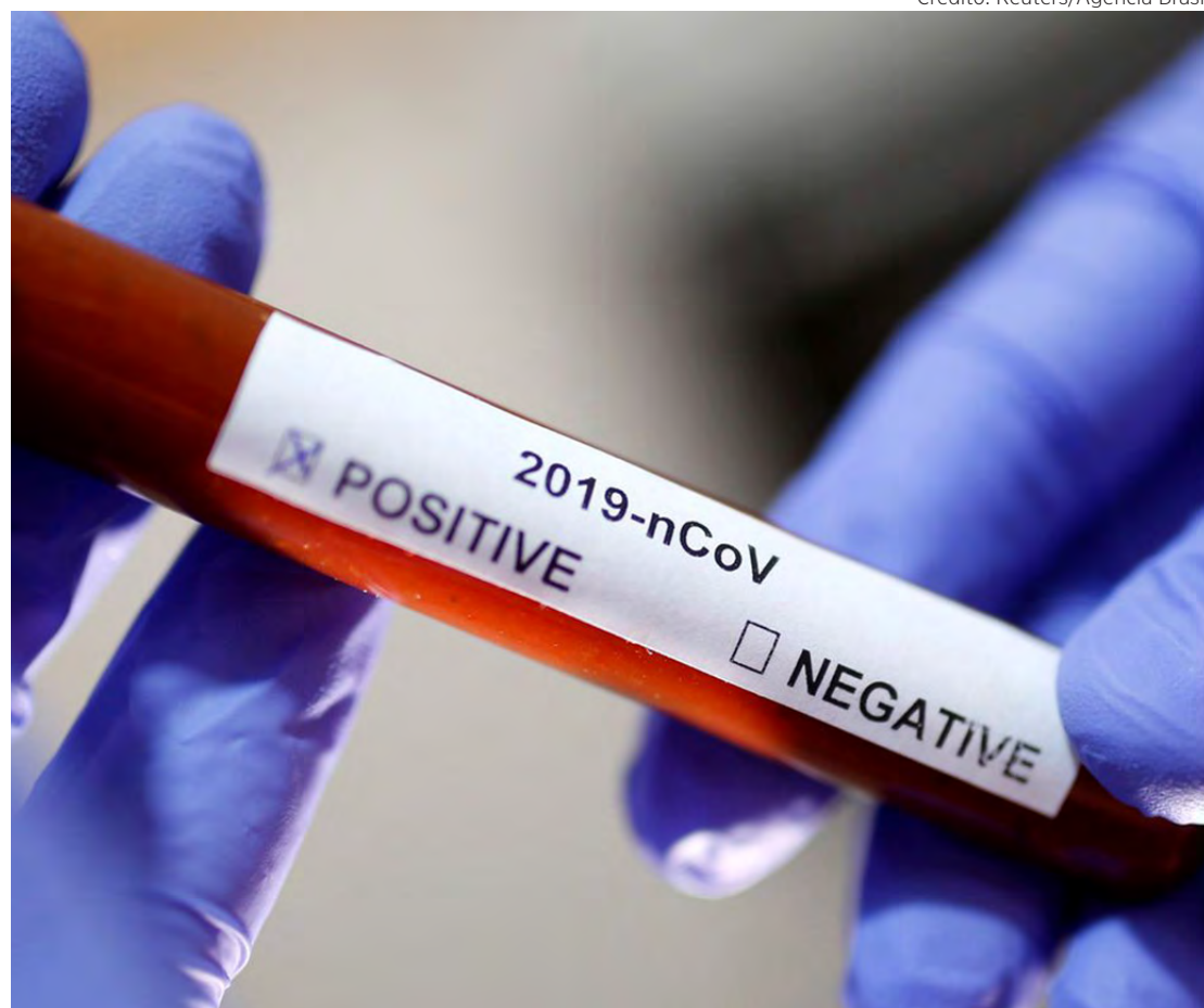
O boletim registra também 167 novos casos de Covid-19, totalizando 32.102 infecções.