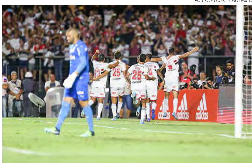
Tricolor em campo neste sábado

Ainda neste sábado (23) pelo Brasileirão, um pouco mais tarde, às 21 horas, o Botafogo recebe no estádio Nilton Santos, no Rio de Janeiro, o Athletico Paranaense. A rodada prossegue no domingo (24), com mais 7 jogos, e será encerrada na segunda (25), com a partida entre Coritiba e Cuiabá.