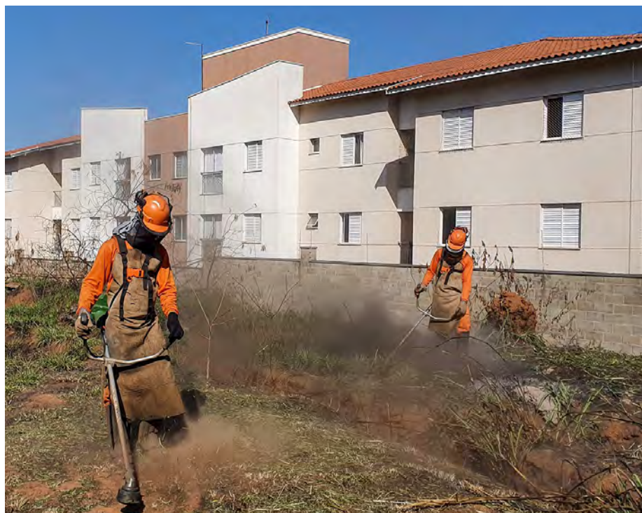
Chácara Lusa recebeu serviços de limpeza e corte de mato.

A prefeitura destaca que a população pode colaborar com a limpeza da cidade fazendo o descarte correto de materiais. O município conta com coleta de lixo em todos os bairros, sete ecopontos que funcionam diariamente e serviços de coleta seletiva e cata bagulho.