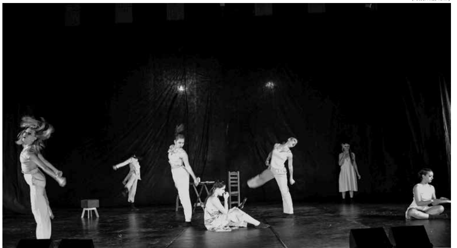
Bailarinas da Cia de Dança Kátia Corrêa se apresentam neste sábado (23) em um dos palcos do Festival de Joinville

A Cia já participou de outros grandes festivais como Fifest em Santos, RV Festivais,