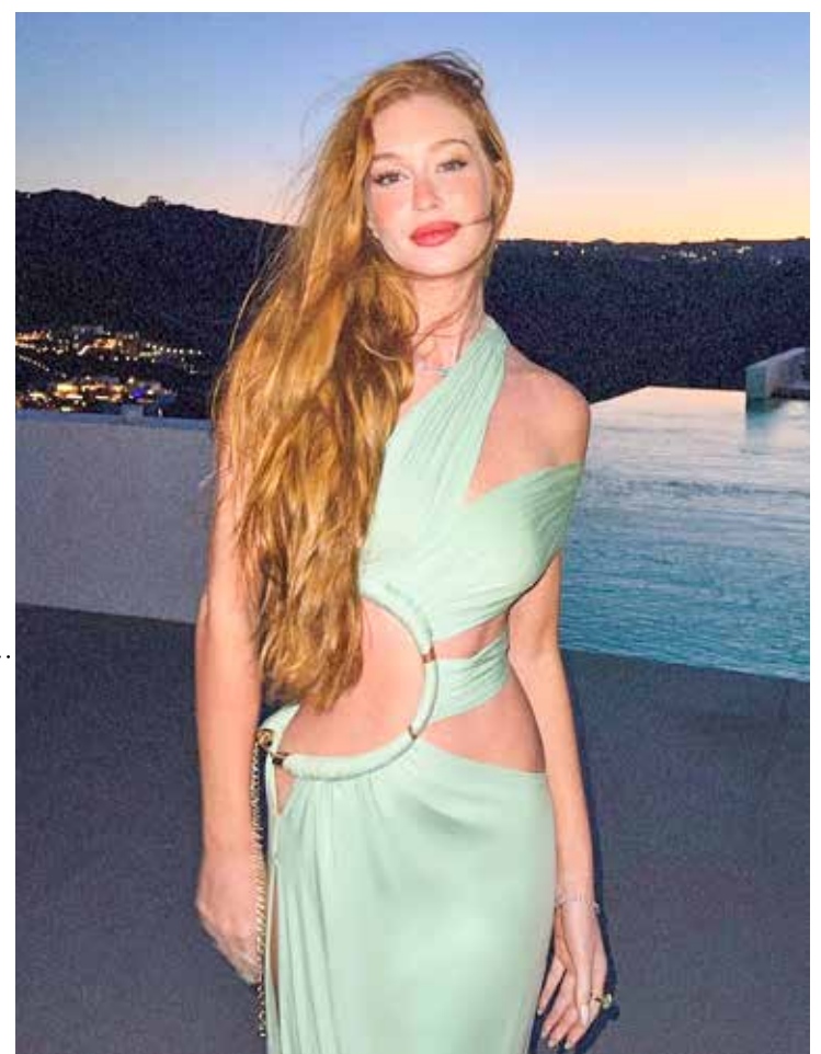
Sucesso na TV e na internet: Marina Ruy Barbosa tem mais de 40 milhões de seguidores no Instagram