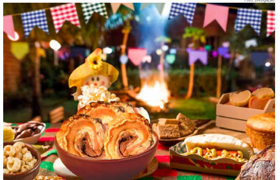
O Arraiá da Pururuca tem muitas opções gastronômicas e atrações musicais

*Entrada gratuita (estacionamento pago).