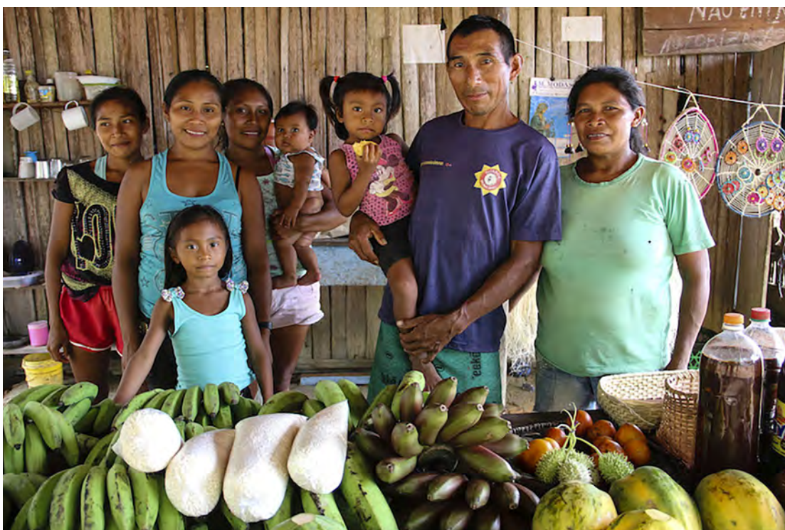
Indígena e Agricultura Sustentável

Constituídos por apenas 5% da população mundial, os povos indígenas são considerados gestores vitais do meio ambiente, de acordo com a Organização das Nações Unidas para a Agricultura e Alimentação, áreas florestais ecologicamente biodiversas e intactas são gerenciadas por comunidades locais, famílias e pequenos proprietários indígenas.