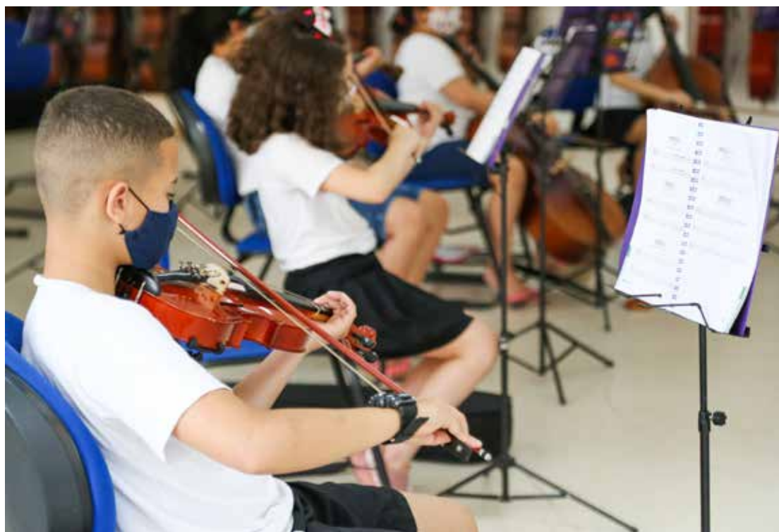
Alunos do Núcleo de Música em aula de Iniciação Instrumental

Para este semestre a unidade oferta as modalidades ballet e jazz. Serão oito turmas divididas por faixa etária que atenderão ao público infantil, jovem e adulto. As aulas iniciam em agosto e o término está previsto para dezembro com uma grande mostra.