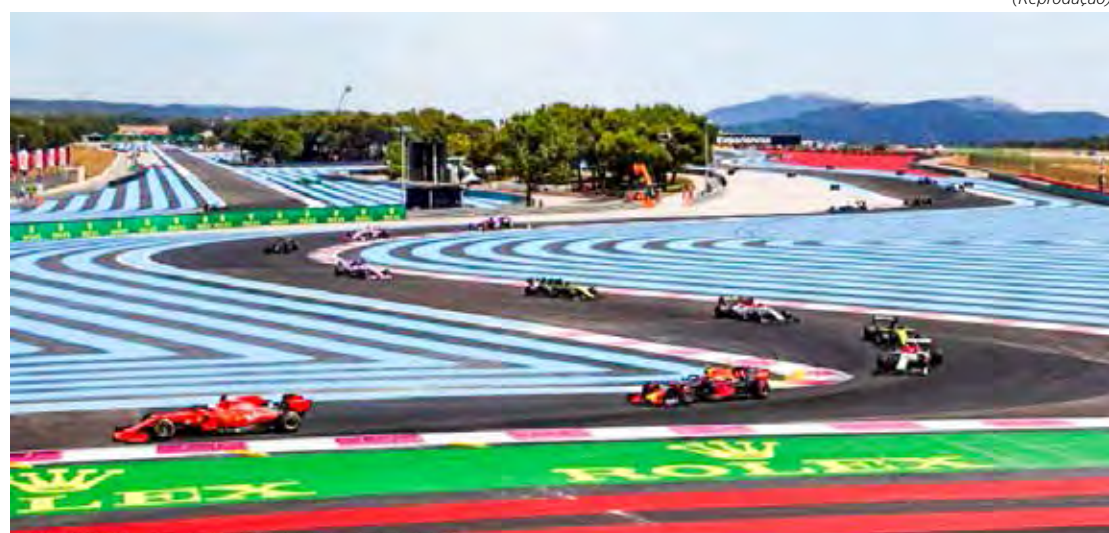
Possível última passagem da categoria por Paul Ricard, a penúltima antes da pausa de verão