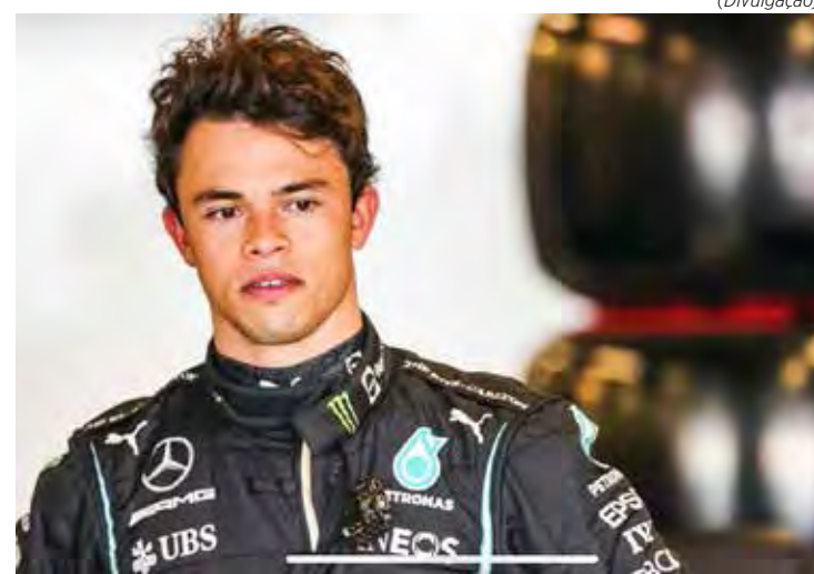
Campeão da FE na equipe Mercedes vai substituir Hamilton no TL1 em Paul Ricard

Com isso, a Mercedes F1 escolheu o holandês Nick de Vries que foi campeão da Fórmula E em 2021 e que já participou de