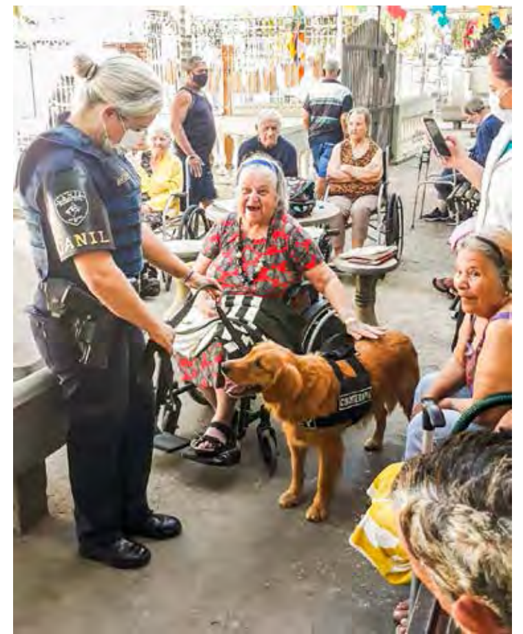
Esta foi mais uma visita do Cão Holly com equipe do Canil da GCM ao local