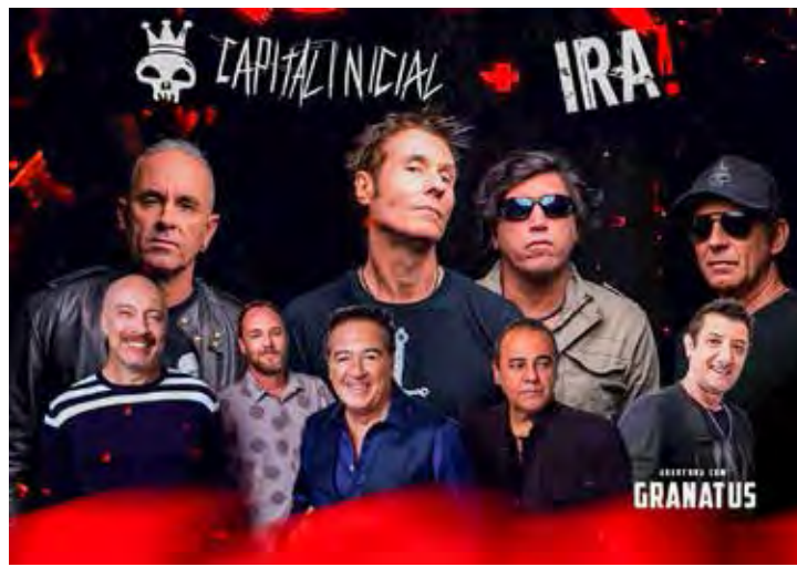
Capital Inicial - Grupo Ira e Granatus no Grêmio Recreativo