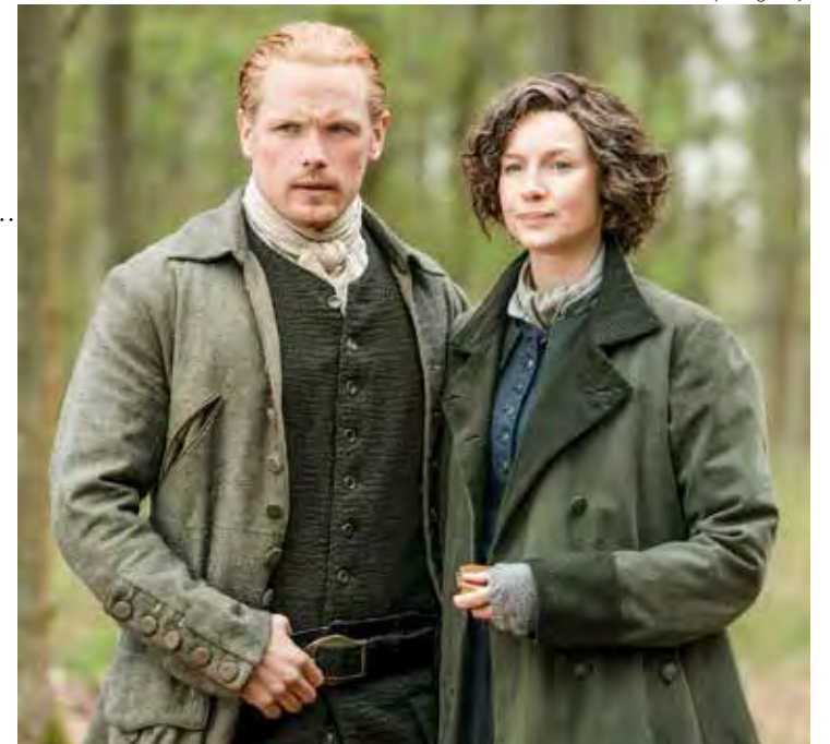
Sam Heughan e Caitriona Balfe, atores da série “Outlander”