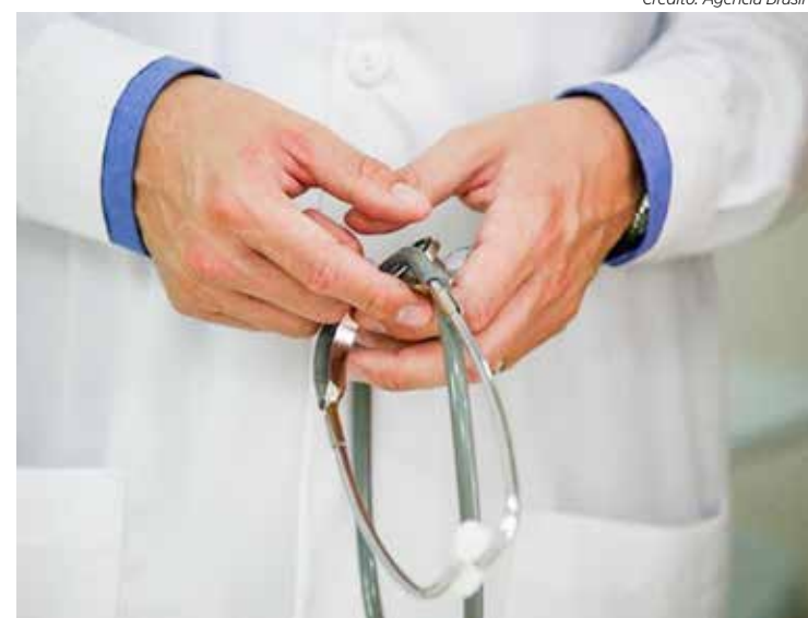
Projeto de lei autoriza estágio dos estudantes de medicina nas unidades públicas de saúde do município

Além de projeto, os vereadores discutem outros sete projetos na sessão ordinária desta segunda (18). Um deles institui no município o Dia dos Colecionadores, Atiradores e Caçadores (CAC), a ser comemorado no dia 9 de julho. Ainda sobre o CAC, outra proposta em votação reconhece o risco da atividade e ameaça à integridade física dos profissionais envolvidos.