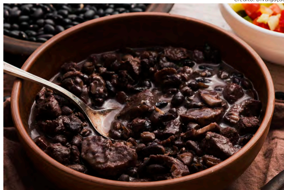
A Feijoada Beneficente começará ao meio-dia e terá música ao vivo.

A Feijoada Beneficente começará ao meio-dia e terá música ao vivo para animar a festa. Bebidas e sobremesas serão cobradas a parte, assim como o estacionamento.