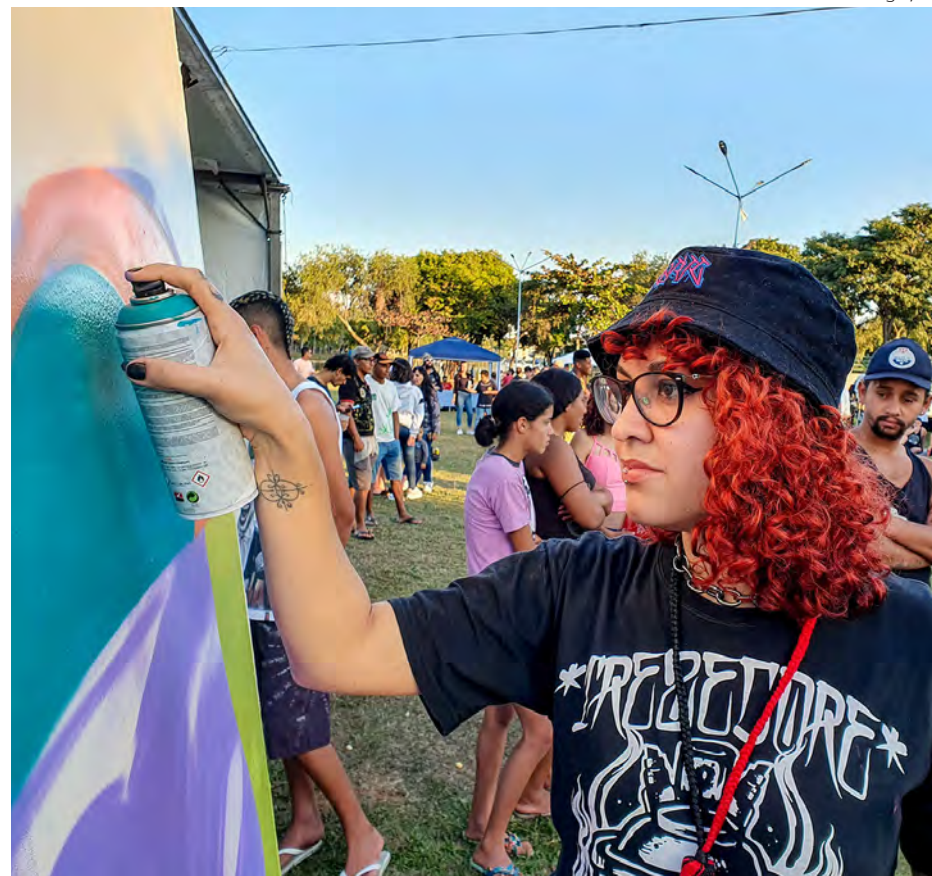
A arte do grafite estará presente no encontro de hip hop deste domingo.