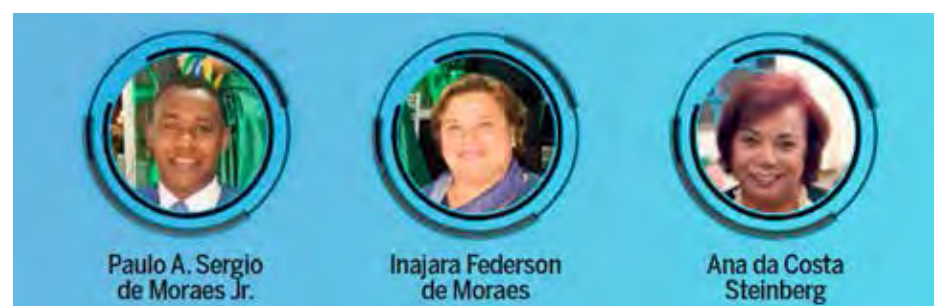
Conselho Deliberativo empossado