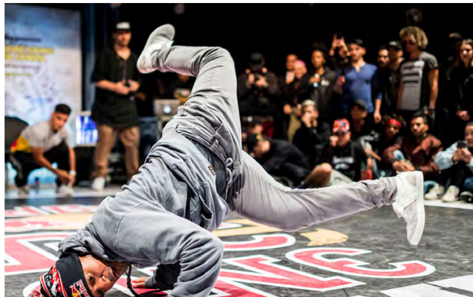
O encontro deste domingo também terá roda de capoeira livre, dança com B. Boys e B. Gilrs.