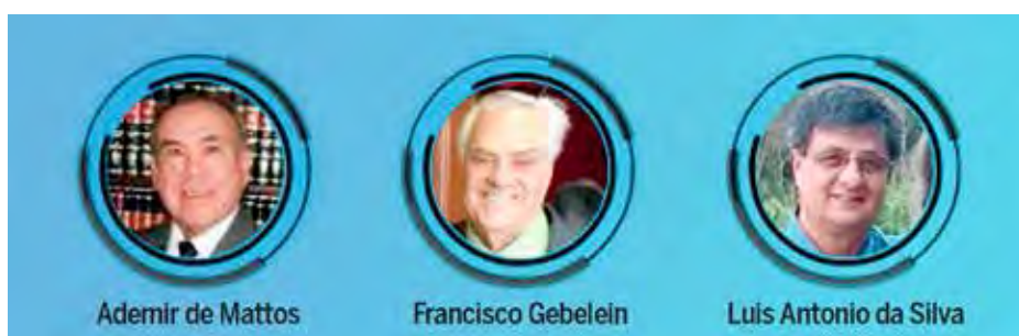
Conselho Fiscal empossado