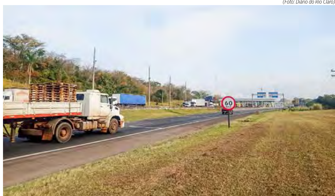
Em 2021, foram contabilizados 332 acidentes nos acostamentos da malha concedida do Estado, destes 268 foram choques entre veículos e 49 atropelamentos

Ao contrário do que muitos motoristas pensam, acostamento não é pista de rolamento, e sim um local específico para parar somente em casos de emergência. Desta forma, usá-lo para fazer ultrapassagens é expressamente proibido, bem como