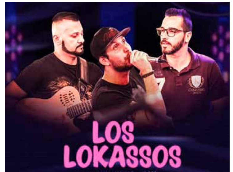
Los Lokassos no Vila do Chopp

SOBRADÃO EVENTOS – No domingo (17), a partir das 12h tem Feijoada Beneficente do Fun-