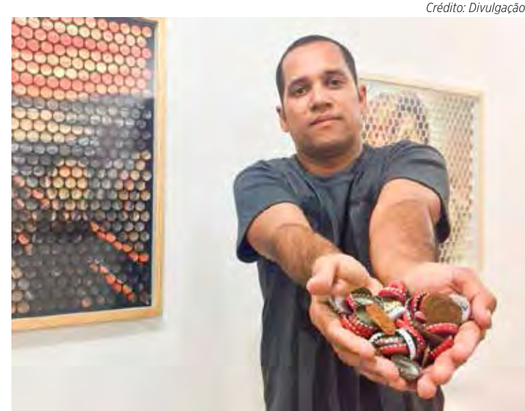
Borred é um dos expoentes na produção de peças artesanais confeccionadas com tampas metálicas de garrafa e bolachas de chopp

Para conhecer, acesse @ecotampas no Instagram. “Já retirei mais de dez toneladas de tam-