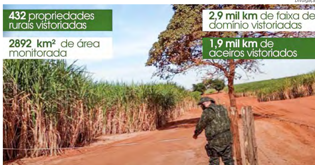
O trabalho foi realizado através da Operação Huracán II. Os profissionais vistoriaram 432 propriedades rurais em todo o estado de São Paulo

As ações conjuntas devem seguir sendo realizadas no período de estiagem, com previsão de término no mês de outubro.