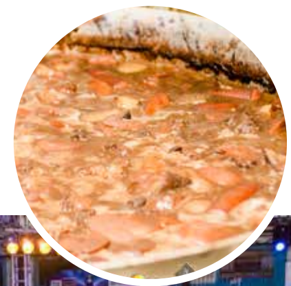
A comunidade da escola de samba vai preparar a feijoada