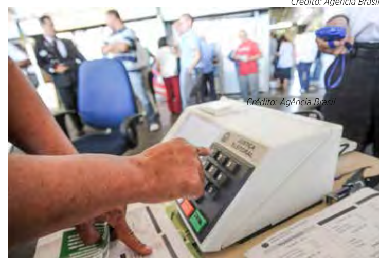
Urna - Rio Claro 156.393 eleitores aptos a votar nas eleições gerais de outubro deste ano

O eleitorado de Ipeúna soma 5.651 com 5.272 (93,29%) com cadastro biométrico. Itirapina tem 10.161 eleitores, com 9.553 (94,02%) com biometria. O número de eleitores de Santa Gertrudes é de 18.867, sendo que 17.555 (93,05%) já fizeram biometria.