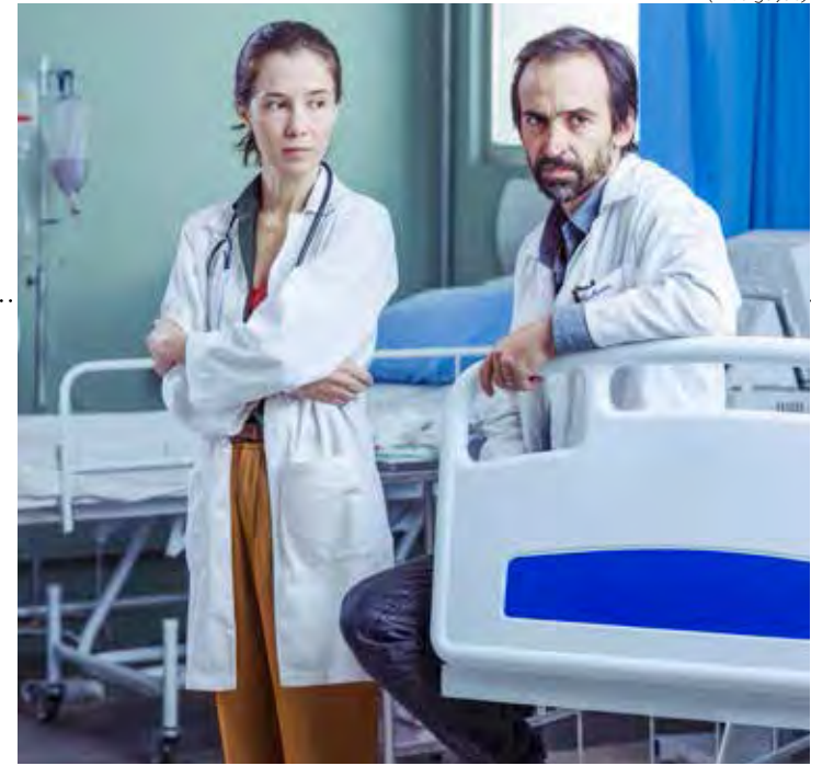
Atores da série Sob Pressão, Marjorie Estiano e Julio Andrade