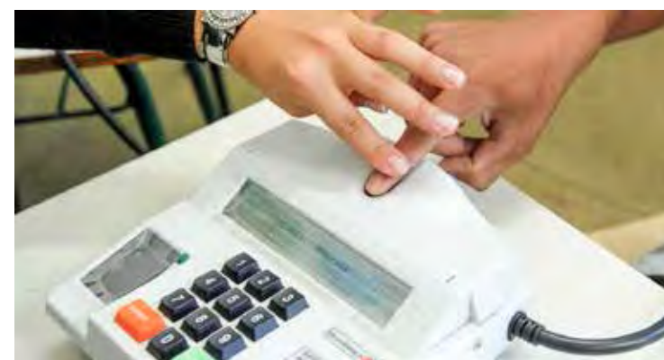
Biometria - Do contingente de votantes, 136.203 já fizeram a biometria no município