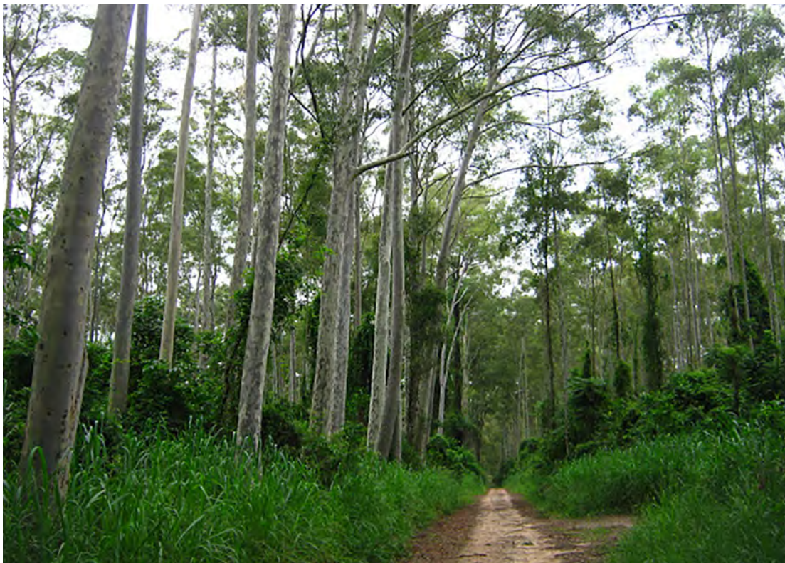
Floresta Estadual Edmundo Navarro de Andrade

O Dia de Proteção às Florestas é comemorado no dia 17 de julho, data criada devido à necessidade de reflexão sobre a conservação e proteção das florestas, pelo importante papel que desempenham para a preservação da vida e equilíbrio ambiental no Planeta Terra. As florestas são imprescindíveis devido à riqueza da biodiversidade (fauna e flora), fornecimento de recursos naturais como alimentos, plantas medicinais.