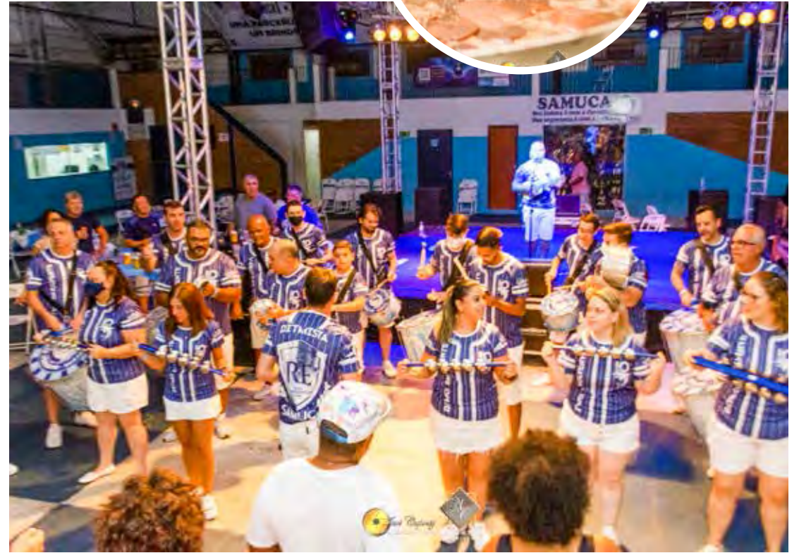
Será uma tarde de boa gastronomia brasileira e o melhor de nossa cultura musical