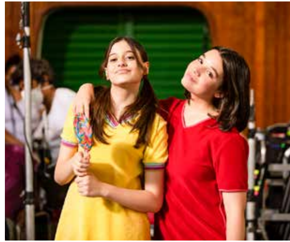
Crédito: Fábio Braga