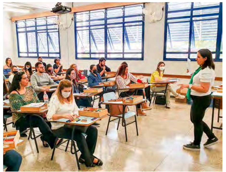
As atividades do simpósio contaram com a participação de 900 profissionais da educação