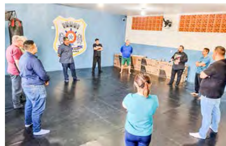
Durante esta capacitação os vigilantes patrimoniais receberam técnicas para o manuseio do bastão tonfa