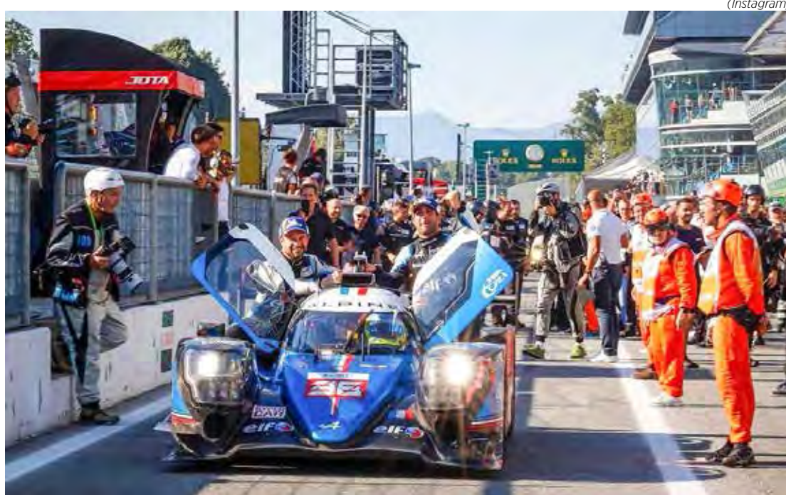
A Alpine Team ELF conquistou uma vitória memorável nas 6 Horas de Monza