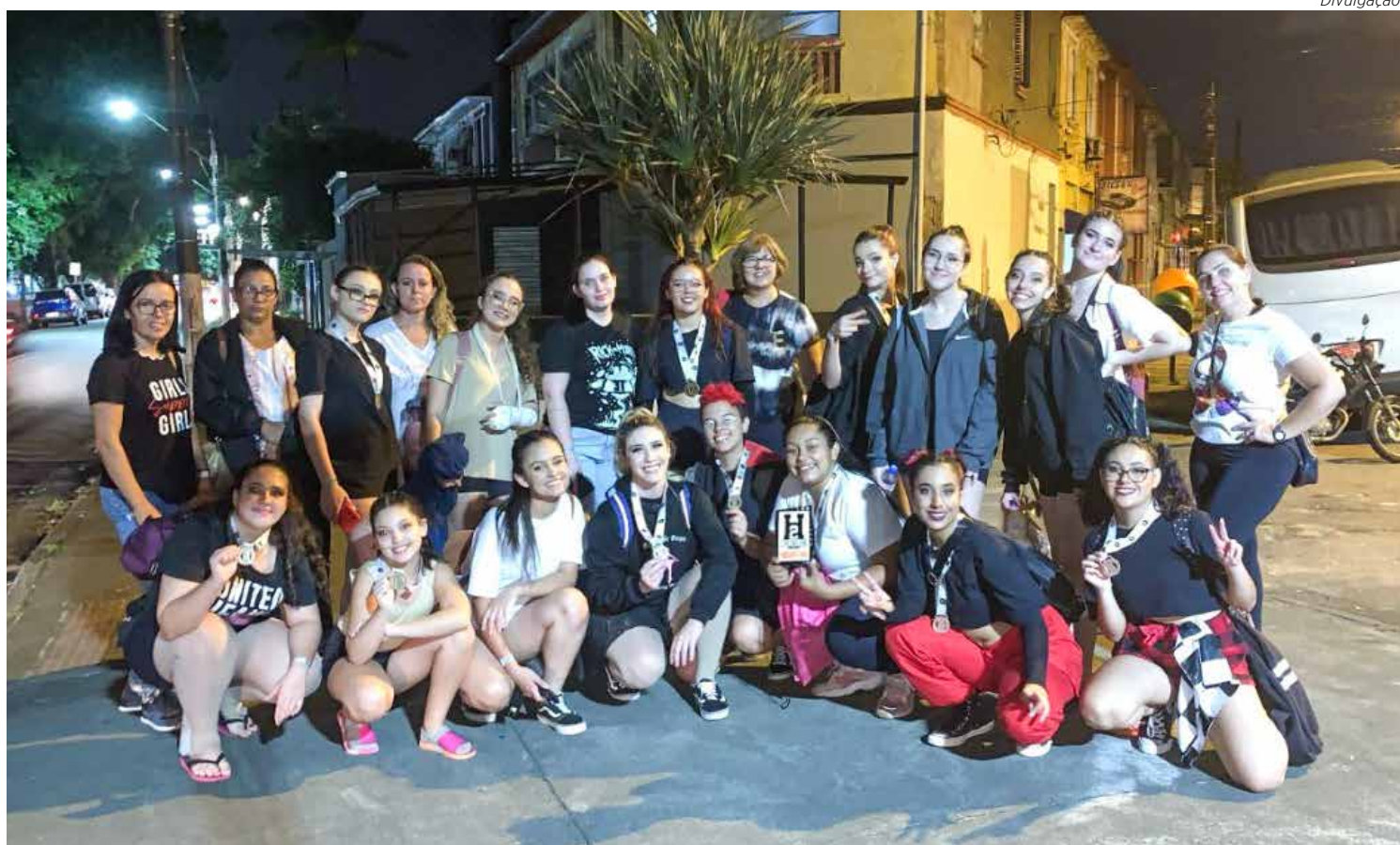
Alunas do Espaço de Dança Profª. Marta Brunelli

O Espaço de Dança Marta Brunelli está com inscrições abertas para novas alunas. As interessadas devem manter contato pelo fone: 19-99249-2692 (whatsapp). Entre os dias 5 e 6 de agosto, estará realizando um festival que promete ser dos mais bonitos e concorridos.