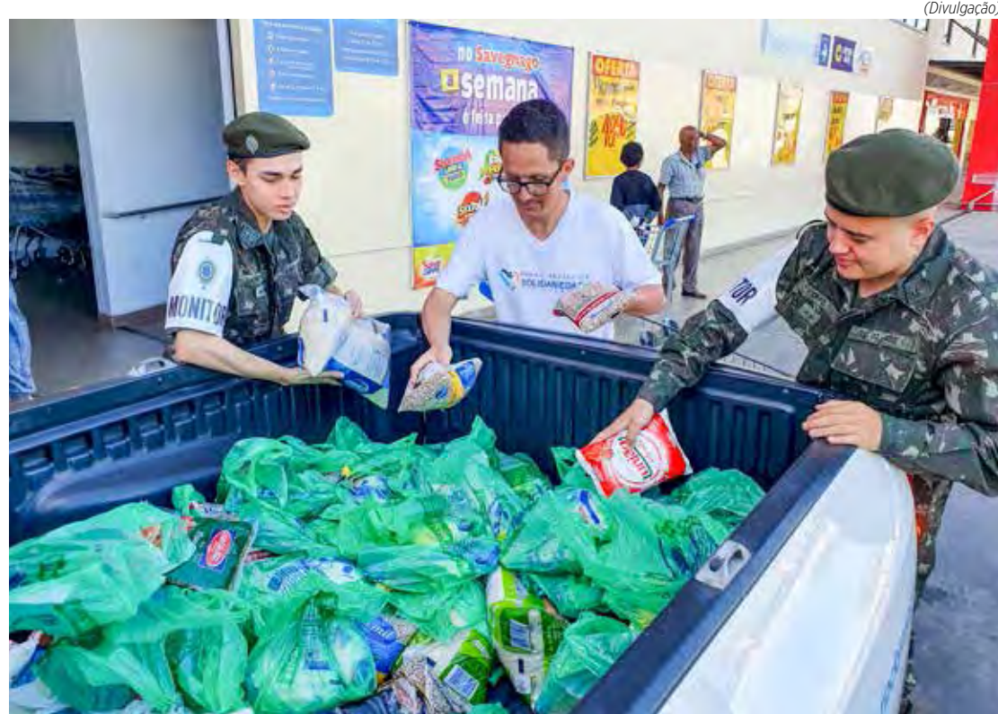
A arrecadação foi realizada nos supermercados Enxuto e Savegnago

A arrecadação foi realizada nos supermercados Enxuto e Savegnago, que ficam na Rua 14, e também teve participação do Tiro de Guerra. Os alimentos irão compor cestas básicas que o Fundo Social fornece para as famílias que mais precisam.