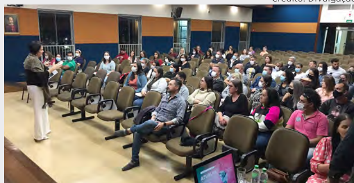
Profissionais de saúde participaram de capacitação e atualização de protocolo no setor de urgência e emergência.

O evento foi realizado pela Fundação de Saúde em parceria com a farmacêutica