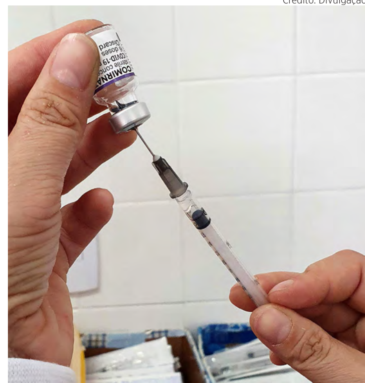
Vacina contra a Covid-19 está disponível em oito unidades de saúde em Rio Claro.

A vacina contra a gripe está liberada para todos com mais de 6 meses de idades e é realizada em todas as unidades de saúde da família e unidades básicas de saúde, com exceção do Boa Vista, que está em reforma.