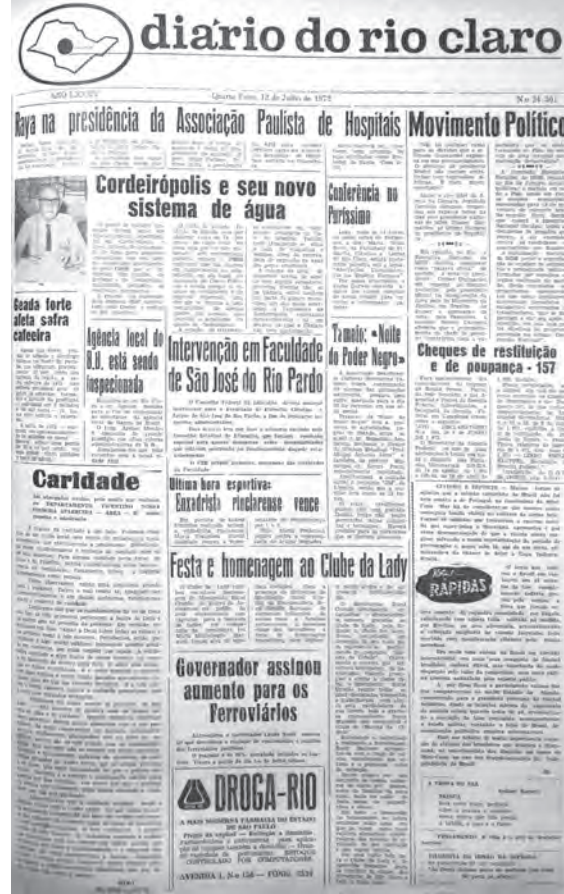
O original desta edição está disponível para consulta no Arquivo Público Municipal, mediante agendamento. Conheça todo o acervo permanente do Arquivo, que abriga as edições impressas do Diário.

As Manchetes que foram destaque no Diário há 50 anos!