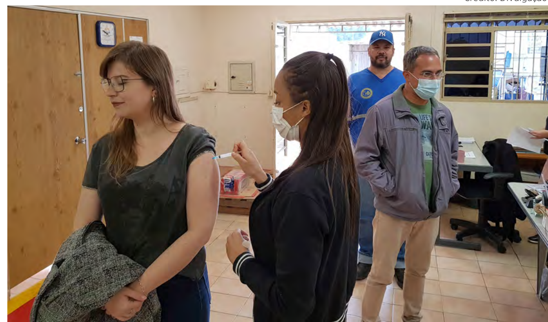
Funcionários do Daae receberam vacina contra a gripe e Covid-19.

A Fundação Municipal de Saúde alerta a população para a importância da vacinação e recomenda cuidados preventivos como o uso de máscaras, distanciamento social e higienização frequente das mãos.