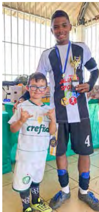
Campeonato Infantil premiou alunos -

crianças tiveram a oportunidade de se divertirem bastante participando de jogos lúdicos, num ambiente festivo e fraterno, dos quais também participaram pais e professores.