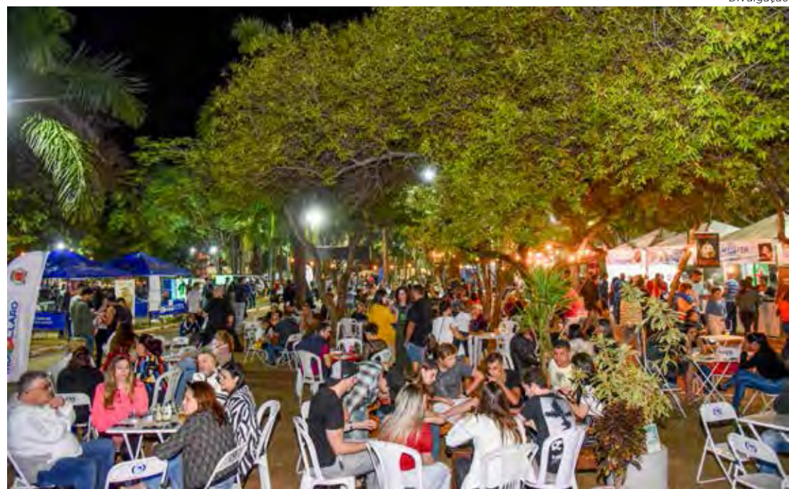
Festival Gastronômico recebeu milhares de pessoas durante os quatro dias do evento