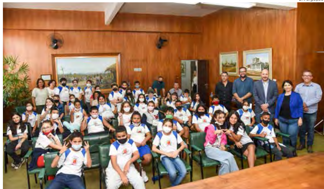
Estudantes que atuam como agentes ambientais estiveram na sexta-feira (8) no paço municipal

A visita foi realizada por grupo que representou todos os agentes ambientais do município. Rio Claro tem 700 alunos da rede pública municipal de ensino atuando como agentes ambientais em 27 escolas. Os números são referentes ao ano de 2022 e fazem parte do programa desenvolvido pela Secretaria Municipal da Educação e Secretaria Municipal do Meio Ambiente.