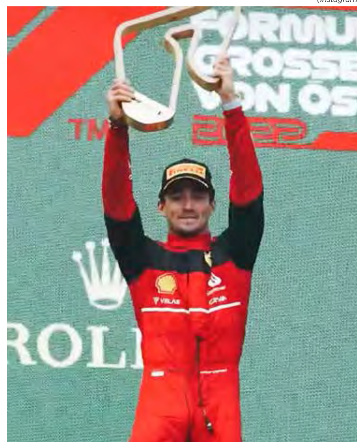
Charles Leclerc terminou na primeira posição depois de sete Grandes Prêmios e comemorou muito o triunfo no GP da Áustria

A Fórmula 1 tira uma semana de folga e retoma as atividades entre 22 e 24 de julho com o GP da França, 12ª etapa da temporada 2022.