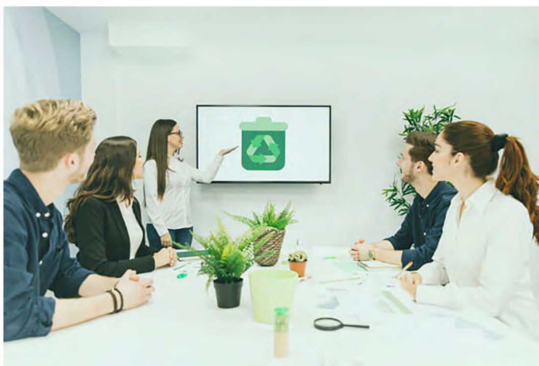
Workshop de Odontologia Sustentável

Os produtos usados na radiologia como fixador e revelador não possuem descarte correto, diariamente é preciso desmontar a amálgama em pedaços maiores pa-