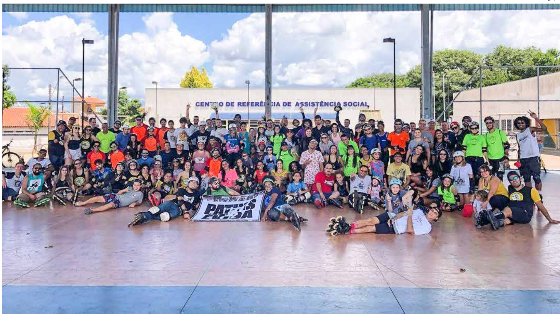
Participantes da primeira edição do Urban da Amizade em março de 2020

O evento é gratuito e podem participar patinadores de todas as idades e de todos os níveis de patinação. É só não esquecer os equipamentos de proteção. Quem puder doar leite e ajudar o traba-