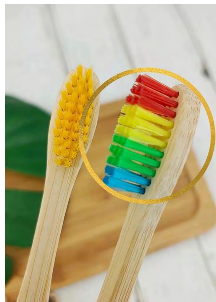
Escova dental sustentável de bambu biodegradável.

O consumo de energia dos consultórios também é assunto importante a destacar, pois autoclaves e compressores não têm selo de sustentabilidade. Também todos os anos o meio ambiente recebe 100 mil de toneladas de plástico, só de escovas de dente; o profissional deve se envolver com o tema, interagindo com o seu pacien-