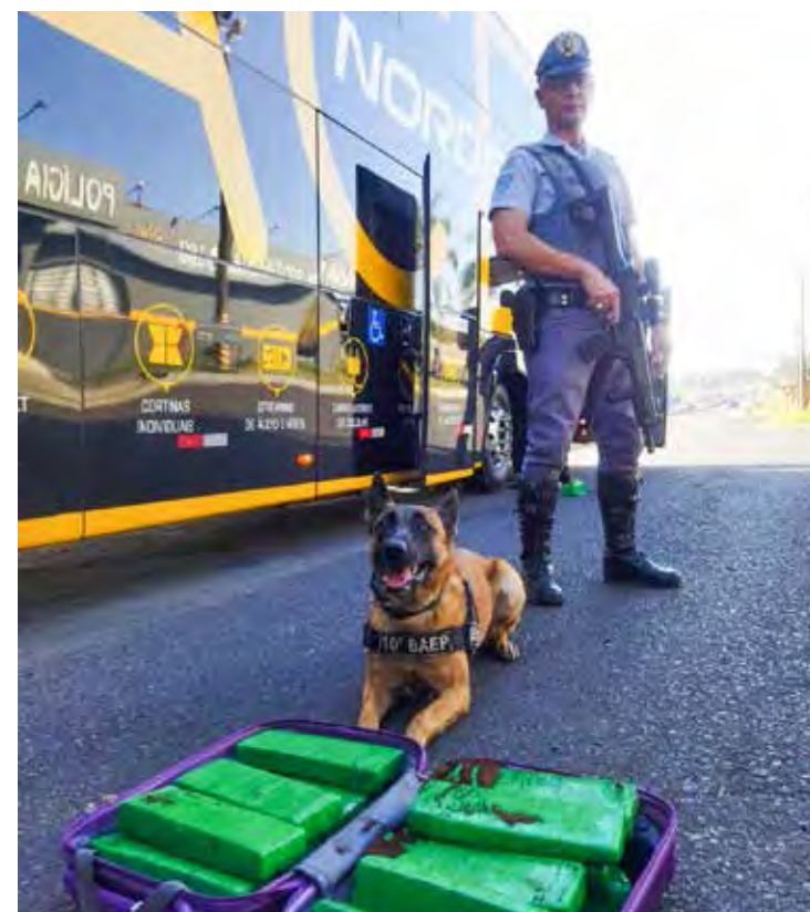
Dois tabletes de maconha estavam com a passageira, os outros 15 foram encontrados em uma mala

a vistoria no interior do ônibus foram localizados com uma das passageiras dois tabletes de maconha, sendo efetuada a sua prisão em flagrante. Ao continuar a vistoria no compartimento de cargas, com apoio do cão Pandora, foi localizada uma mala contendo mais 15 tabletes da mesma droga. A mesma passageira, que havia sido presa, confessou ser de sua propriedade e que havia recebido os outros dois tijolos como forma de pagamento.