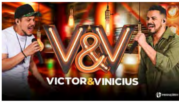
Victor & Vinicius no Chopp & Cia.

domingo (3) das 11 às 13h o Grêmio Seresteiro realiza as Manhãs de Seresta na Sociedade Filarmônica, com participação de vários cantores seresteiros, entrada gratuita. Av. 5 esquina com a rua 5.