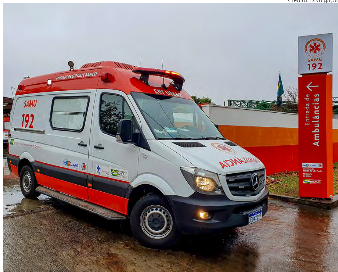
Ambulância do Samu para atendimento de ocorrências.