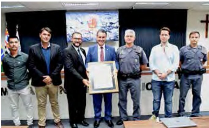
Deputado federal Capitão Augusto recebeu título de Cidadania no Plenário da Câmara