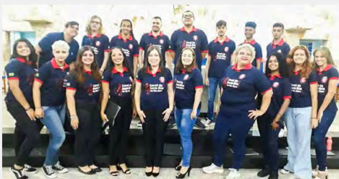
O evento acontece no Teatro de Arena do Museu Amador Bueno da Veiga, às 20h, com entrada franca