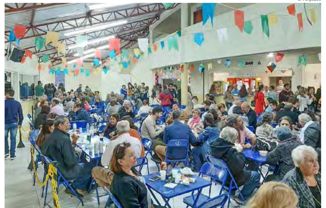
Grande público deve prestigiar a quermesse na Paróquia Nossa Senhora Aparecida

Equipes da Operação Narco Brasil apreenderam 17 tijolos de maconha com passageira de ônibus na Rodovia Washington Luís nesta sexta (1º). A mulher foi presa em flagrante. Página 6