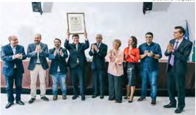
Deputado Baleia Rossi e autoridades na solenidade de entrega do título