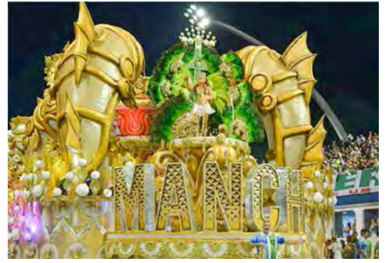
Mancha Verde, campeã do carnaval em São Paulo