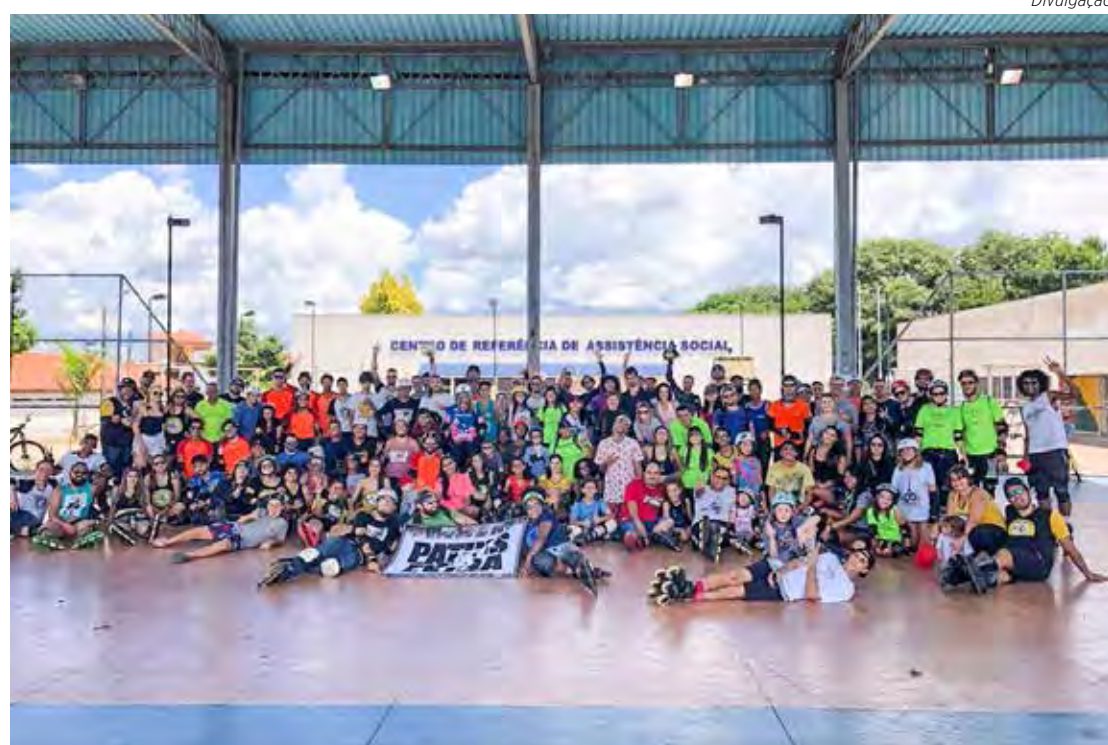
Participantes da primeira edição do Urban da Amizade em março de 2020

Ruas e avenidas do bairro São Miguel serão recapadas pela prefeitura neste sábado (2). Para realização do serviço, o trânsito em trechos das avenidas 72-A e 74-A ficará interdito. Página 7