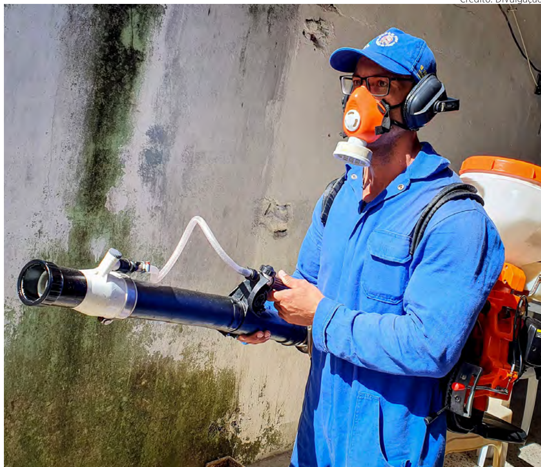
A nebulização faz parte das ações preventivas contra o mosquito.