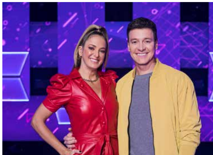
Ticiane Pinheiro e Rodrigo Faro

William Waack também teve que se afastar por um rotavírus. Está sendo acompanhado pelos médicos para saber como melhor tratar e se recuperar mais rapidamente.