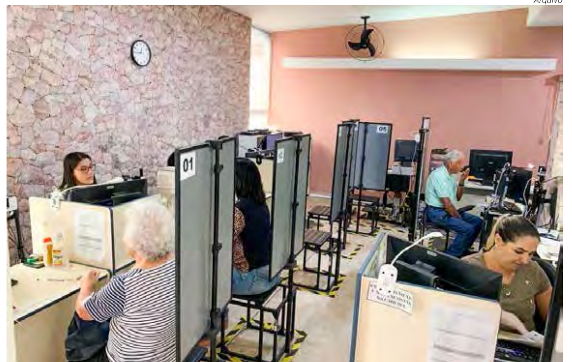
Importante que o interessado se inscreva com antecedência, porém não tem data limite

rios públicos, na faixa de 30 a 40 anos, foram os que mais se inscreveram até o momento. Todas as pessoas que atuarem seja como voluntária ou convocada recebem os mesmos benefícios. O mesário universitário conta ainda com 30 horas de crédito na grade extracurricular. Página 7