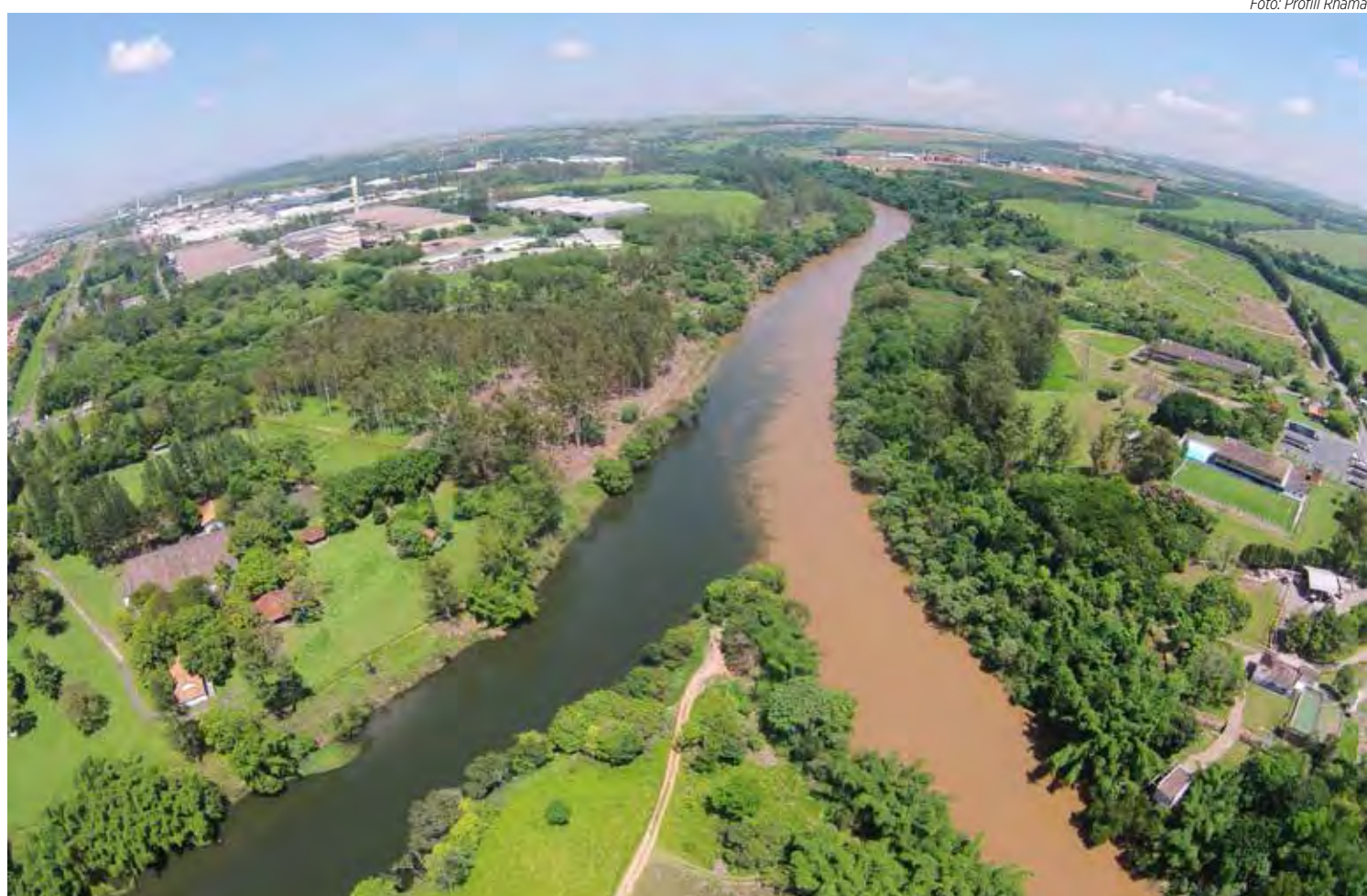
Junção dos Rios Atibaia e Jaguari - formação do Rio Piracicaba

Na Plenária dos Comitês PCJ, como o encontro é chamado, também foram aprovadas outras quatro deliberações. Uma delas estabelece prazos para as diversas fases de execução de empreendimentos indicados pelos Comitês PCJ para serem financiados com recursos FEHIDRO, Cobranças PCJ e contratos existentes.