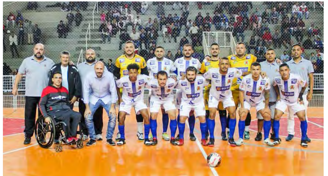
Acima, o time de Rio Claro

A grande final da Taça EPTV de Futsal Região Central está marcada para o dia 18 de junho, no Ginásio do SESI, em Rio Claro, que proporciona ótimas acomodações ao público esportista e a prática em nível de excelência aos craques da bola pesada.