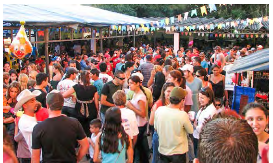
Quermesse de Santo Antonio em 2019

“Vamos tocar e cantar músicas muito conhecidas, como