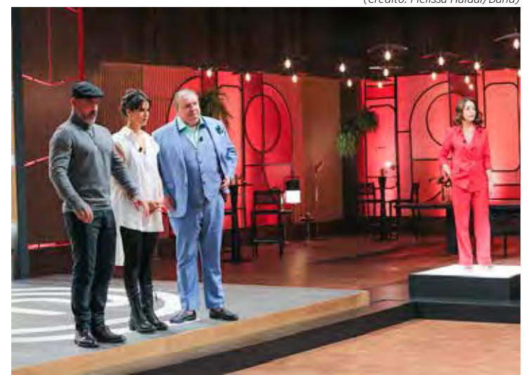
MasterChef passou a ser gravado nos estúdios Vera Cruz

Informa-se, inclusive, que com o calendário aberto, já existem quatro projetos fechados, que ainda não podem ser divulgados por questões contratuais de confidencialidade, nas áreas de streaming e cinema.