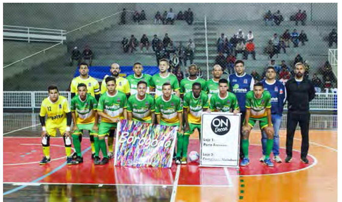
Time de Porto Ferreira, adversário de Rio Claro na semifinal