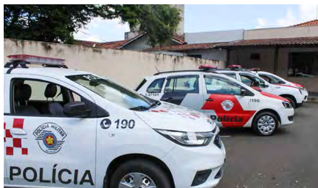
De janeiro a maio deste ano a Polícia Militar registrou a prisão de 47 mil pessoas no estado

O trabalho resultou na recuperação de 16,6 mil veículos recuperados em todo o estado.