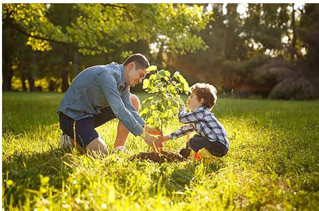
Ensine os seus filhos a importância do cuidado com o Meio Ambiente.

Nessa data onde o mundo está superando o pior da pandemia da Covid 19, o tema vai conscientizar o enfrentamento a tripla crise planetária de mudanças climáticas, perda da natureza e poluição. As