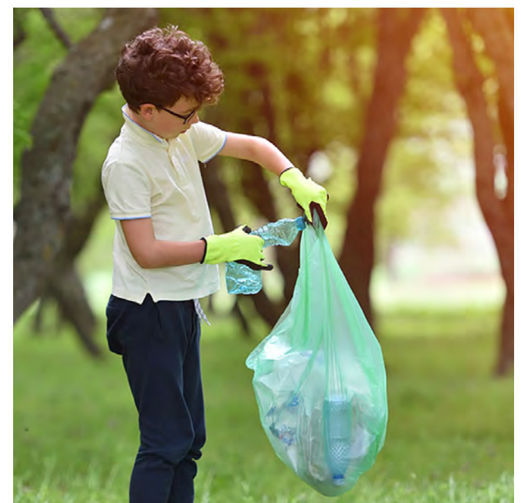
Criação de hábitos que contribuam para um ambiente em equilíbrio.

Os problemas ambientais vêm tendo um acentuado crescimento e alguns pontos fundamentais devem ser reavaliados pelos governantes e população. Sem ações