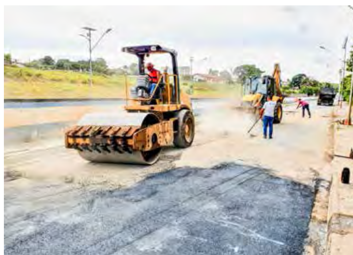
A "Tancredo" é uma das vias mais movimentadas do município e outros trechos da avenida já haviam recebido serviços de reparo

A prioridade é para os trechos onde a situação é mais urgente, mas todas as regiões estão sendo atendidas