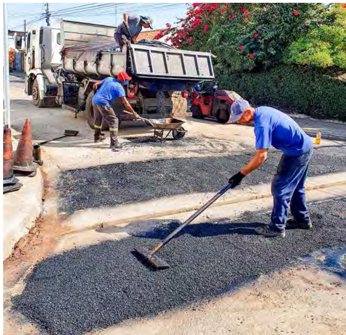
Problemas no local eram apontados pela população. Com a canaleta, devem ser sanados

A prefeitura tem realizado vários trabalhos nos bairros e distritos para recuperar a pavimentação asfáltica.