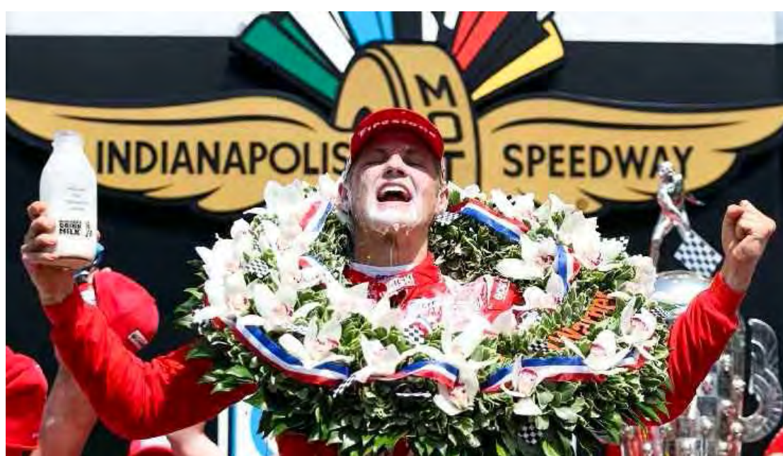
Marcus Ericsson fatura a 106ª edição da Indy 500

seu pit stop final, a 23 voltas do final. A penalidade derrubou Dixon de primeiro para o final do pelotão, acabando com qualquer esperança de vencer.