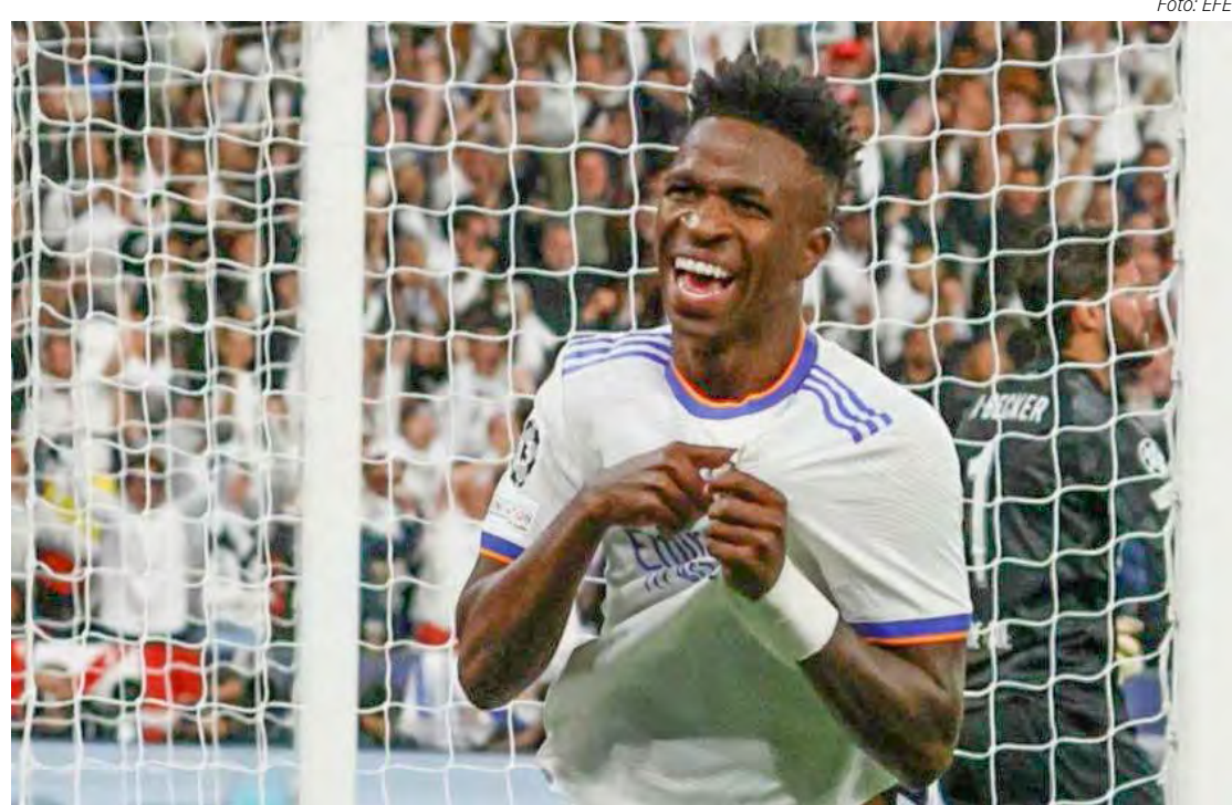
Vini Jr. fez o gol do título.

A conquista da 14ª. "orelhuda" como é conhecida a taça de campeão da Champions League garante também, a presença do Real Madrid na próxima edição do Mundial de Clubes da FIFA.