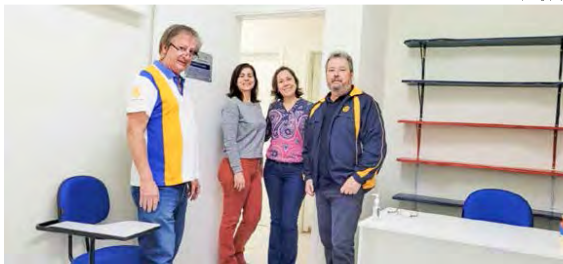
Uma nova sala foi criada na sede do GACC e deve atender em torno de 150 pessoas entre pacientes e suas famílias

As famílias também serão favorecidas com aulas individuais de reforço escolar para os irmãos, aumentando o espectro de atendimento. Direta e indiretamente serão beneficiadas em torno de 150 pessoas.