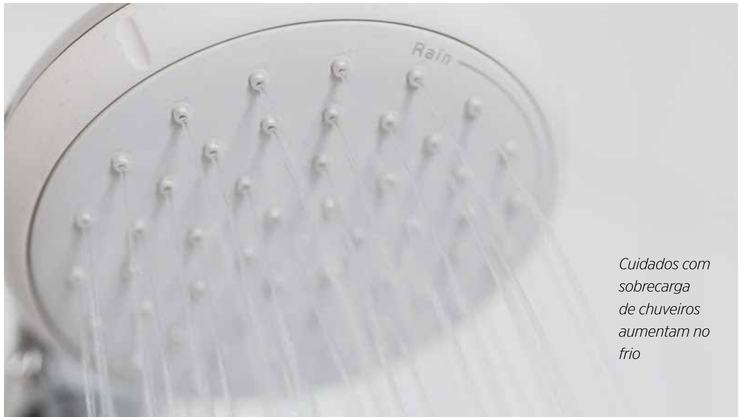
Cuidados com sobrecarga de chuveiros aumentam no frio