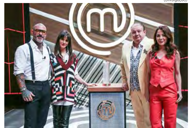
Elenco do “MasterChef”

A direção da Band entende que o programa, além da sua capacidade de atrair um público certo, segue como uma das mais atrativas ofertas do seu departamento comercial.