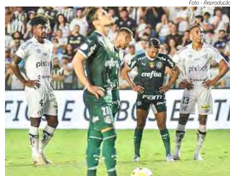
Veiga perdeu pênalti contra o Santos

O camisa 32 jamais havia perdido uma penalidade máxima pelo alviverde. E o fato aconteceu no segundo tempo, ao chutar na trave, o pênalti sofrido