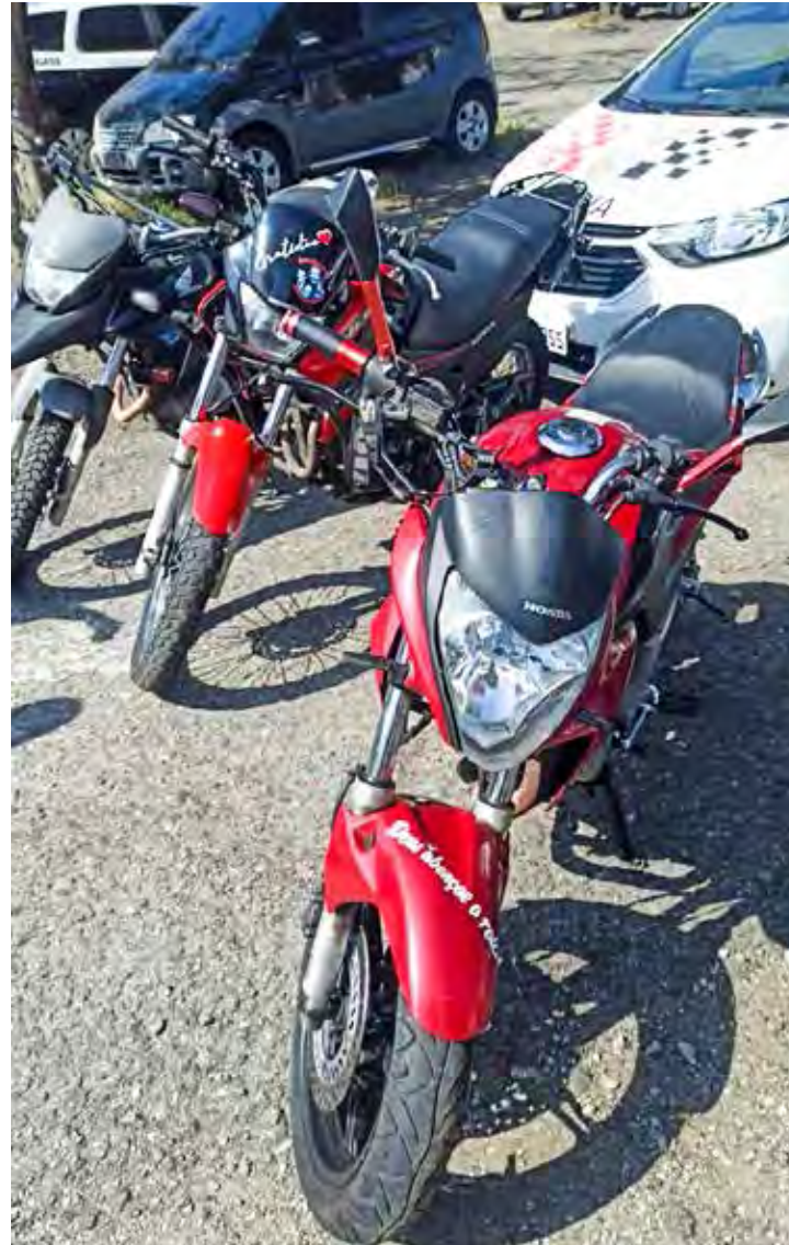
A Operação Sufoco já deteve mais de 2,2 mil pessoas e vistoriou cerca de 133,7 mil veículos

grupo especializado em furtos de comércios. As prisões ocorreram no centro da cidade.