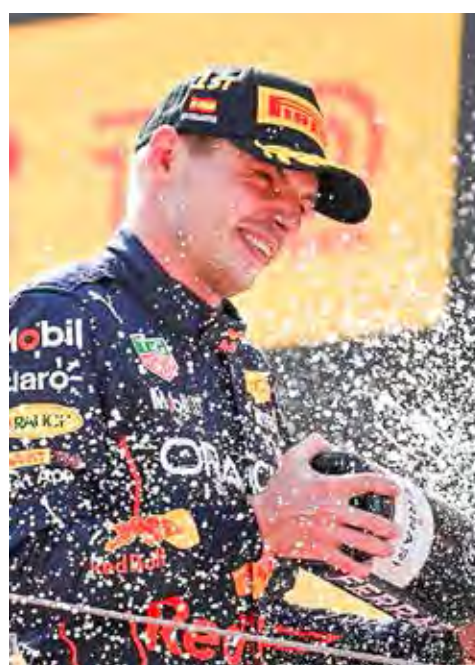
Max Verstappen, da Red Bull, cruzou a linha de chegada do GP da Espanha na primeira posição

Mais cedo houve uma mudança no grid de largada. A Alpine optou por trocar a unidade de potência de Alonso, estourando a alocação permitida do ano e forçando o espanhol a sair de último. A Fórmula 1 volta à ação já na próxima semana com mais uma edição do GP de Mônaco, a sétima etapa da temporada 2022.