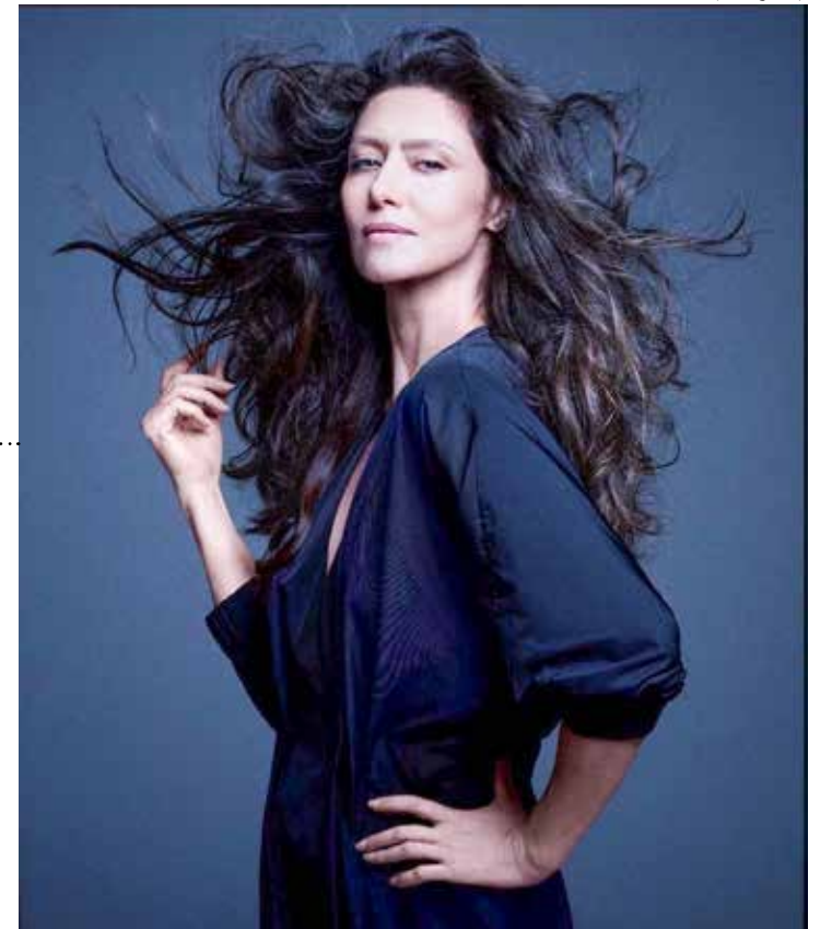
Maria Fernanda Cândido integra o elenco de "El Presidente"