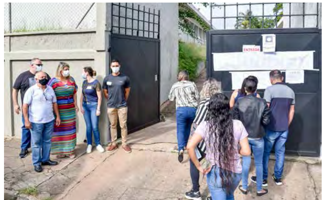
Provas objetivas do concurso público foram realizadas em fevereiro

Os 35 agentes já foram convocados pela Fundação Municipal de Saúde e estão em fase de posse, que é a apresentação dos documentos. A expectativa é de que até o final da próxima semana todos estejam empossados e possam iniciar o desenvolvimento das funções. Além dos agentes comunitários, outros profissionais estão sendo contratados para integrar as equipes de saúde da família, de maneira que elas estejam completas.