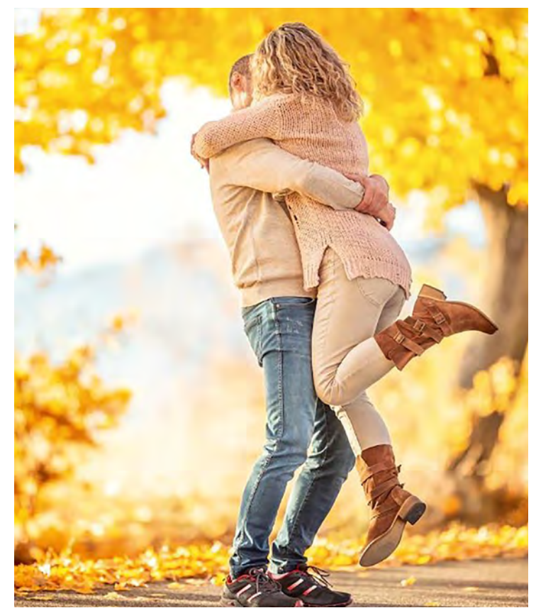
Outono é tempo de calor humano, mais abraços.

A humanidade está passando por grande turbulência, pandemia, guerras e podemos