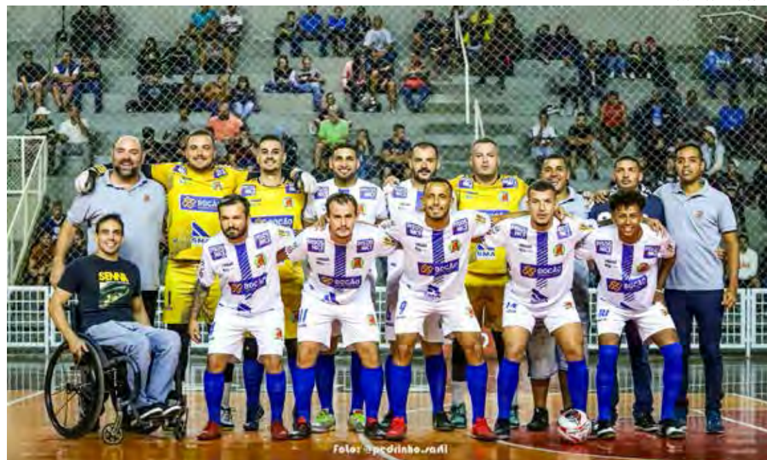
Time de Rio Claro está invicto na Taça EPTV de Futsal