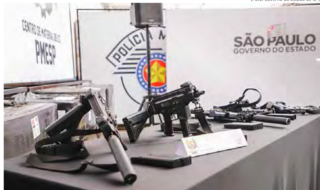
O investimento foi de R$ 7,84 milhões para a aquisição do armamento, que será utilizado como reforço nas viaturas de patrulhamento ostensivo e preventivo

Fabricadas na unidade norte-americana da empresa, as submetralhadoras têm calibre .40 S&W e possuem capacidade de 22 tiros em cada carregador. Para aumentar a capacidade combativa da tropa, os carregadores das pistolas Glock G22, usadas pelos policiais militares, são compatíveis com o novo armamento. “Estamos adquirindo ferra-