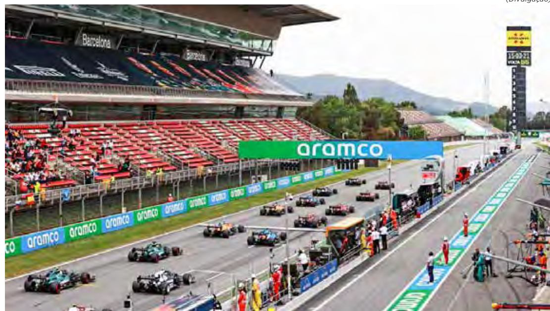
Sexta etapa da Temporada 2022 da Fórmula 1 acontece nesse final de semana