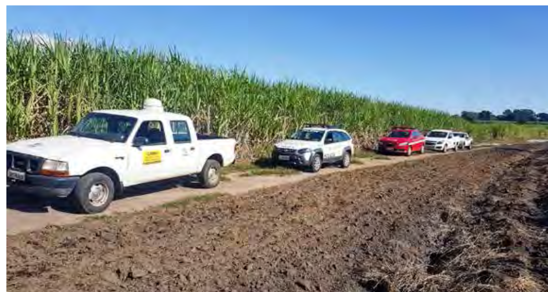
Ação foi realizada em todo o estado e contou com 450 policiais militares além de equipes do Gaema

Participaram das atividades 450 policiais militares, além dos integrantes do Gaema, com foco em coibir focos de incêndio e minimizar o impacto desses incidentes na saúde da população