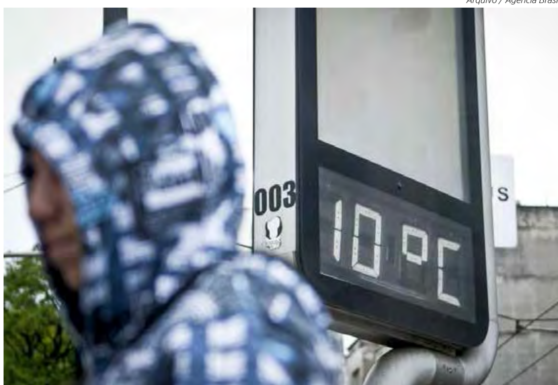
Os dias seguem gelados com temperaturas abaixo de 10°C

Segundo os dados históricos registrados pela Estação Ceapla, a temperatura mais baixa para o mês de maio foi registrada em 1999 quando os termômetros marcaram 3,0 °C, em 2000 foi de 3,2°. Já em 2020 a mínima foi de 3,1° no mesmo período; em 2021 a mínima no mês de maio foi de 6,5° e 2022 o registro foi de 6,9 graus.