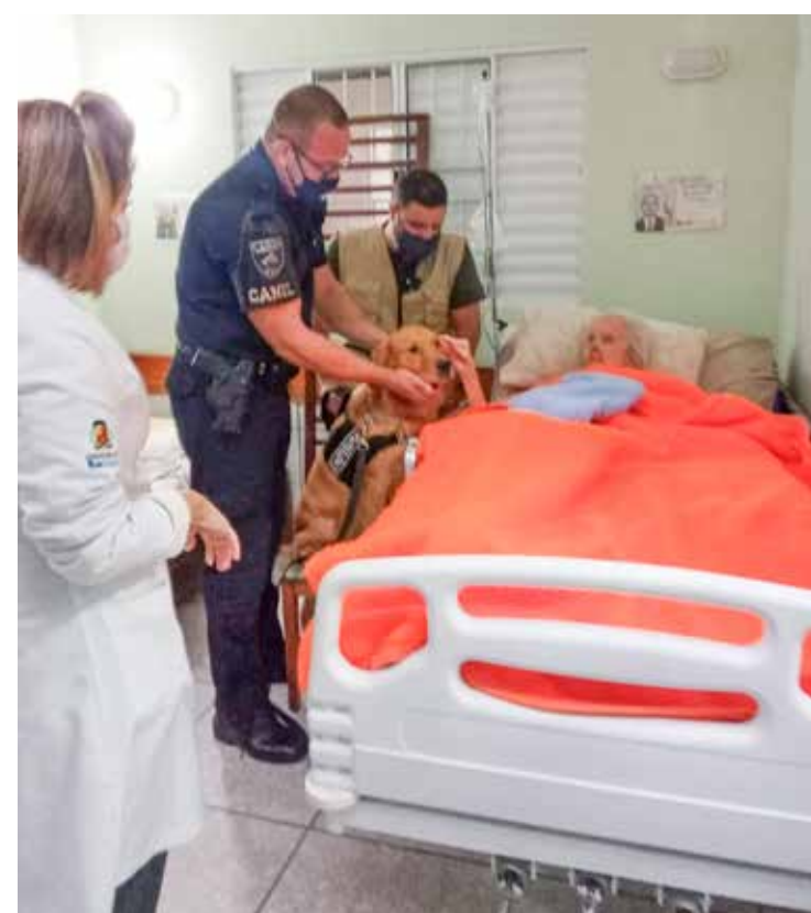
A Cinoterapia é basicamente um tratamento através do convívio com cães; 50 idosos do Lar Bethel receberam a visita