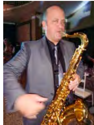
Derico que nutriu a noite com som de primeira, acompanhado pela Orquestra