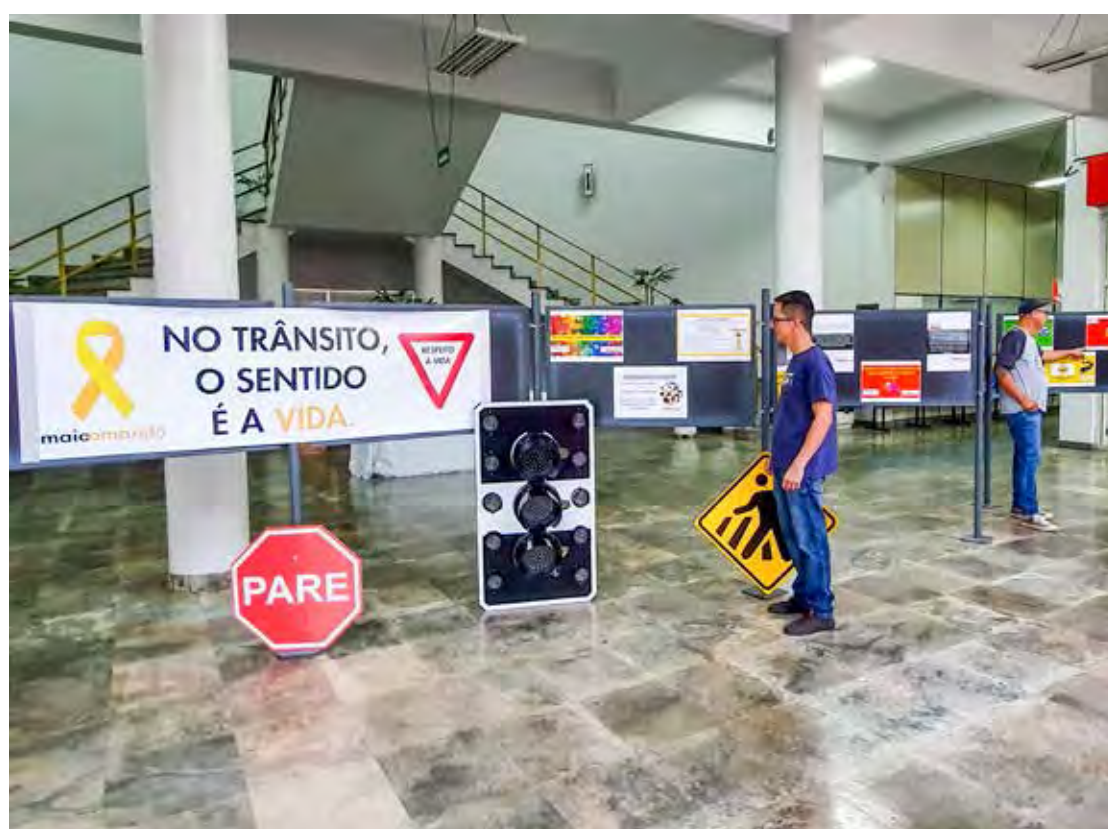
Exposição no Paço Municipal segue no local até o fim do mês

tarias municipais de Mobilidade Urbana e Sistema Viário e de Segurança e Defesa Civil, junto com o Sest/Senat e parceria com a concessionária Sport Motor, e apoio da empresa Owens Cor-