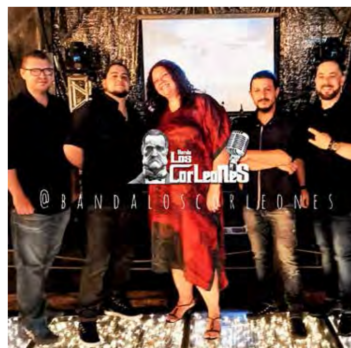
A banda Los Corleones é uma das atrações do evento

"Os motoclubes são tradicionais em Rio Claro e nada mais natural que o município realize atividade reunindo motoclubes de toda a região", comenta o secretário municipal de Turismo,