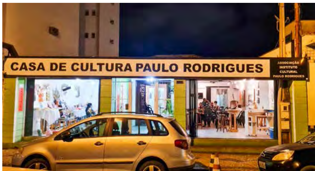
A Casa de Cultura está localizada à Rua 4 n. 583, entre avenidas 11 e 13, no Centro. A entrada é franca. A visitação pode ser feita de segunda a sexta-feira, das 10h às 17h, e aos sábados das 9h às 13h.

Adormecido por décadas, o CREC está se estruturando novamente e também fará parte das atividades da Casa de Cultura que abrigará o seu acervo de obras raras e sediará os encontros, reuniões e promoções do