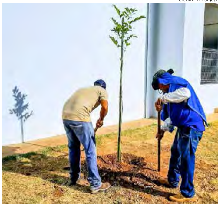
Escola recebeu o plantio duas espécies exóticas e oito nativas