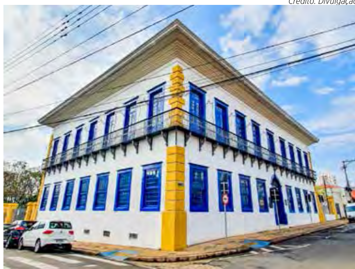
Fotos selecionadas vão ser expostas no Museu Amador Bueno da Veiga