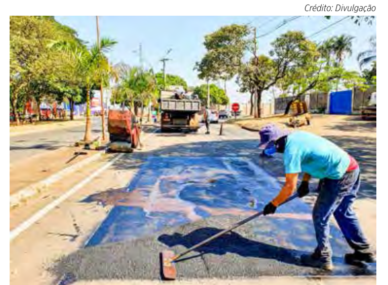
Serviço de tapa-buraco na Avenida Castelo Branco

A prefeitura tem aproveitado o tempo com menos chuvas para intensificar esse trabalho. A colaboração da comunidade, fazendo o descarte correto de materiais, é essencial.