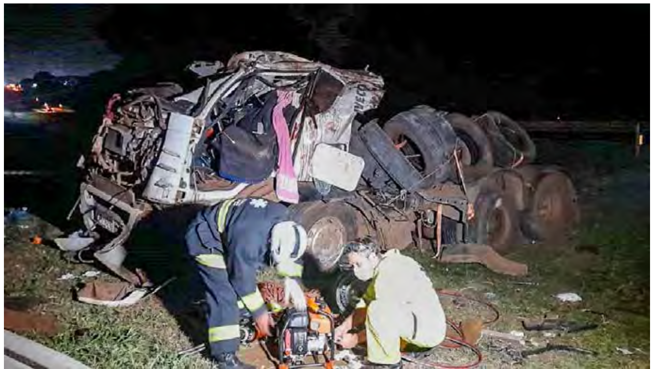
Um dos acidentes recentes registrados na rodovia Washington Luís o condutor ficou preso às ferragens e morreu na hora

estiveram no local e constataram que havia ocorrido o atropelamento de um homem. De acordo com o registro, o condutor de um veículo Sander, com placas de Piracicaba, seguia sentido Araras e não conseguiu desviar. A vítima usava camiseta e bermuda azul, chinelo. Não foi possível sua identificação, sendo o corpo encaminhado ao IML de Rio Claro e seguiu como desconhecido até o fechamento desta edição.