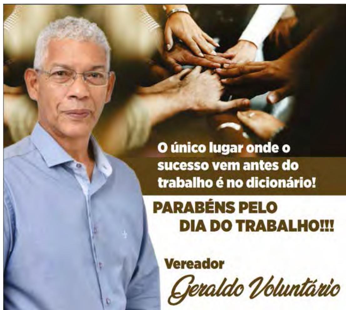
Lago Azul terá festa para celebrar o Dia do Trabalhador