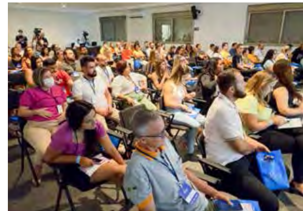
Faça sua Sorte foi o título apropriado para estimular o crescimento profissional