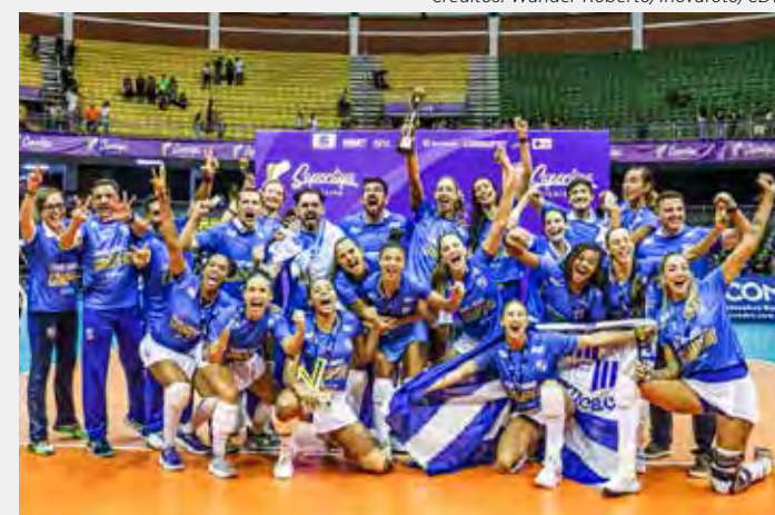
Itambé/Minas comemora o título da competição