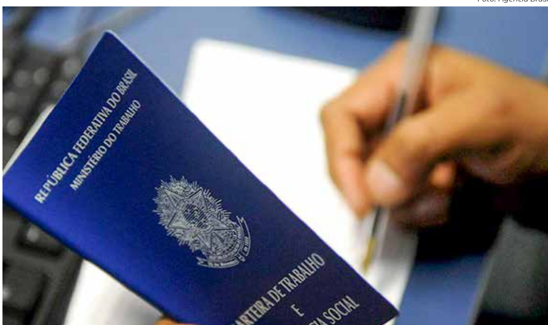
Quatro milhões de trabalhadoras domésticas não possuem carteira assinada, contra 1,2 milhão que possuem