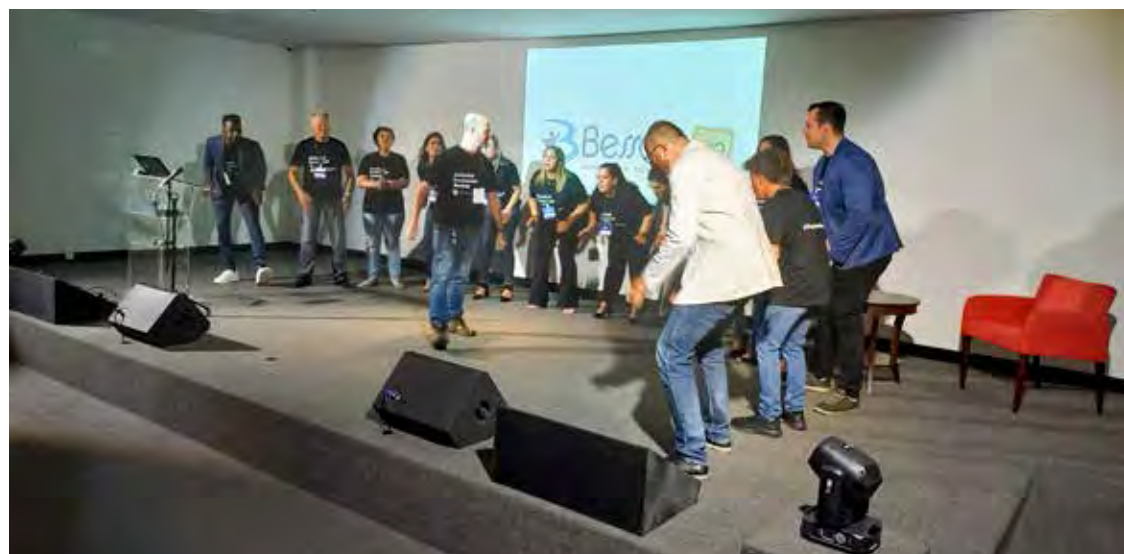
A equipe da empresa Bessani esbanjando entusiasmo e paixão pelo evento