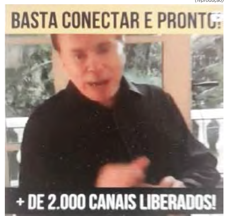
Imagem de Silvio Santos usada sem autorização em “anúncio”

O programa musical da Lívia Andrade, novidade da Band nas noites de sábado, teve os seus