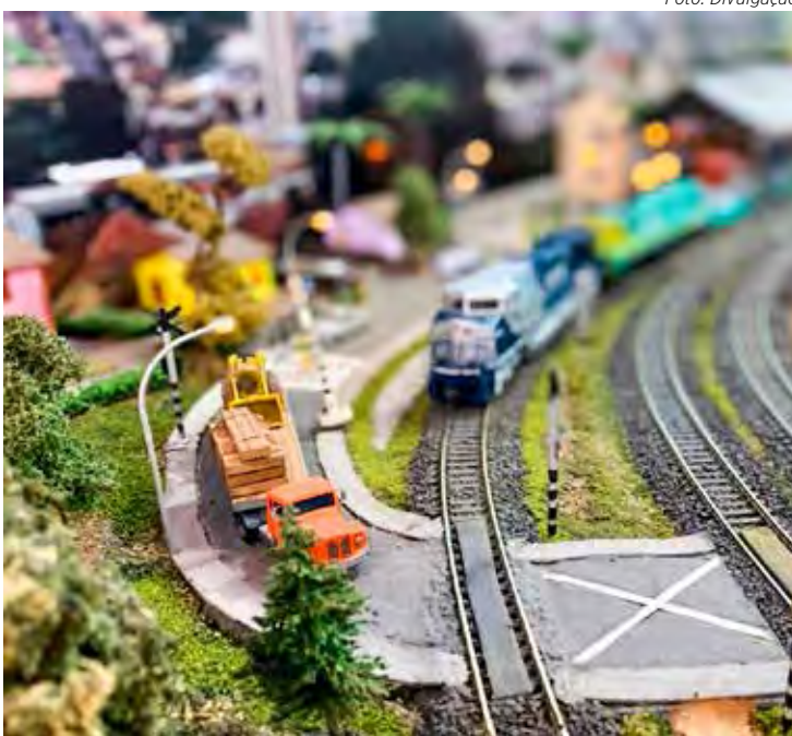
Na festa do Dia do Ferroviário haverá exposição e venda de ferromodelismo