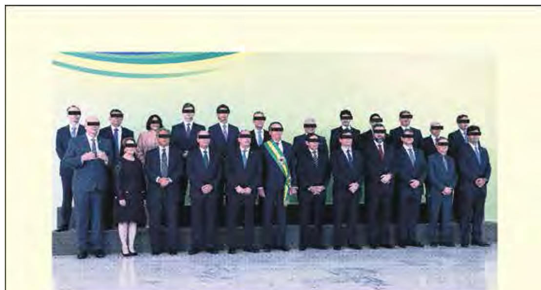
FOTO DO PRESIDENTE ELEITO PARA GOVERNAR ATÉ 2022 COM SEUS MINISTROS, PUBLICADA EM REDES SOCIAIS EM 01/01/2019.

E AINDA TEM GENTE QUE DIZ QUE O BRASIL NÃO PRECISA DE COTAS RACIAIS.