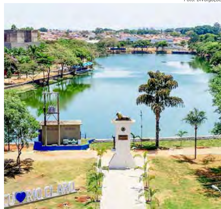
Vista do Lago Azul que será palco de festa no domingo para celebrar o Dia do Trabalhador