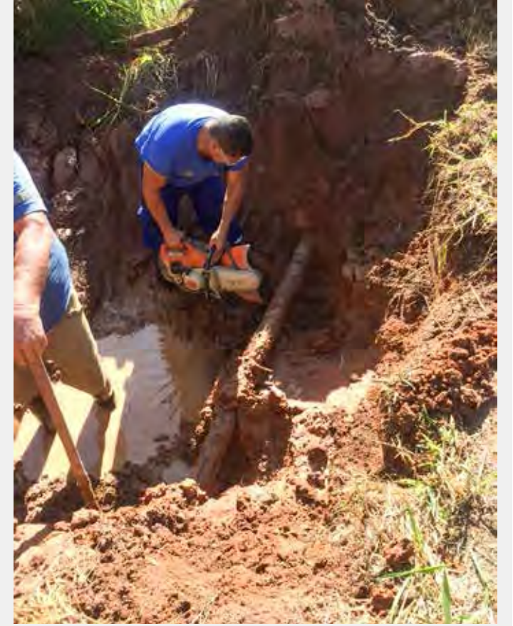
Equipe do Daae fez conserto na tubulação em trecho da estrada Rio Claro-Ajapi