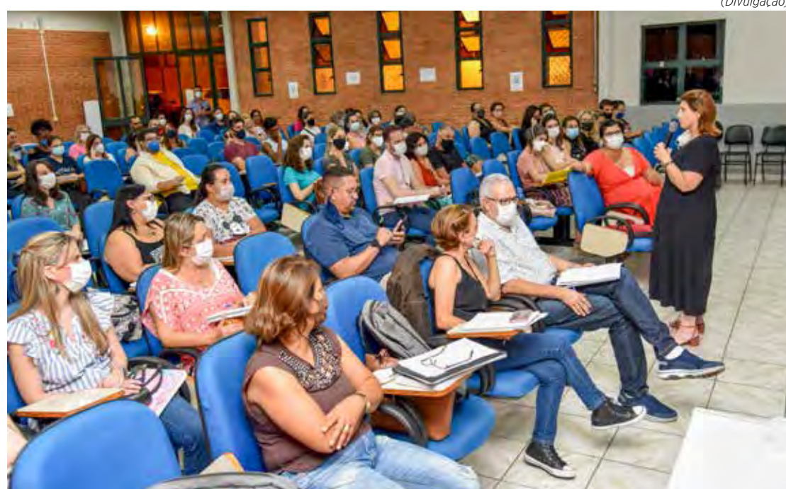
Educadores iniciam trabalhos para elaboração do currículo da educação básica

A Proposta Pedagógica abrange as concepções que irão nortear e fundamentar as práticas educativas. Após a discussão e sistematização de todas as pautas, o texto preliminar da Proposta Pedagógica será encaminhado às escolas, para que os professores e gestores possam propor emendas.