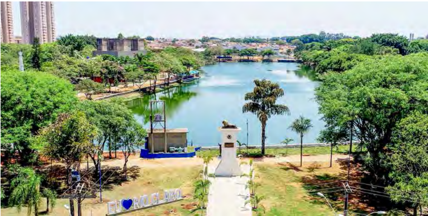
Vista do Lago Azul que será palco de festa no domingo para celebrar o Dia do Trabalhador