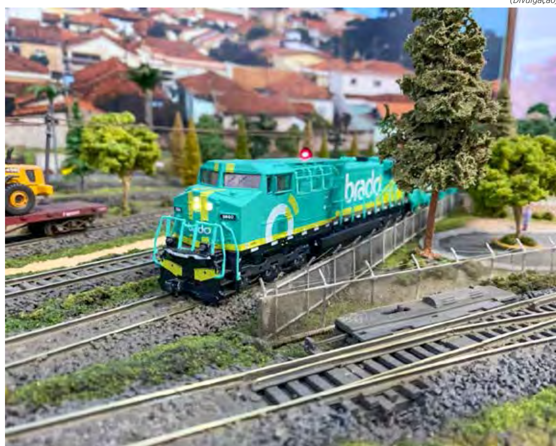
Na festa do Dia do Ferroviário haverá exposição e venda de ferromodelismo

O evento é organizado pela Secretaria Municipal de Turismo em parceria com a Rumo, CPTM, Dnit e Instituto Memória Ferroviária.