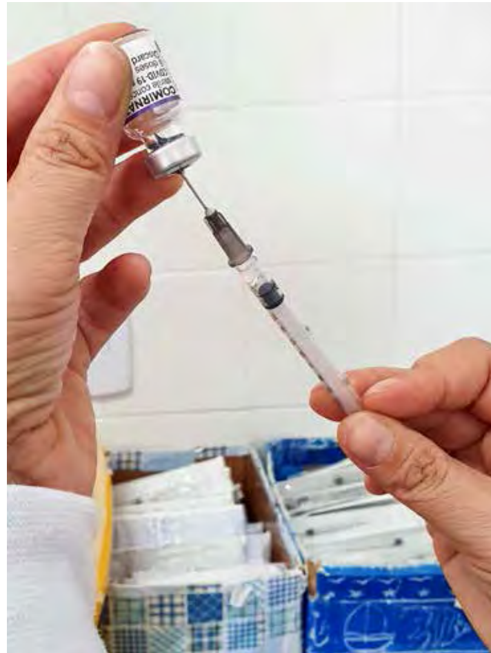
Campanha disponibiliza todas as doses da vacina contra a Covid-19

Covid-19 estão sendo aplicadas primeiras, segundas doses e doses de reforço (terceira e quarta doses). As primeiras doses são para quem tem cinco anos ou mais. Para a segunda dose, é necessário observar a data de retorno, marcada a lápis no car-