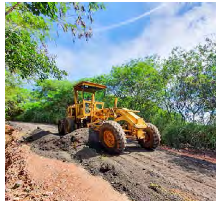
O trabalho consiste na colocação de raspas de asfalto sobre a estrada

A realização da melhoria atende pedidos dos moradores e também foi encaminhada pelo vereador Moisés Marques. "Com as raspas de asfalto, a estrada vai permanecer por mais tempo com boa trafegabilidade, oferecendo mais segurança aos seus usuários", observa o prefeito Gustavo.