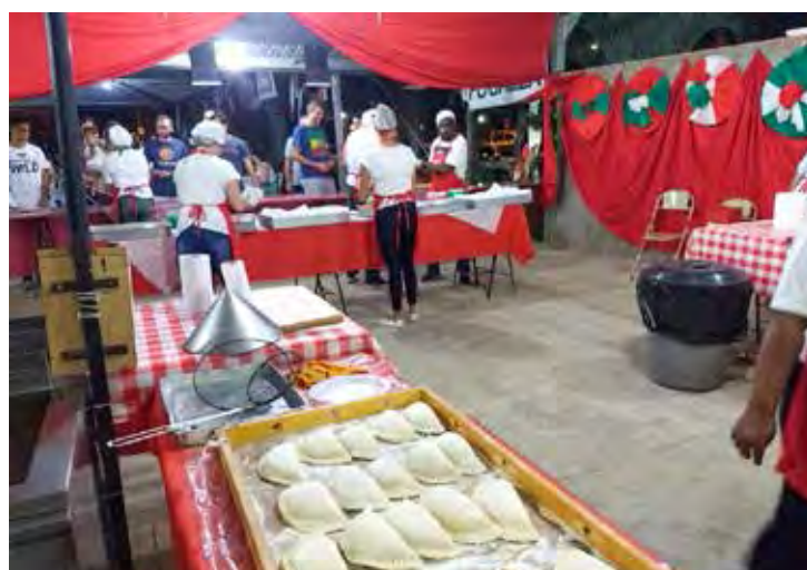
Evento reúne média de duas mil pessoas por noite e volta a acontecer com presença de público

A sua implantação contou com a orientação e apoio dos amigos da Paróquia Nossa Senhora Achiropita de São Paulo, cuja festa já é tradição na capital paulista. Além das obras sociais, a festa também tem como objetivo compartilhar o carisma de São Luís Orione e a vivência comunitária no serviço à caridade de seus voluntários em prol dos mais necessitados. São Luís Orione foi um sacerdote católico italiano que nasceu no dia 23 de junho de 1872 e morreu em 12 de março de 1940. O papa Pio XII o