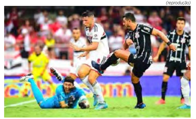
Lance de São Paulo e Corinthians do último domingo

Investimentos que sempre têm um retorno certo.