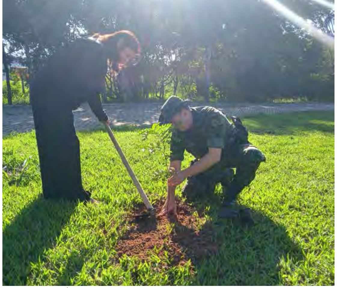
Operação #DiaDaÁgua conta com o emprego de mais de 1200 policiais militares e 450 viaturas, entre terrestres, náuticas e aéreas (drones)

Para marcar o Dia Mundial da Água a Polícia Militar Ambiental, realiza em todo o Estado, Operação #DiaDaÁgua, com o emprego de mais de 1200 policiais militares e 450 viaturas, entre terrestres, náuticas e aéreas (drones), que realizarão o policiamento ostensivo marítimo e terrestre com vistas aos infratores do Meio