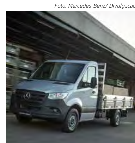
Sprinter Street Truck