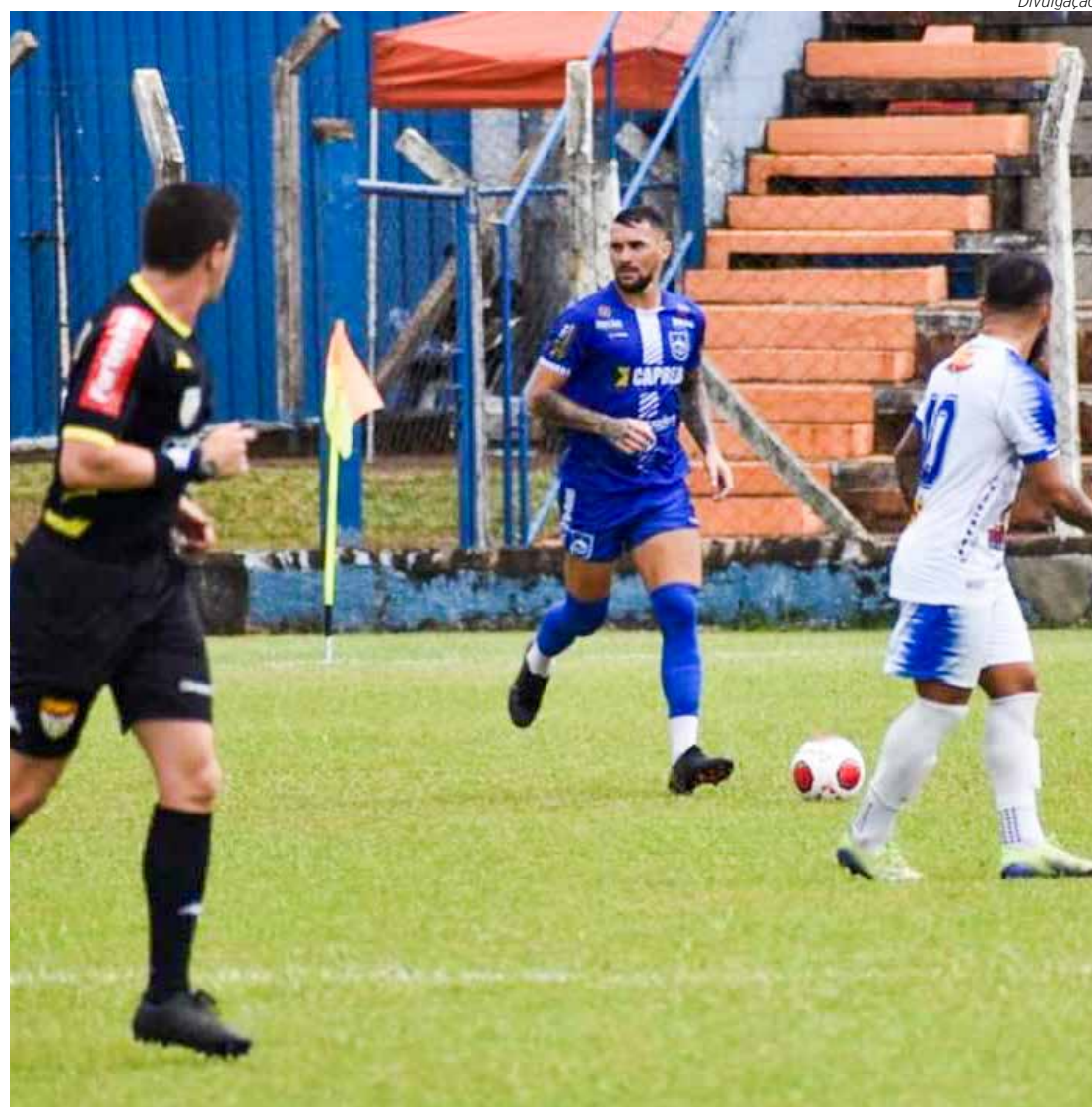
Lances do jogo Monte Azul 2 x 1 Rio Claro FC