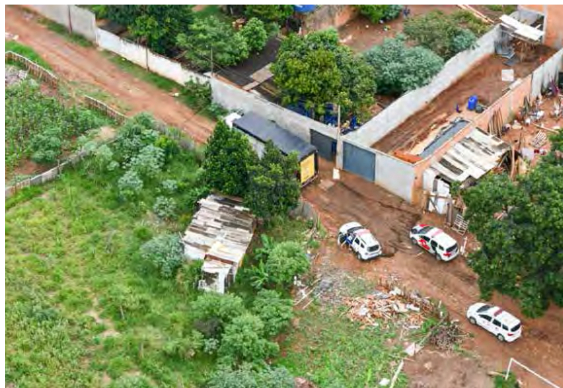
Veículo e carga foram recuperados. Três criminosos foram presos

Às 11 horas o sinal de satélite retornou, indicando que o bem estaria no bairro Santa Rosa, razão pela qual as equipes policiais de solo deslocaram-se ao endereço, bem como o Águia 20 e, de pronto, foram vistos