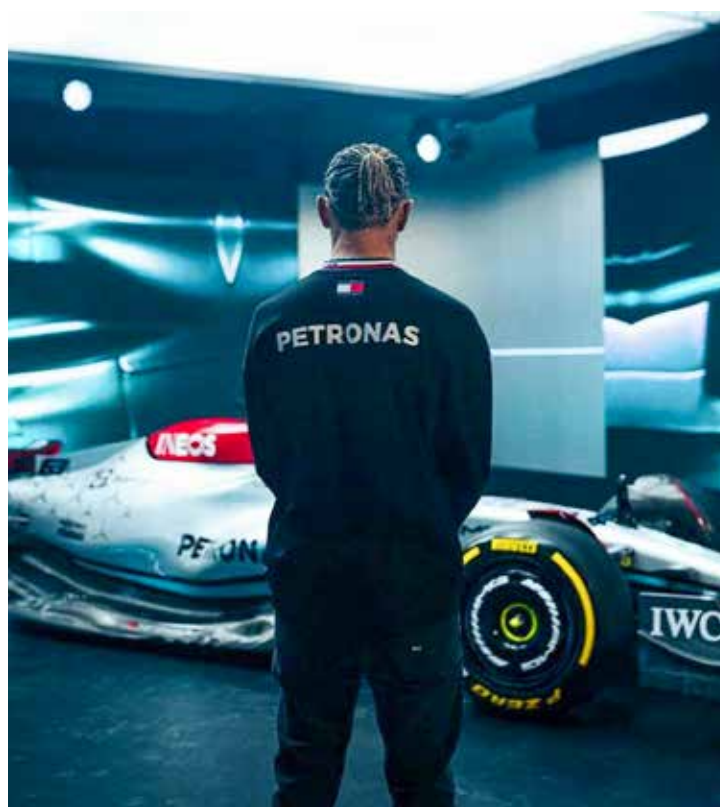
Hamilton não vê Mercedes lutando por vitória na estreia da F1

Com o fabricante alemão de carros ainda não tendo encontrado uma resposta, com poucos dias para a corrida de abertura da temporada, Hamilton está pessimista sobre as perspectivas imediatas da equipe.