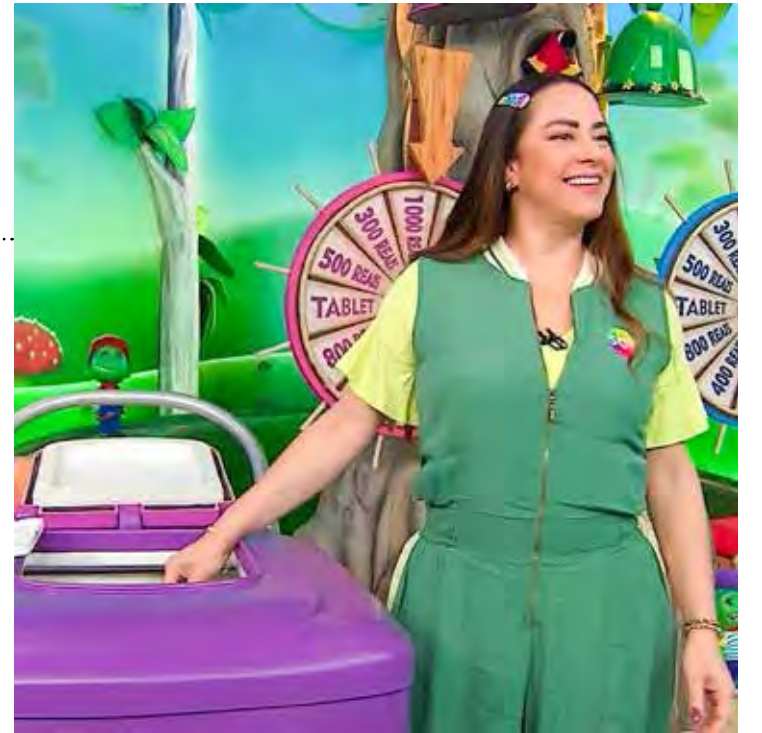
Silvia Abravanel comanda o "Bom Dia & Cia" no SBT