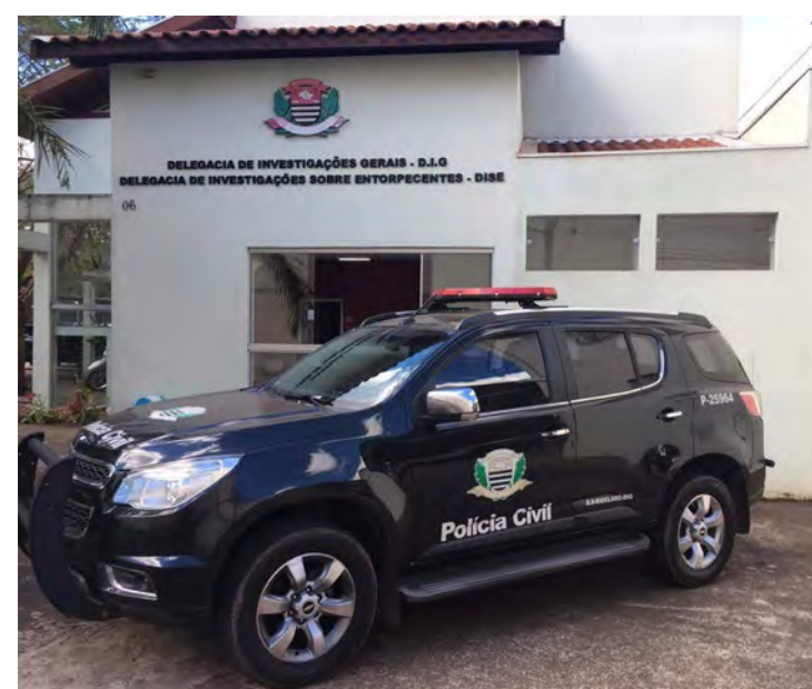
Investigações demonstraram a participação dos mesmos indivíduos em dois homicídios

Diante da semelhança na execução dos crimes, as equipes da DIG averiguaram a relação das vítimas fatais e constataram que havia uma grande