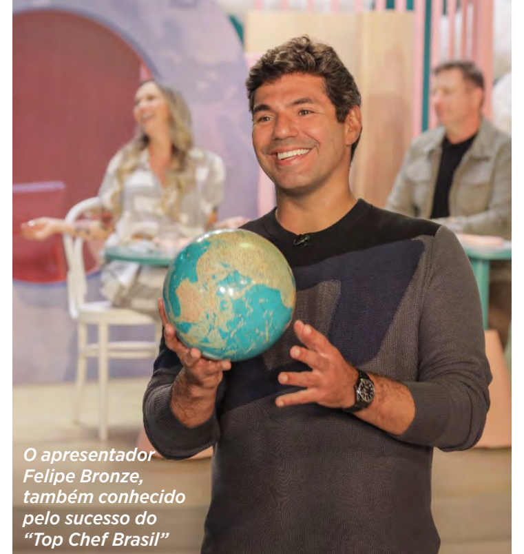
O apresentador Felipe Bronze, também conhecido pelo sucesso do "Top Chef Brasil"