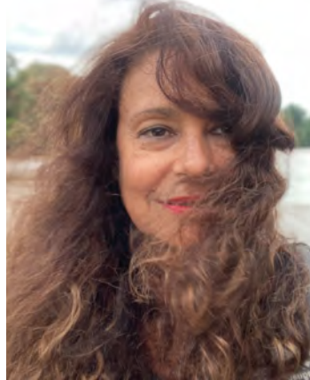
Giovanna Gold no Pantanal

A série "As Seguidoras" estreia no dia 6 de março no Paramount Plus. Trata-se de uma produção que contará a história de uma influenciadora digital que se torna serial killer depois de sua obsessão por novos seguidores. Maria Bopp lidera o elenco.