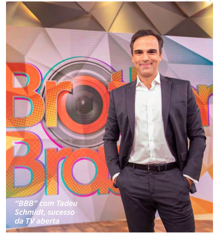
“BBB” com Tadeu Schmidt, sucesso da TV aberta

O espetáculo está em cartaz no Teatro J Safra, em São Paulo.