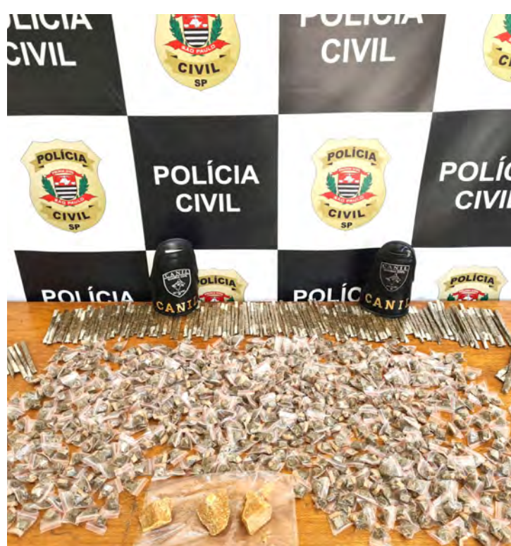
As equipes apreenderam milhares de porções fracionadas de maconha, bem como três pedras brutas de crack. Todo material estava escondido em uma caixa d'água

Investigadores entraram então no recinto da caixa d'água do local e em uma sacola escondida no local encontraram milhares de porções fracionadas de maconha, bem como, três pedras brutas de crack.