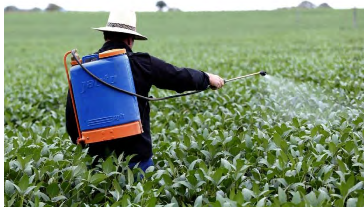
Utilização de Pesticidas na Agricultura. Imagem do Portal Analytics Brasil

Associamos os tipos de agrotóxicos de acordo com a natureza da praga que será combatida ao seu grupo químico pertencente e aos danos relacionados a saúde humana e ao meio ambiente. Como exemplo os Inseticidas que combatem insetos: Aldrin, Carbofuram e Deltametrino; Fungicidas, combatem fungos –