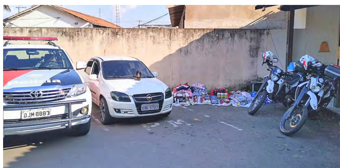
Durante a revista veicular os policiais localizaram diversas mercadorias avaliadas em aproximadamente R$ 13 mil, um par de algemas, um coldre e um estojo deflagrado de munição

Diante das informações, a equipe intensificou o patrulhamento, conseguindo localizar e abordar os criminosos no inte-