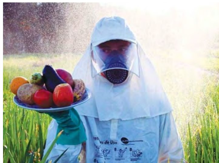
Evite alimentos com altos índices de agrotóxicos. Imagem do Portal Engeplus

O uso de agrotóxicos no Brasil é regulado pela Lei de Agrotóxicos nº78022 de 1989 com restrições a quem utiliza, em 2018 foi revogada pela Câmara dos Deputados flexibilizando as regras de produção, comercialização e distribuição de