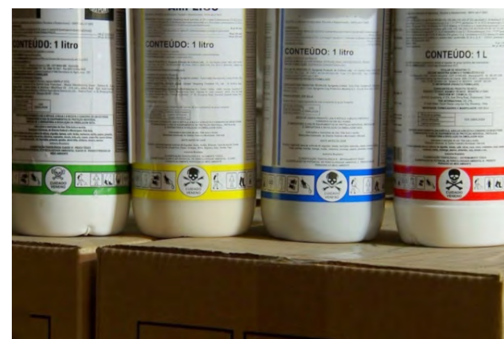
Grau de toxicidade dos agrotóxicos por cores.

agrotóxicos. Também em 2019 o Ministério da Agricultura aprovou o registro de agrotóxicos de alta toxicidade, sendo que no Brasil são usados pelo menos dez já banidos em outros países.