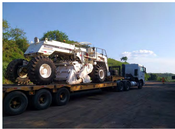
Os trabalhos da Eixo SP Concessionária de Rodovias começaram pelo segmento considerado mais crítico da rodovia