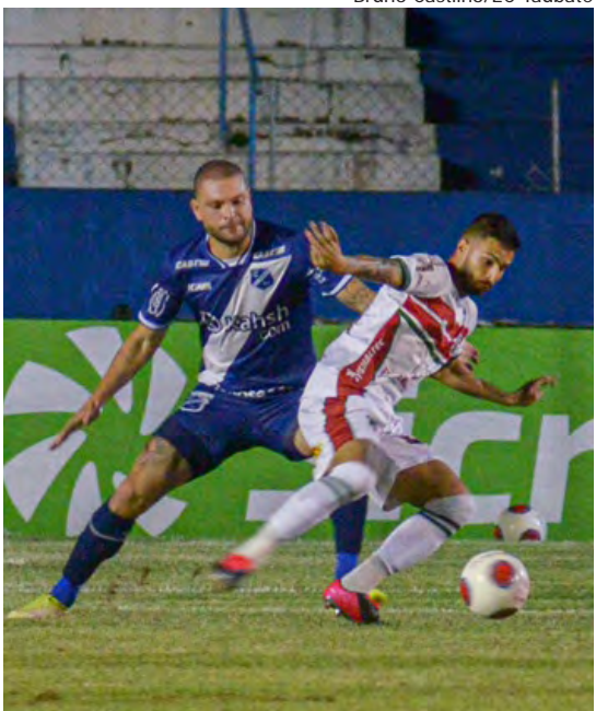
Bruno Castilho/EC Taubaté

As obras de recuperação da SP 191, entre Charqueada e São Pedro, tiveram início nesta quarta-feira (16). Os trabalhos da Eixo SP Concessionária de Rodovias começaram pelo segmento considerado mais crítico da rodovia, do quilômetro 102 ao 105. A previsão inicial é de que o serviço de recuperação do pavimento da SP-191 seja concluído em 120 dias. Página 7