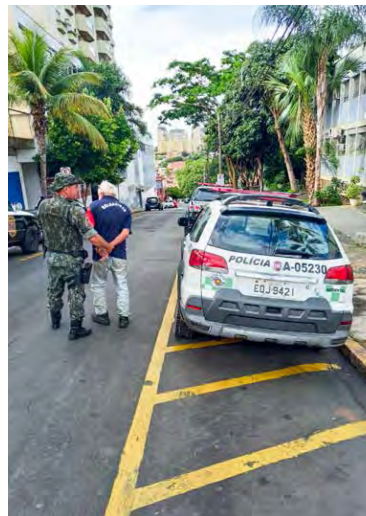
O criminoso foi preso por crime ambiental, porém durante o registro da ocorrência, a Polícia Ambiental constatou as demais passagens criminais

Durante a permanência da equipe no local, foi realizada pesquisa dos antecedentes