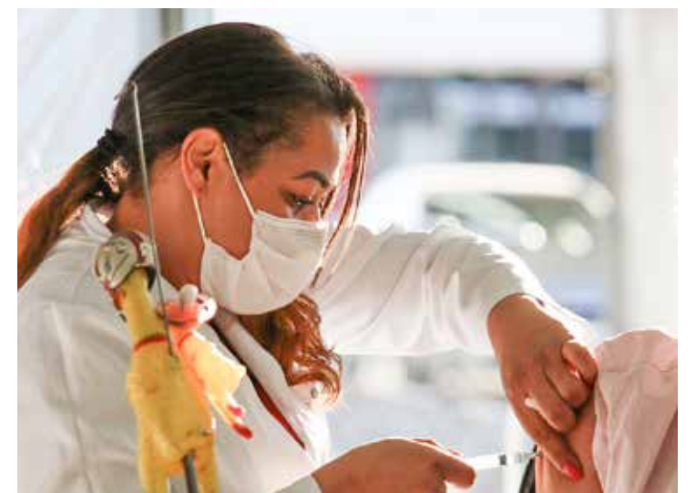
influenza na cidade e 350 com confirmação de covid-19. Mais 221 pacientes foram internados por outros vírus respiratórios e mais de 2 mil casos estão sob investigação.

Com o avanço da vacinação, os casos de covid-19 têm caído e a gripe tem se tornado mais importante nos casos de Srag. Em dezembro, foram hospitalizadas 964 pessoas com