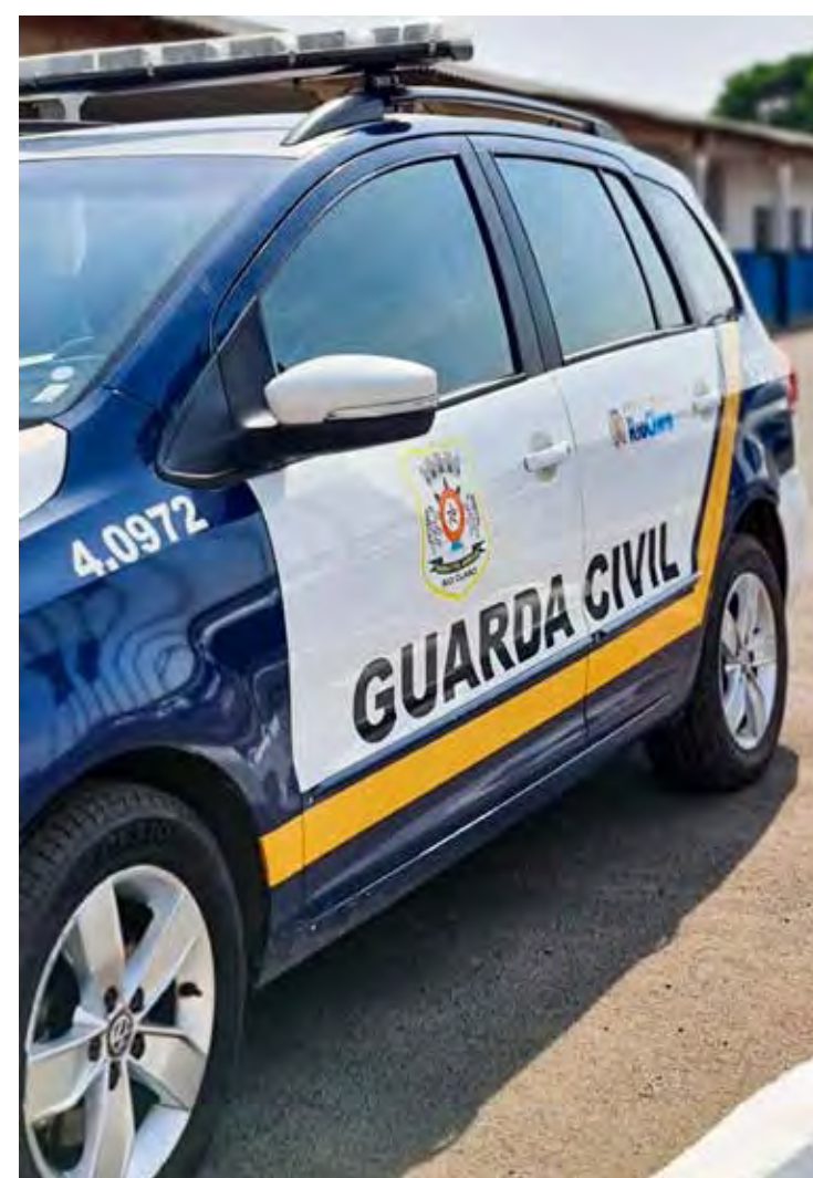
A vítima foi agredida com socos e pontapés ficando desacomodada. GCM atendeu a ocorrência

A abordagem e cadastramento de moradores em situação de rua são realizados pelo Serviço Especializado em Abordagem Social (Seas). Segundo um dos levantamentos divulgados em setembro do ano passado, a cidade contava com 106 moradores em situação de rua. De acordo com matéria publicada pelo Diário do Rio Claro em agosto de 2021, a maioria recusou acolhimento durante a Operação de Inverno, uma média de 70%, não aceita abrigo. O consumo de bebidas e outras drogas acaba causando intrigas entre eles mesmos.