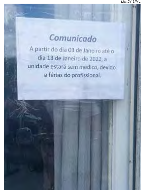
Comunicado publicado nas unidades de saúde

(4), porém, não conseguiu na USF do Jardim Progresso. Conforme relatos, a situação foi semelhante nas unidades localizadas nos bairros Bela Vista, Guanabara, Palmeiras, Brasília, Mãe Preta e o distrito de Ajapi. Página 7