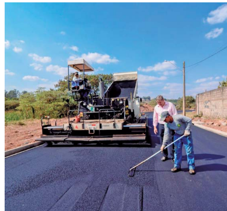
Trabalho semelhante está sendo realizado em ruas e avenidas do Grande Cervezeão