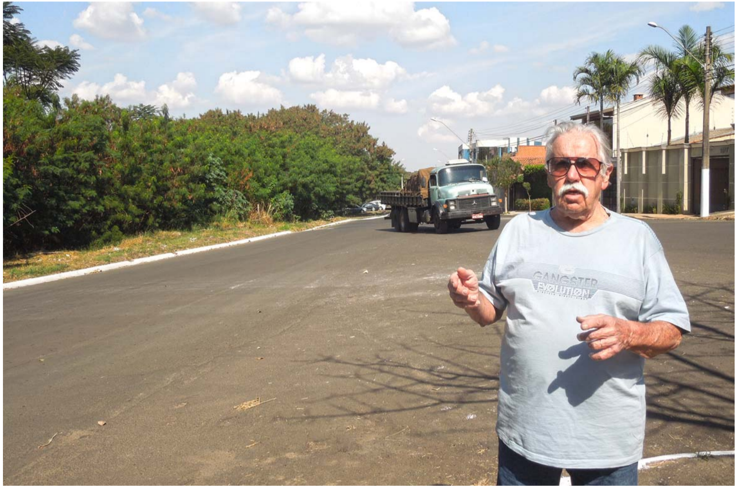
Até abaixo-assinado em anos passados foi realizado por moradores para melhorar o trânsito

Entre as demandas solicitadas estão ainda melhora na iluminação e limpeza de mato em uma área de proteção ambiental.