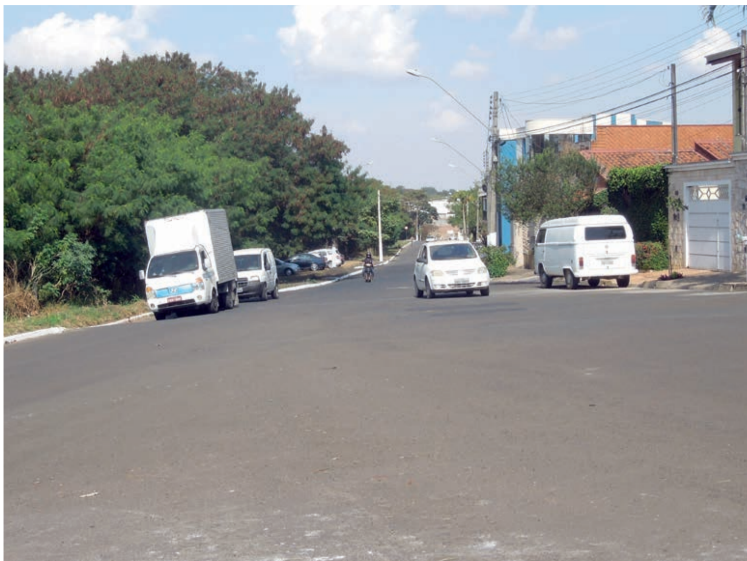
Em anos anteriores, moradores realizaram até mesmo abaixo-assinado solicitando mudanças no trânsito do local