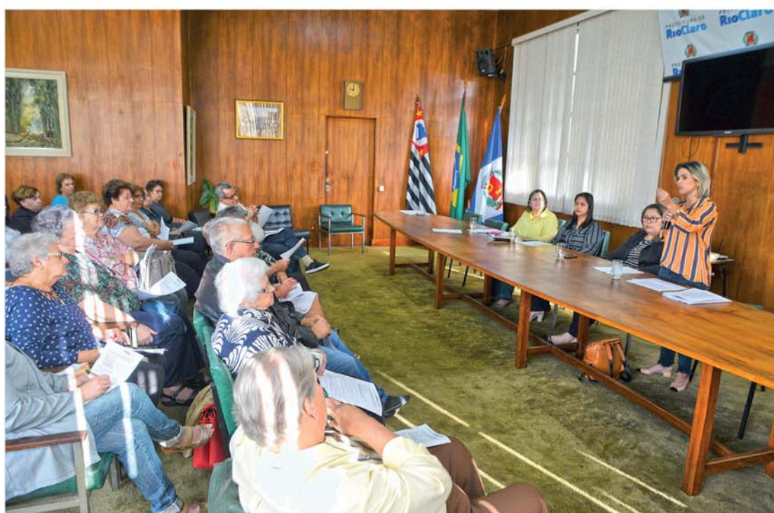
Idosos rio-clarenses terão novo serviço oferecido pelo município