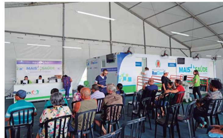
O atendimento no Espaço Mais Saúde teve início em setembro do ano passado