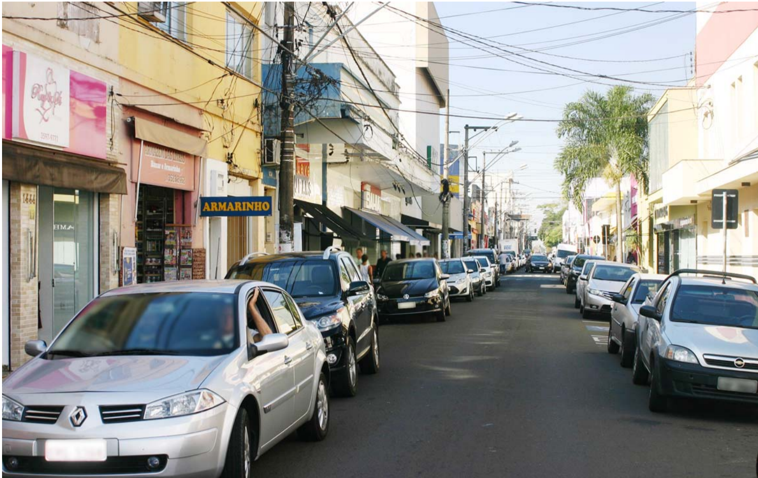
EM BAIXA: Índice de Confiança do Comércio, medido pela Fundação Getulio Vargas (FGV), recuou 0,8 ponto de junho para julho

Serasa, mostra que em média, de cada 10 brasileiros, quatro estão endividados. Desde o início da pesquisa em 2016, esse é o maior nível de endividamento registrado.