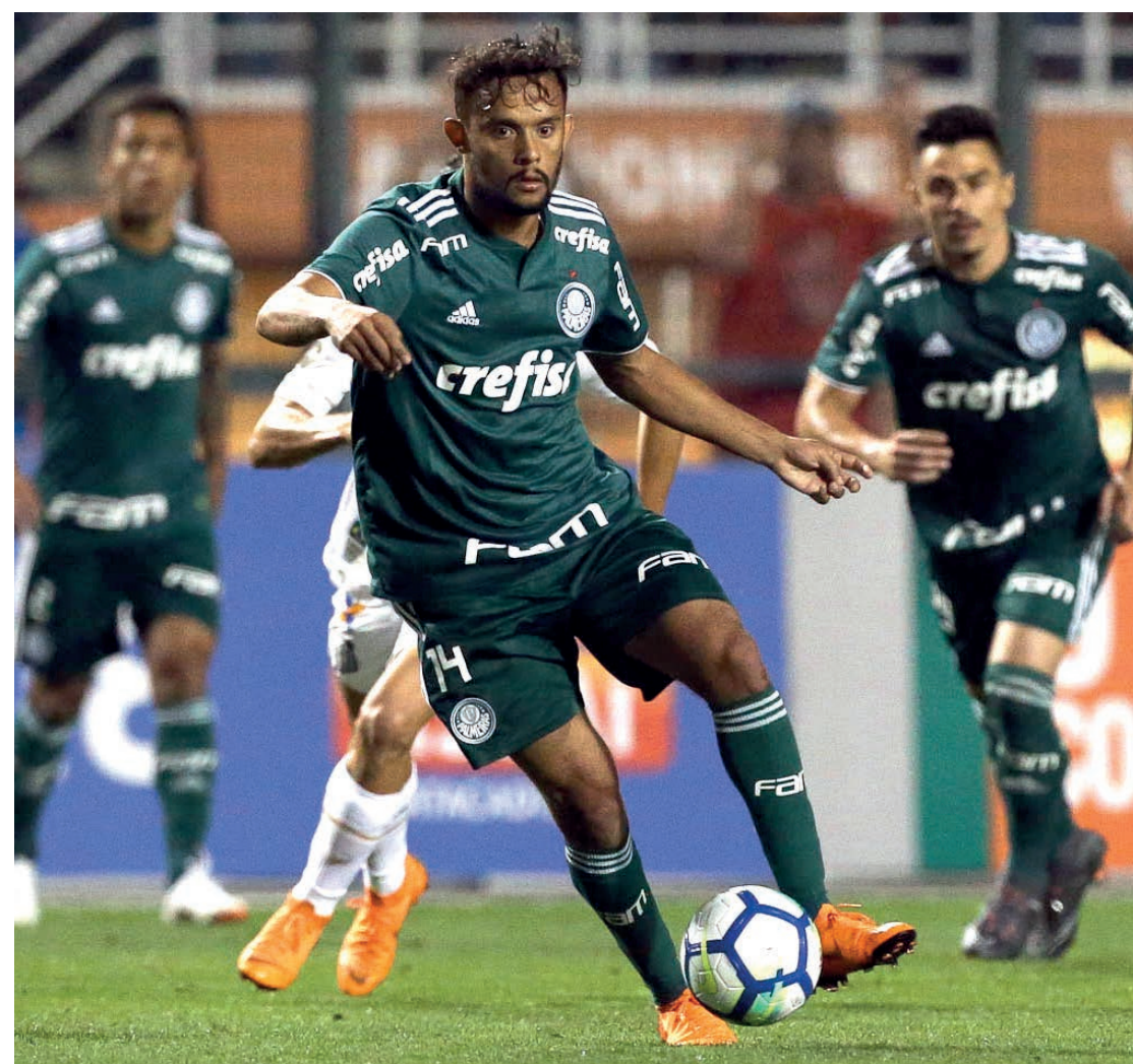
Time comandado por Roger Machado contabiliza 23 pontos na Tabela de Classificação

SE Palmeiras encara o Fluminense FC no Maracanã