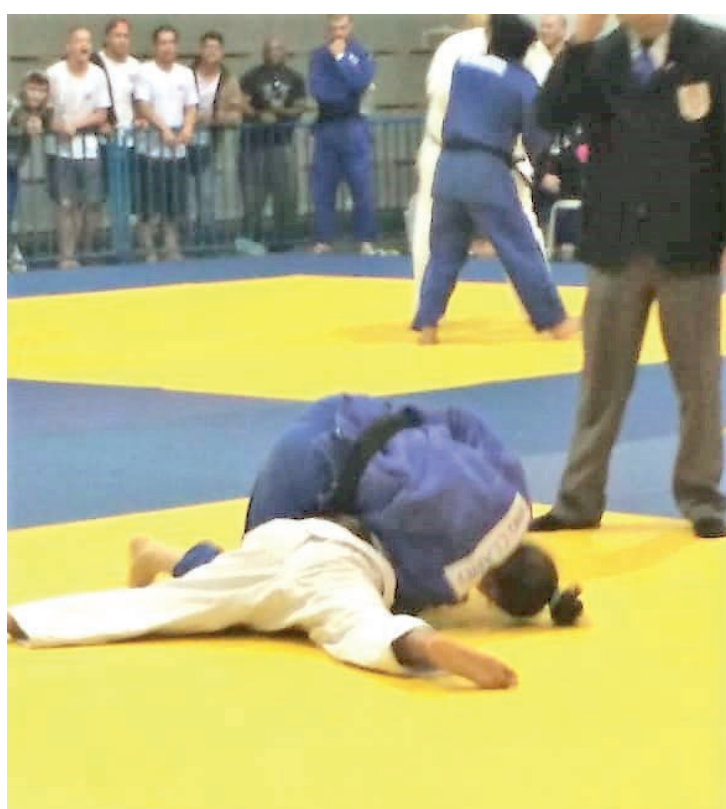
Fique por dentro dos resultados do Jogos Regionais

Tem início nesta quarta-feira (25) os embates da 15ª rodada do Campeonato Brasileiro de Futebol. O Verdão, que aparece em sexto lugar na tabela de classificação, vai em busca da vitória sobre o Tricolor Carioca, no confronto que tem início às 19h30. Página 8