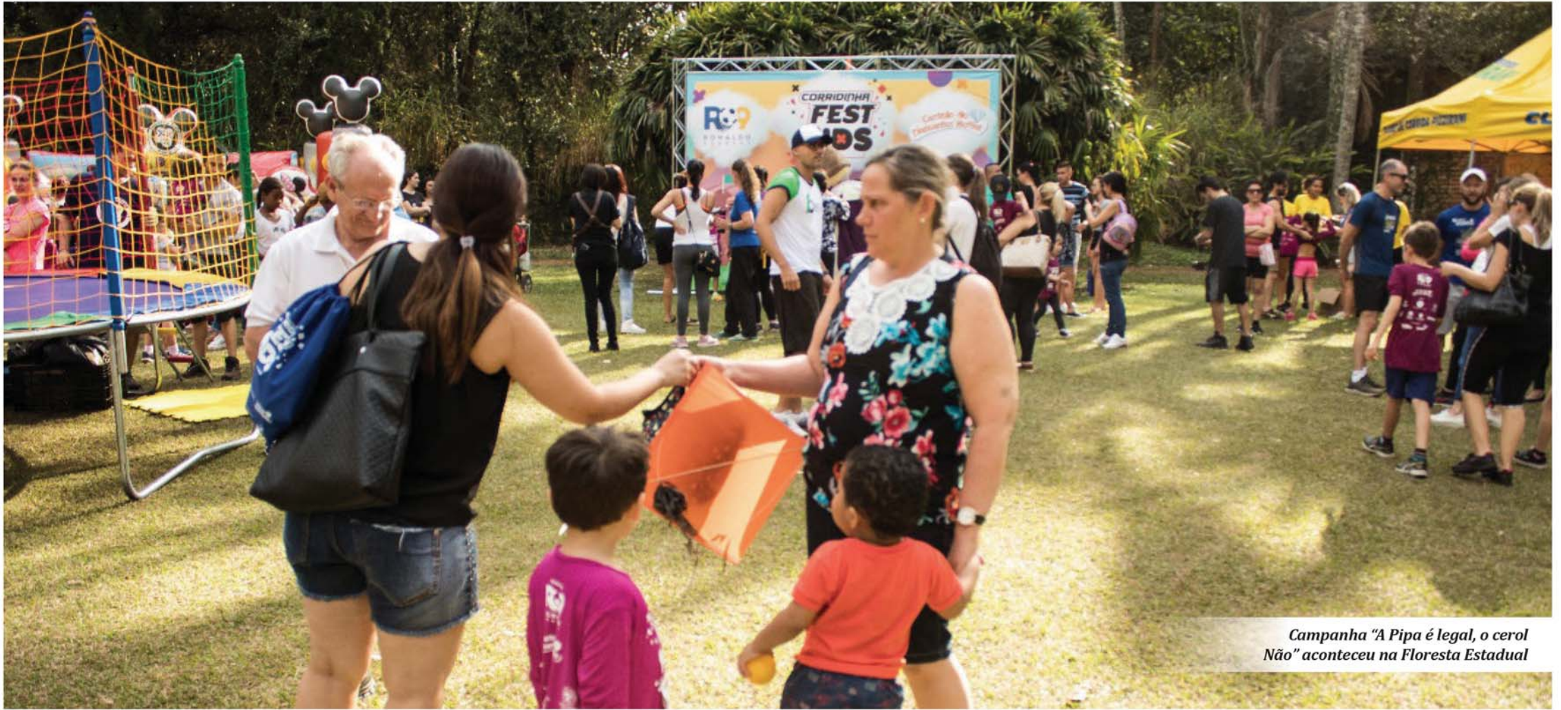
Campanha "A Pipa é legal, o cerol Não" aconteceu na Floresta Estadual