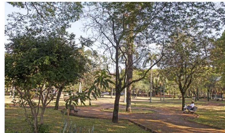
Praça Joaquim Martins dos Santos - Avenida 22 A e 24 A, Bela Vista