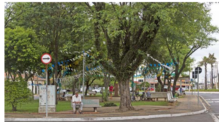
Praça Vereador Sylvio Cassavia Filho - Rua 14 - Jardim Claret

Portanto faz-se necessária a conscientização, que a quantidade de árvores em uma praça, não significa risco, e que uma praça sem árvores, não se forma como tal, pois ela precisa fornecer algo que garanta bem estar social, cultural, lazer, história. Assim as praças arborizadas precisam se expandir cada vez mais, pois sua vegetação além de proporcionar qualidade de vida das pessoas, auxiliam no equilíbrio do clima do ambiente, principalmente, em zonas urbanas, onde a poluição é realidade desafiadora.