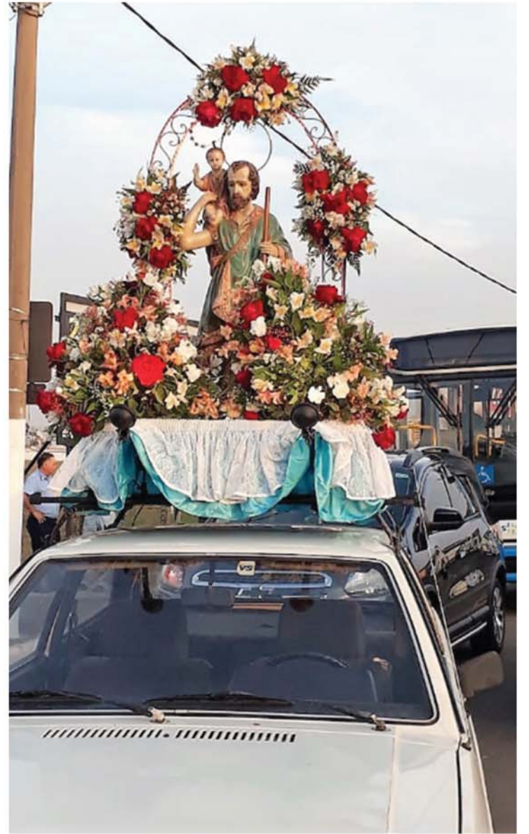
Diversos motoristas participaram de carreta que celebrou o padroeiro dos motoristas, no último fim de semana