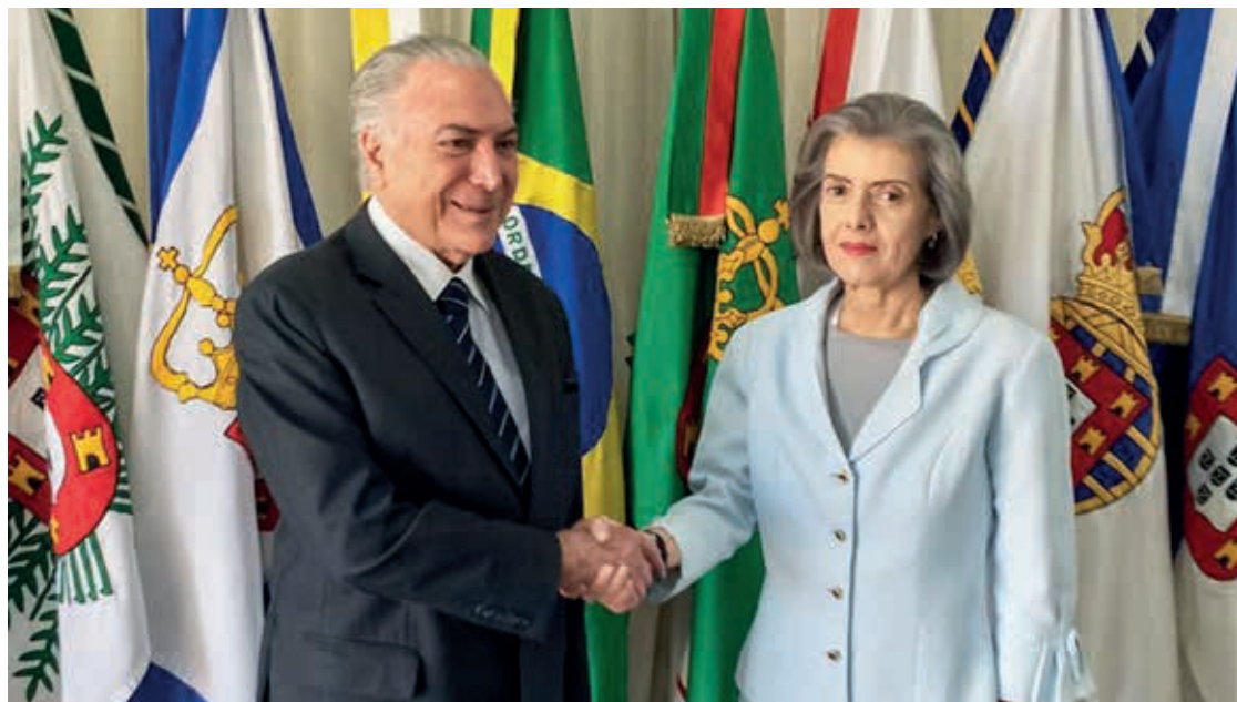
Michel Temer transmite o cargo para a presidente do STF, Cármen Lúcia

Pela quarta vez a presidente do Supremo Tribunal Federal (STF), Cármen Lúcia, assumiu interinamente a presidência da república. O motivo foi a viagem de Michel Temer (MDB) ao México, de onde deve partir para a África do Sul para a 10ª Cúpula do Brics (que reúne Brasil, Rússia, Índia, China e África do Sul), e que ocorre desta quarta-feira (25) até sexta-feira (27).