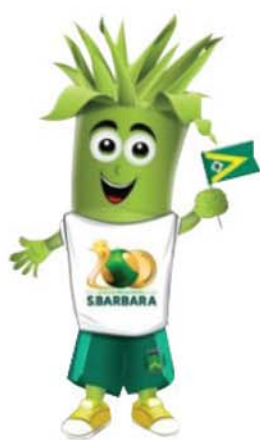
CANITO, o Mascote dos Jogos Regionais é parceiro do Número 1!

SANTA BÁRBARA VAI FICAR AZUL!: resultados dos JR? Sim! O rio-clarenses encontra AQUI, no Maior e Mais Completo Canal Esportivo da Cidade Azul!