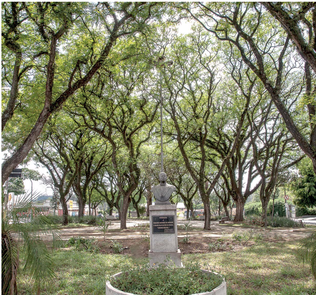
Praça Dr. Edmundo Navarro de Andrade.