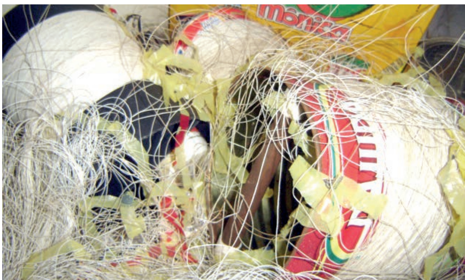
A Guarda Municipal apreendeu 18 latas grandes e 4 latas pequenas de linhas com cerol nessa segunda-feira (23)