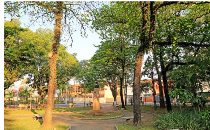
Praça da Liberdade - Localização- Ruas 5 e 6 entre as Avs. 3 e 5 - Acervo do Arquivo Público e Histórico de RC