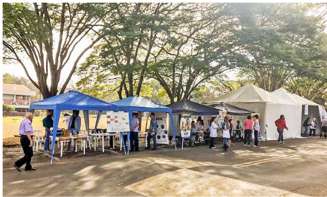
As atividades prosseguem nesta quarta (25) e quinta-feira (26), também na entrada da Unesp

A parceria entre a Unesp e a Secretaria Municipal de Saúde foi feita a pedido da direção do IGCE (Instituto de Geociências e Ciências Exatas) e é organizada pela Vigilância Epidemiológica e Nestd (Núcleo de Educação em Saúde, Treinamento e Desenvolvimento). A segunda edição do evento conta ainda com apoio da Faculdade Asser e Nichpharma. A Unesp Rio Claro fica na Avenida 24 A, 1515, na Bela Vista.