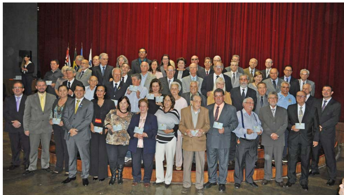
A cerimônia reuniu aproximadamente 250 pessoas, entre advogados, familiares e convidados em geral

"O Direito é a possibilidade de uma visão geral do mundo. Não sou uma pessoa autorizada, mas acredito que seja uma das profissões mais belas e satisfatórias que existem, porque a gente tem a oportunidade de conviver com movi-