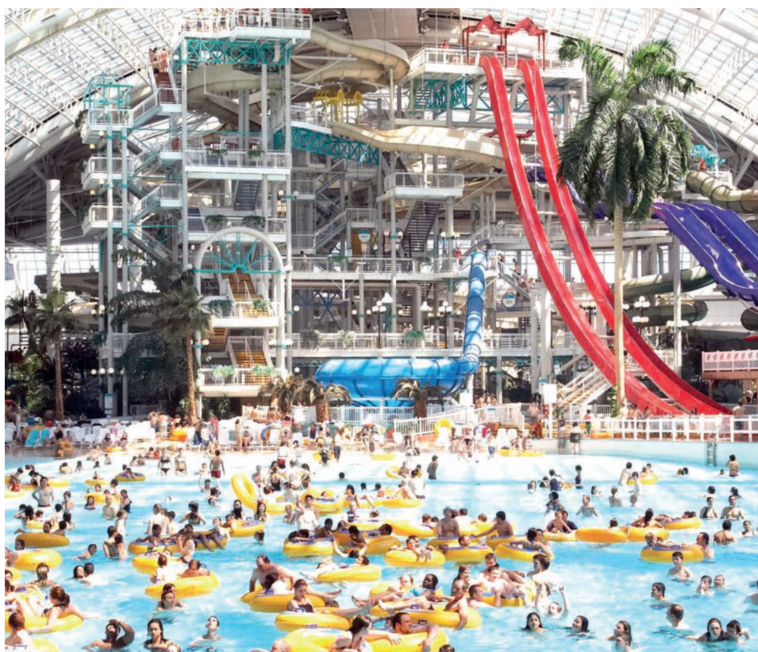
Projeto mostra como deve ser o parque aquático do American Dream Mall