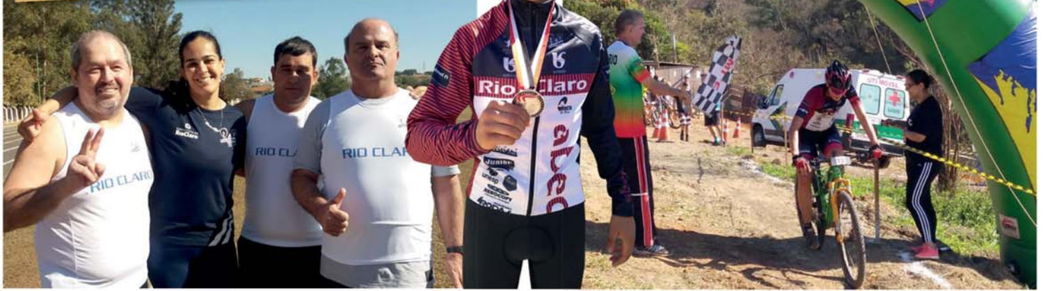
AVANTE!: A Delegação Rio-Clarense que tem o irrestrito apoio da Secretaria de Esportes e Turismo [Setur] segue em busca de bons resultados no evento esportivo promovido pela Secretaria de Esporte, Lazer e Juventude [Selj] que reúne 40 municípios do Estado de São Paulo!