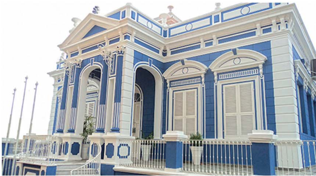
Nesta sexta-feira (20) encerram-se as matrículas nas ETECs

Está disponível no site www.vestibulinhoetec.com.br a relação dos classificados no processo seletivo das Escolas Técnicas Estaduais (Etecs) para o segundo semestre de 2018.