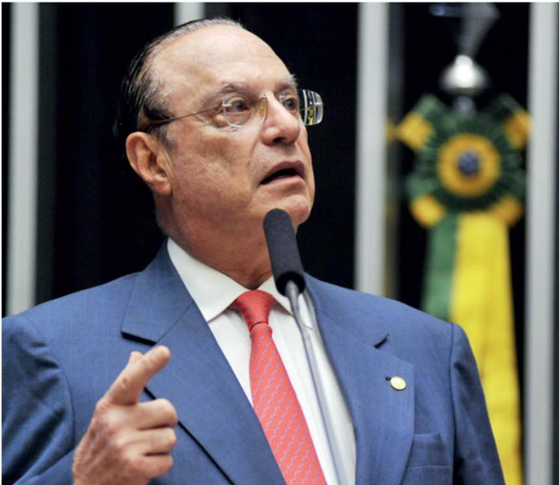
Deputado afastado Paulo Maluf cumpre pena de 7 anos e 9 meses de reclusão em sua casa

Maluf cumpre pena de 7 anos e 9 meses de reclusão em casa, em São Paulo, após condenação por desvios em