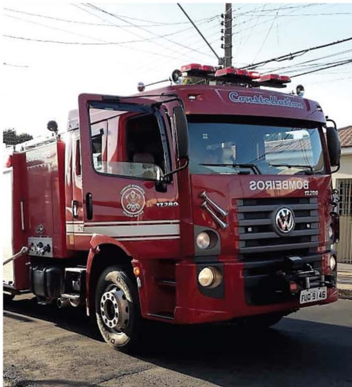
Fogo começou no quintal da casa onde estava depositada uma grande quantidade de material reciclável

Na manhã dessa quinta-feira (19) Guardas Cívicas Municipais realizavam patrulhamento pela Vila Olinda e perceberam de longe uma fumaça escura em um dos pontos do bairro. A equipe se deslocou até o local para averiguar. Ao chegarem se depararam com parte de uma residência na Avenida 56, em chamas, populares