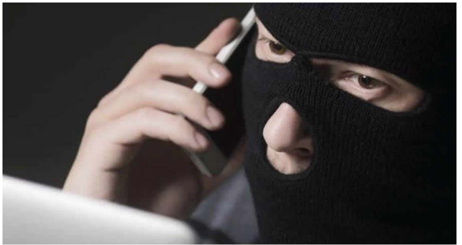
Em junho, casal foi preso em Rio Claro com falsos bilhetes premiados. Eles teriam praticado golpe contra idosa em Ribeirão Preto

ca as modalidades praticadas pelos criminosos, apenas o total de registros.