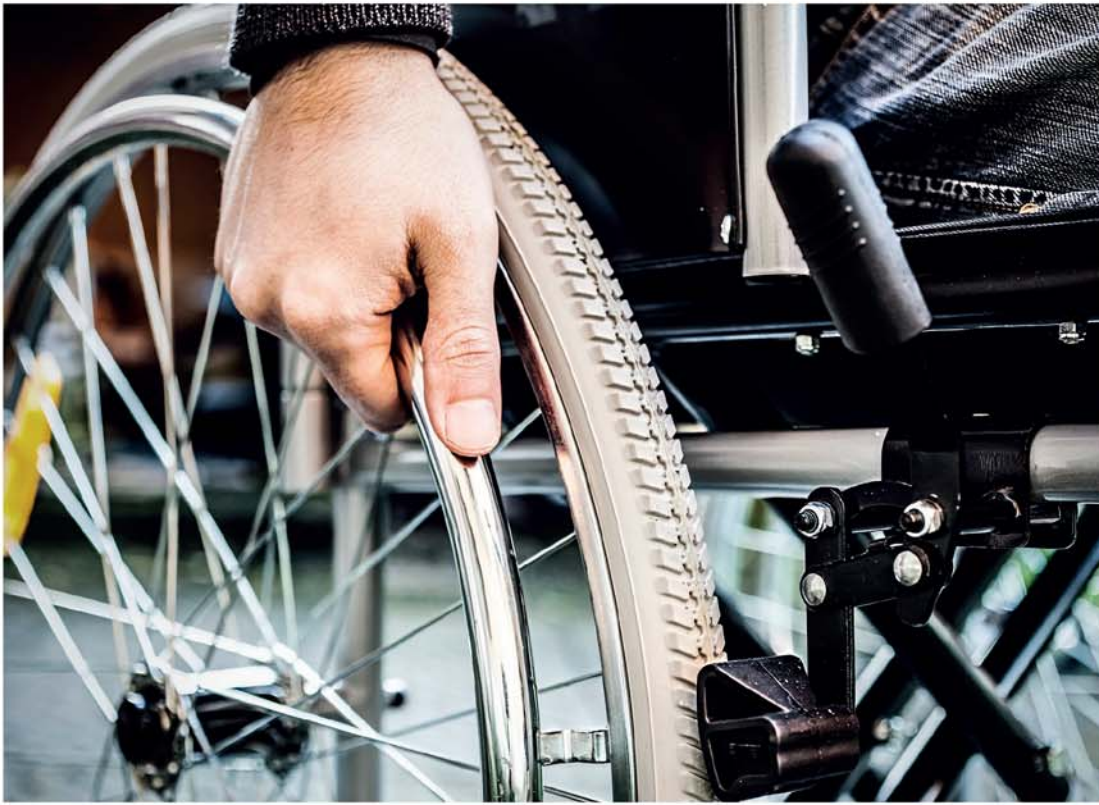
Servidor federal com conjuge, filho ou dependente com deficiência já tem jornada reduzida

"O Decreto Legislativo número 186, do Senado Federal, publicado em 9 de julho de 2008, aprovou o texto da Convenção sobre os Direitos das Pessoas com Deficiência e de seu Protocolo Facultativo, assinados em Nova Iorque, em 30 de março de 2007", explica o deputado na justificativa da Indicação. "Entre outros pontos, o documento da Organização das Nações