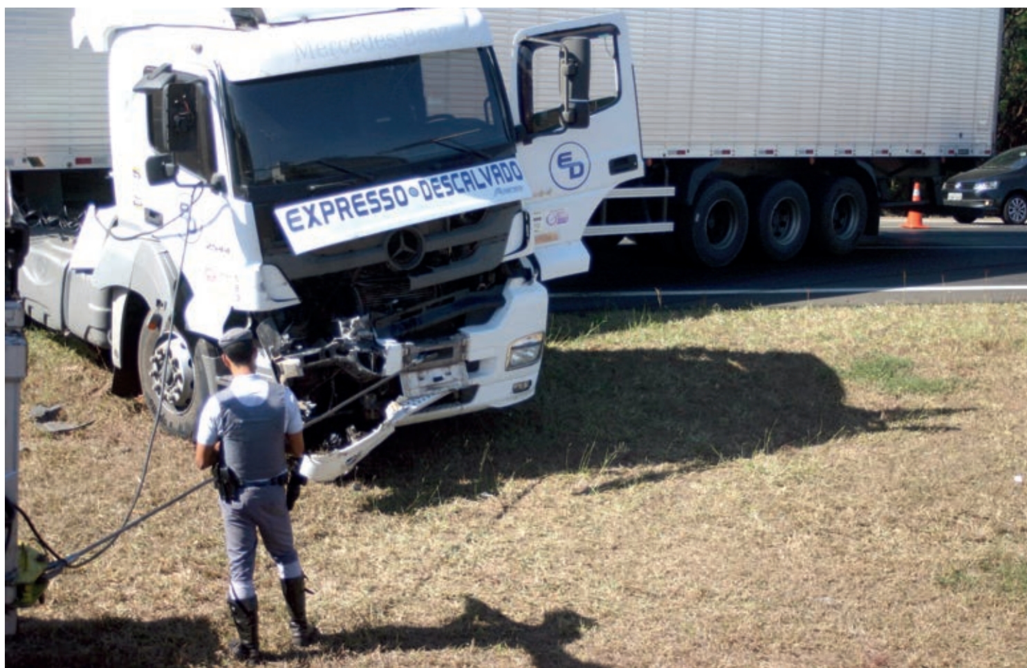
Um dos veículos colidiu na traseira do outro na altura do KM 170; caminhão ficou no meio da pista

A Polícia Civil de Rio Claro divulgou números sobre estelionatos na cidade. Somente neste ano, foram consumados 268 golpes no município. As modalidades praticadas pelos criminosos são diversas, desde clonagem de cartões a golpes do falso bilhete premiado. Confira orientações para não se tornar uma vítima. Página 5