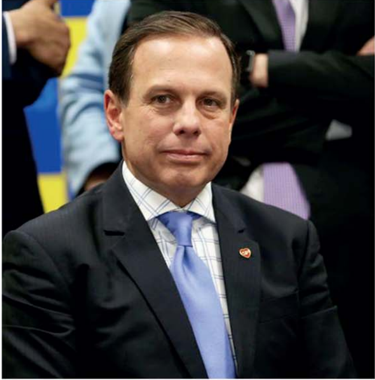
Os nomes de João Dória e Paulo Scaf serão homologados no dia 28/07, em convenções estaduais do PSDB e MDB, respectivamente

Nesta sexta-feira (20), os partidos começam a discutir em suas convenções nomes para as eleições de outubro próximo