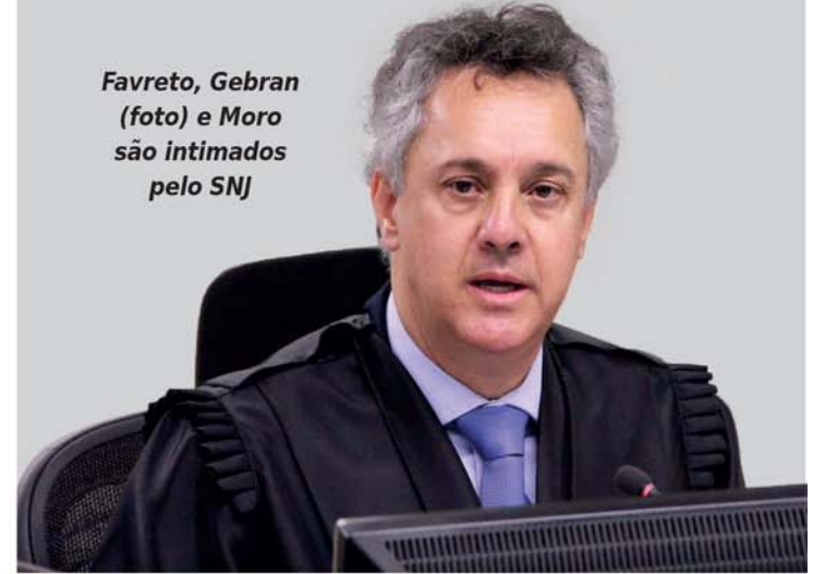
Favreto, Gebran (foto) e Moro são intimados pelo SNJ

No dia 8 de julho, o desembargador Rogério Favreto atendeu a um pedido de liberdade feito por deputados do PT em favor de Lula. Em seguida, o juiz Sérgio Moro e o desembargador do Tribunal Regional Federal da 4ª Região Gebran Neto, ambos relatores dos processos da Operação Lava Jato, derrubaram a decisão de Favreto por entenderem que o magistrado não tinha competência para decidir a questão. No mesmo dia, o entendimento foi confirmado pelo presidente do TRF, Thompson Flores.