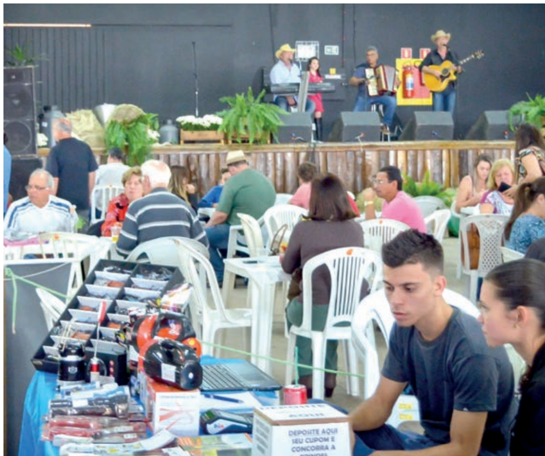
Feira do Produtor Rural é atração no fim de semana com música e gastronomia

Nesta sexta-feira (20), tem início as convenções partidárias para as homologações dos candidatos a diversos cargos públicos eletivos. Candidatos à presidência da República, governadores, senadores, deputados estaduais e federais serão definitivamente inseridos na corrida eleitoral. Presidentes de partidos da Cidade Azul falam sobre as convenções. Página 6