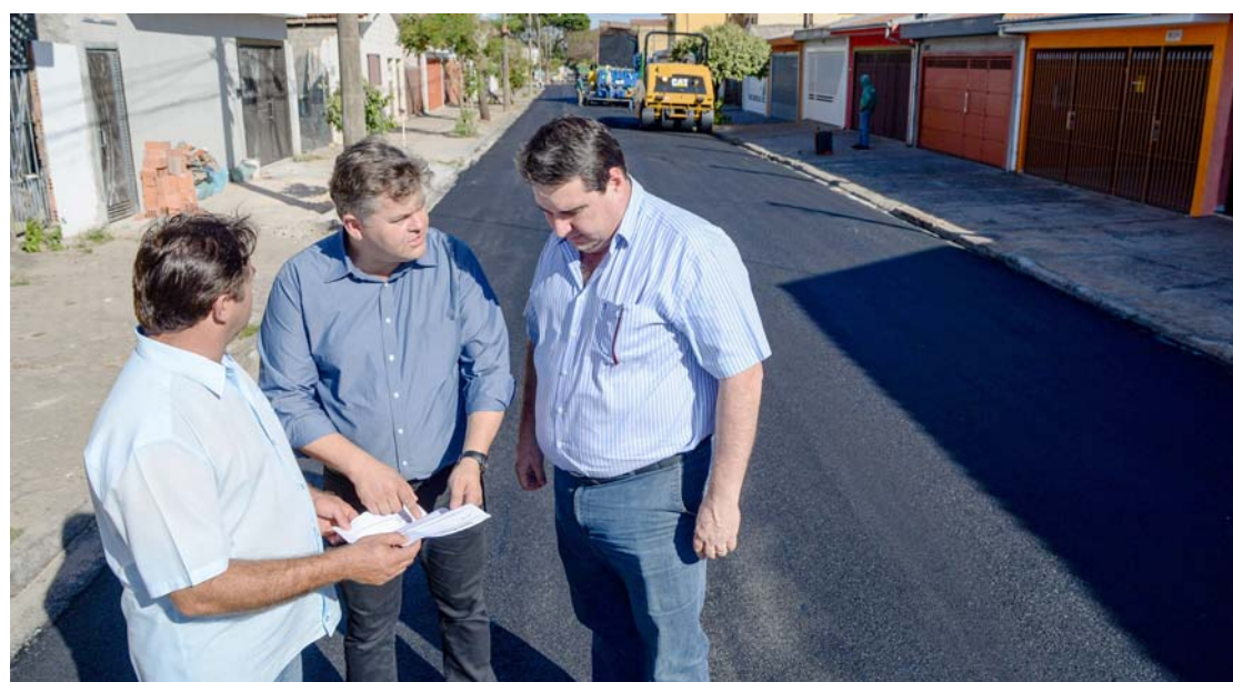
Serão recapeados 4.123 metros quadrados de asfalto na Rua M-5, em trecho localizado entre as avenidas M-31 e M-23

Outros trechos também receberão recapeamento asfáltico. O serviço será realizado na Avenida M-21, entre as ruas M-4A e M-8. Nesse trecho serão recuperados 1.124