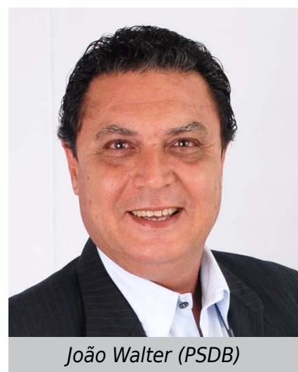
João Walter (PSDB)

As pré-candidaturas desta eleição seguem a mesma dinâmica das últimas. Políticos já estabelecidos em cargos eletivos, no intuito de prosseguirem seu legado, apoiam filhos e parentes para tentar garantir o número de votos e a permanência na máquina pública. No país, diversos filhos de tradicionais figuras da política tentam ingressar em cargos legislativos neste pleito.