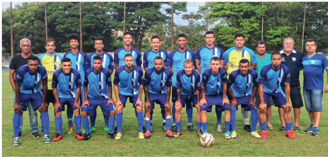
OITO DÉCADAS DO AZUL E BRANCO: Time do Jardim Wenzel vem ganhando destaque nesta temporada do Campeonato Amador de Futebol e figura entre os favoritos ao Título de Campeão!

No último fim de semana, na partida de volta das Oitavas de Final do Campeonato Amador de Futebol, o Juventude FC venceu a AA Santa Maria por 1X0; antes, no jogo de ida o contador havia terminado igual, 0X0. Com o resultado de ambos os enfrentamentos, o Time do Jardim Wenzel avançou rumo ao Título de Grande Campeão e, em nota envida à reportagem do Diário Esportes, a diretoria enfatizou a receptividade com que seus jogadores foram recebidos no Quadrilátero do Jardim Santa Maria e, sobretudo, o sentimento desportivo durante todos os 180 minutos. "Gostaríamos de agradecer a diretoria da AA Santa Maria pela maneira