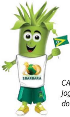
CANITO, o Mascote dos Jogos Regionais é parceiro do Número 1!

Com o intuito de seguir bem informando o Leitor do Centenário, a Redação do Diário Esportes traz mais um Boletim Cidade Azul com as últimas notícias sobre os competidores que estão em Santa Bárbara d'Oeste participando dos Jogos Regionais! Na última quinta-feira (19), os rio-clarenses que disputam na 62ª Edição dos Jogos Regionais da 4ª Região Esportiva do Estado de São Paulo mais uma vez defenderam a Bandeira de Rio Claro no evento esportivo que reúne 40 municípios até o próximo dia 27 de julho! Ao todo, a delegação de Rio Claro conta com 300 atletas de 20 modalidades de alto nível! Continue ligado, pois emoção e informação sobre os Jogos Regionais, o rio-clarense encontra AQUI, no Número 1!