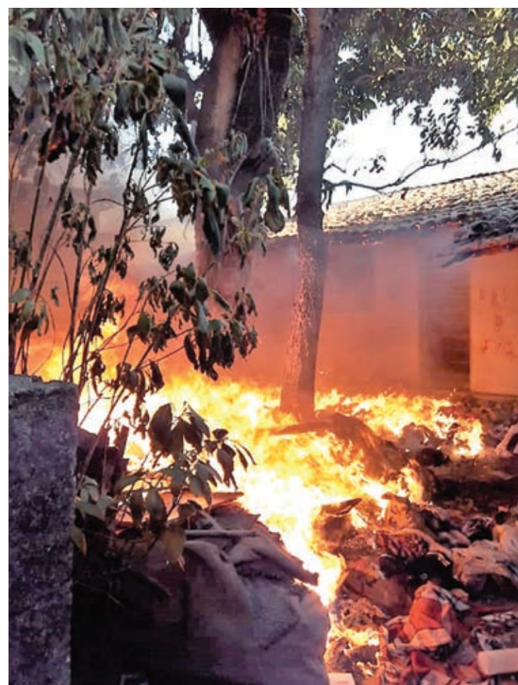
Bombeiros conseguiram rapidamente conter as chamas