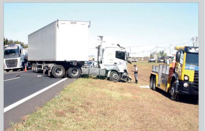
Os motoristas não se feriram. Trânsito ficou lento

O motorista do veículo que provocou a colisão disse que perdeu o controle e acabou batendo, porém os motivos não foram declarados.