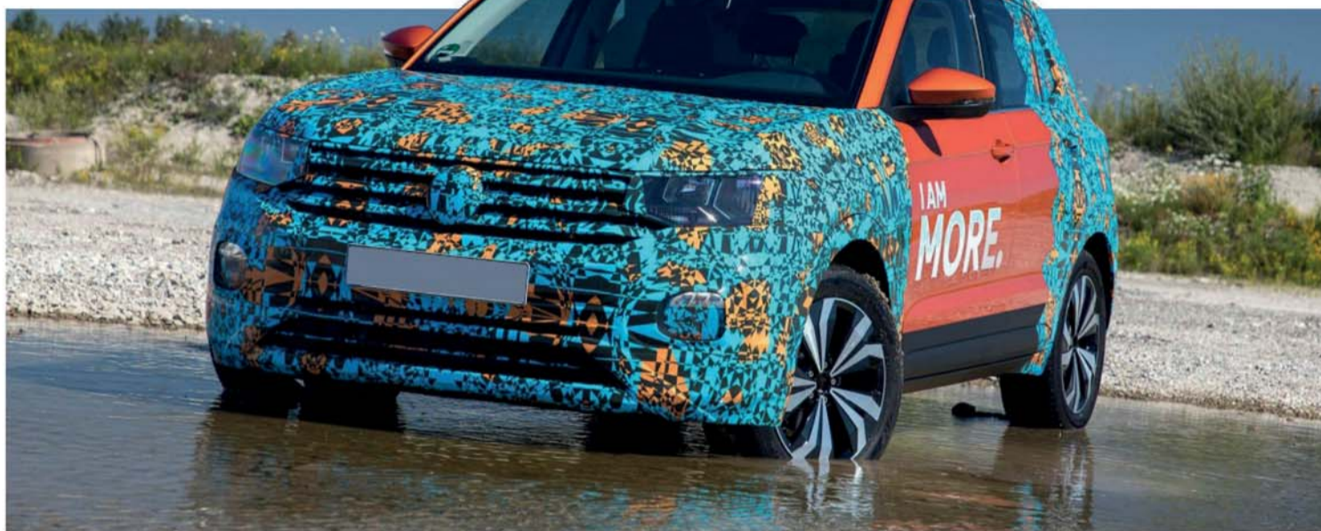
A Volkswagen revela os primeiros detalhes deste SUV, que está quase pronto para a produção em série

“DESCOLADO” - O design é marcante. A parte dianteira destaca-se por sua altura; o design é carismático, com uma grade ampla e faróis de LED integrados. Também responsável por esta altura acentuada é a tampa do compartimento do motor. A região inferior da parte dianteira distingue-se por detalhes como os faróis de neblina inseridos de modo marcante. Nas versões do T-Cross com faróis halógenos, a luz de condução diurna é integrada no módulo dos faróis de neblina; já no caso de faróis full-LED, a luz de condução diurna encontra-se acima, na carcaça do farol. Nas laterais, uma linha característica acentuada divide os espaços. Atrás, ela forma uma seção dos ombros impactante, e assinala na traseira um novo elemento de design da Volkswagen: a faixa de refletores estendida transversalmente na parte traseira e emoldurada por um painel