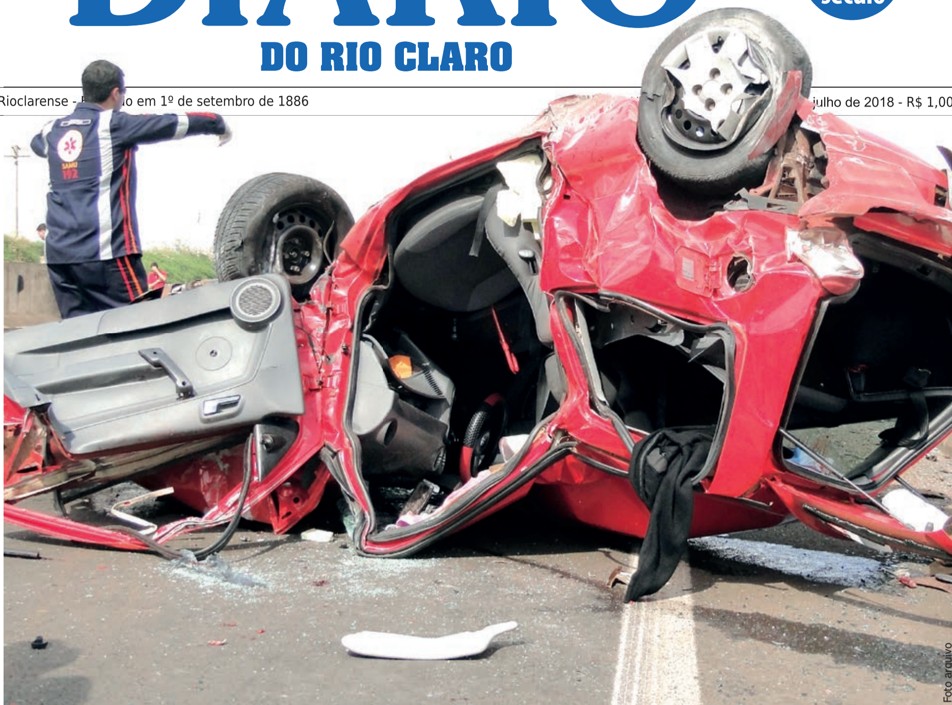
Em RC foram registrados, até maio deste ano, 552 acidentes com vítima, incluindo aqueles registrados nas rodovias no entorno do município

O Brasil é o segundo país das Américas com mais casos de Sarampo. Até o dia 27 de junho, foram confirmados 265 casos de sarampo no Amazonas, sendo que 1.693 permanecem em investigação. Em Rio Claro ainda não foi registrado nenhum caso da doença. Página 2