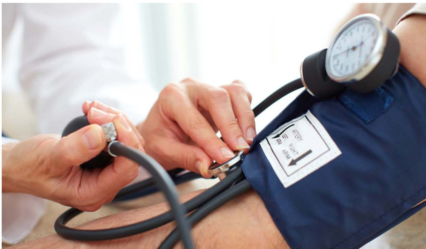
Serviço de aferição de pressão deverá ser oferecido à comunidade gratuitamente com acompanhamento de farmacêutico responsável; Profissionais de farmácia acreditam que lei é positiva para a sociedade e que agregará aos estabelecimentos

Ele analisa ainda que a medida sendo realizada nas farmácias desafoga os serviços públicos. "Pode acontecer de a pessoa pensar que não está se sentindo bem, com pressão alta e procurar a UPA. E, às vezes, não é esse o problema. Com