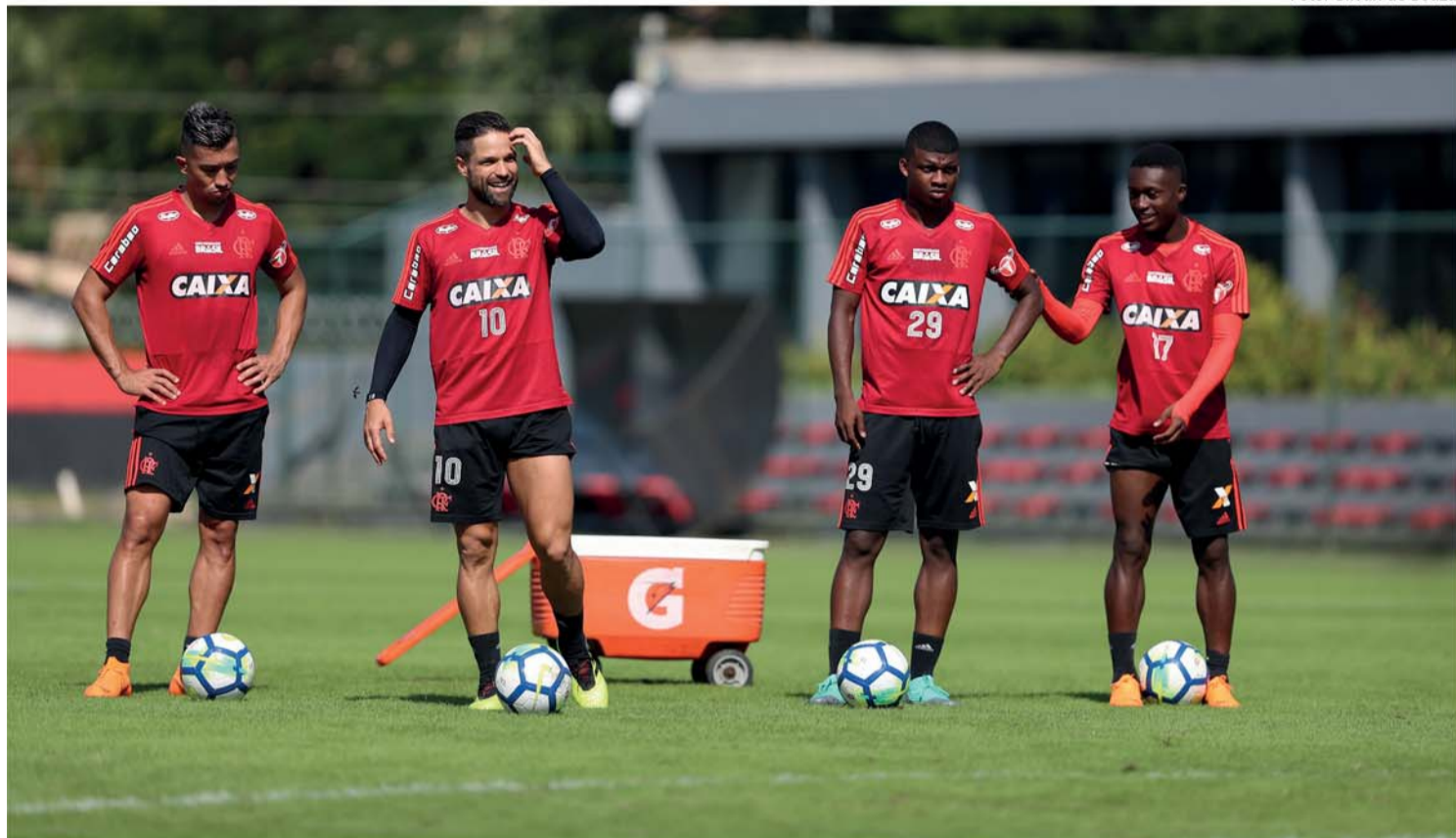
RECOMEÇO: o escrete do CR Flamengo treinou ONTEM os dois períodos e HOJE, às 21h45, recebe o São Paulo FC, no Maracanã!

TUDO CERTO PARA A LARGADA DO CAMPEONATO BRASILEIRO! Para não perder o pique da Copa do Mundo na qual a Rússia ficou Campeã, o Diário Esportes reinicia a cobertura do Brasileirão! Isso mesmo! A 13ª rodada tem início nesta quarta-feira (18) e vai ficar marcada por Grandes Confrontos! O CR Flamengo, que encabeça a Tabela de Classificação com 27 pontos, recebe o São Paulo FC que, por sua vez, contabiliza 23 e o 3º Lugar! De um lado, os comandados por Maurício Barbieri devem entrar em campo com o apoio da torcida e o desejo de manter a liderança e, do outro, o escrete de Diego Aguirre vai ao Rio de Janeiro com o intuito de voltar para Sampa com mais três pontos na conta e seguir rumo ao Título!