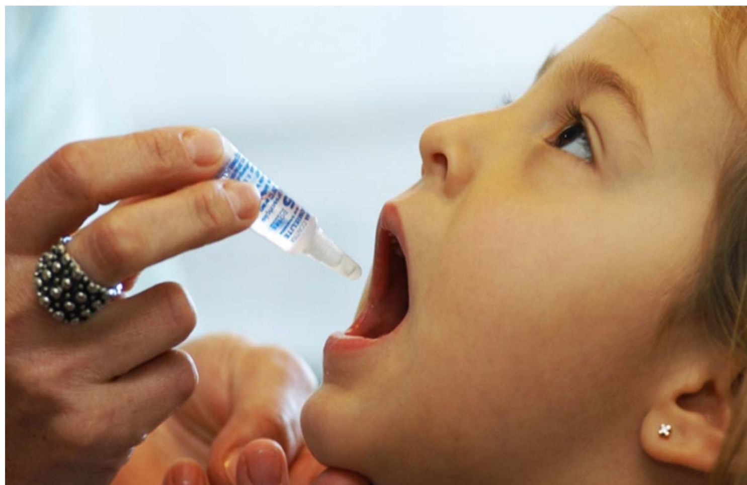
No município, ainda não há registros de caso de sarampo, segundo a Fundação Municipal de Saúde

Até o dia 27 de junho, foram confirmados 265 casos de sarampo no Amazonas, sendo que 1.693 permanecem em investigação. Já Roraima confirmou 200 casos da doença, enquanto 179 continuam em investigação. Ainda segundo a pasta, casos isolados e relacionados à importação foram identificados nos estados de São Paulo (1), Rio Grande do Sul (6); e Rondônia (1). Outros estados têm casos suspeitos, mas que ainda não foram confirmados. Até o momento, o Rio de Janeiro informou oficialmente 18 casos suspeitos e dois casos confirmados de sarampo.