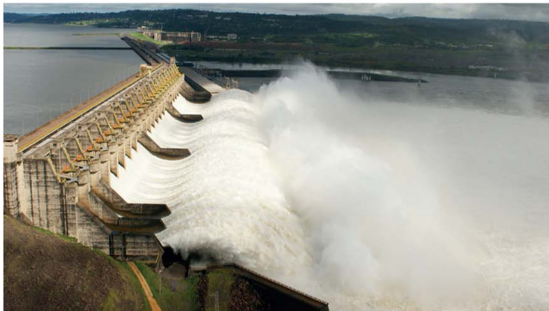
Remuneração total recebida pelas usinas, de julho de 2018 a junho de 2019, será de R$ 7,944 bi