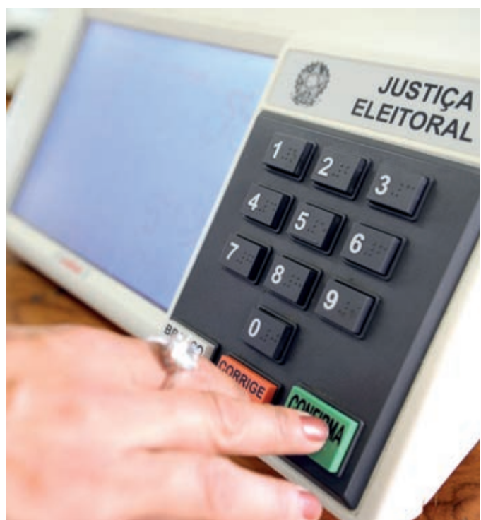
Lei Eleitoral já está vigorando desde sábado (7)