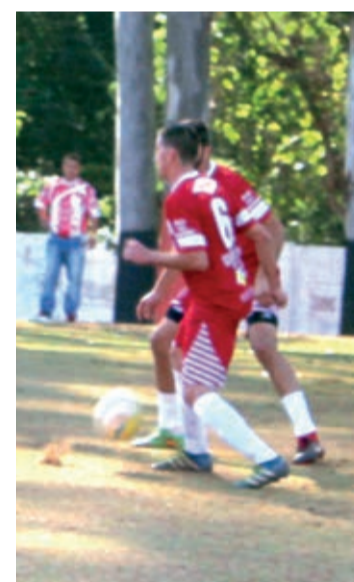
Amador: veja o resultado dos jogos. Página 6