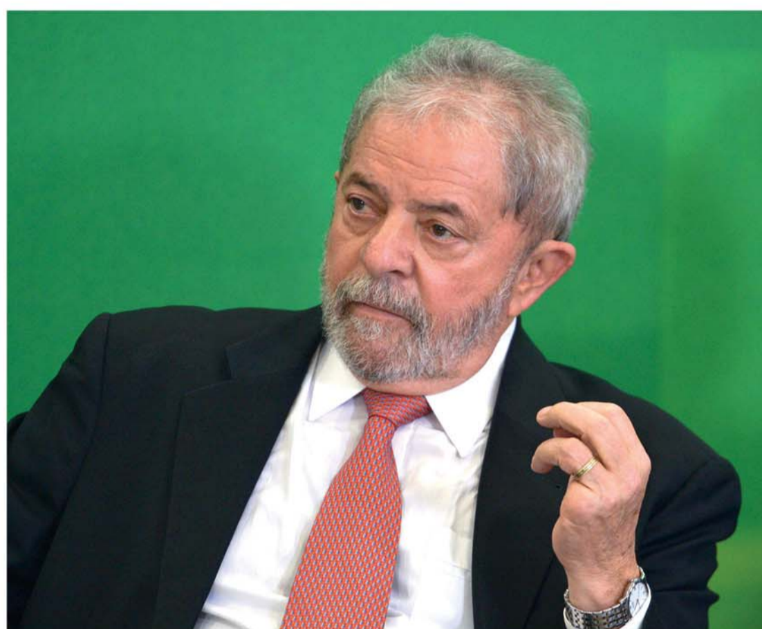
Apesar do rebuliço, o ex-presidente Lula continua preso na sede da Polícia Federal de Curitiba

Para o advogado, os dois lados cometeram erros. "De um lado o PT se articulou para encontrar alguém simpático à causa da presunção de inocência e por outro lado o juiz Moro revelou o lado tendencioso também, de perda da imparcialidade, quando ele tenta fazer toda uma articulação para impedir que se cumpra o alvará de soltura. Então, a decisão judicial, desde que não seja esdrúxula, anormal, ela tem que ser cumprida, ainda que tenham encontrado um juiz simpático a determinada tese, que também não está errado. Então, nesse imbróglio todo, perde quem? Perde o judiciário. Que perdeu a imparcialidade, porque perdeu a transparência e porque está politizando suas decisões. O judiciário não pode politizar suas decisões. O juiz fala no processo, o juiz não fala fora do processo. E o juiz para falar dentro do processo, ele só pode falar porque ele é competente, ele não pode sair desse lugar e cada um criar suas teses os seus costumes, os seus jeitos de julgar e colocar opinião sobre isso. Então nesse imbróglio do Lula