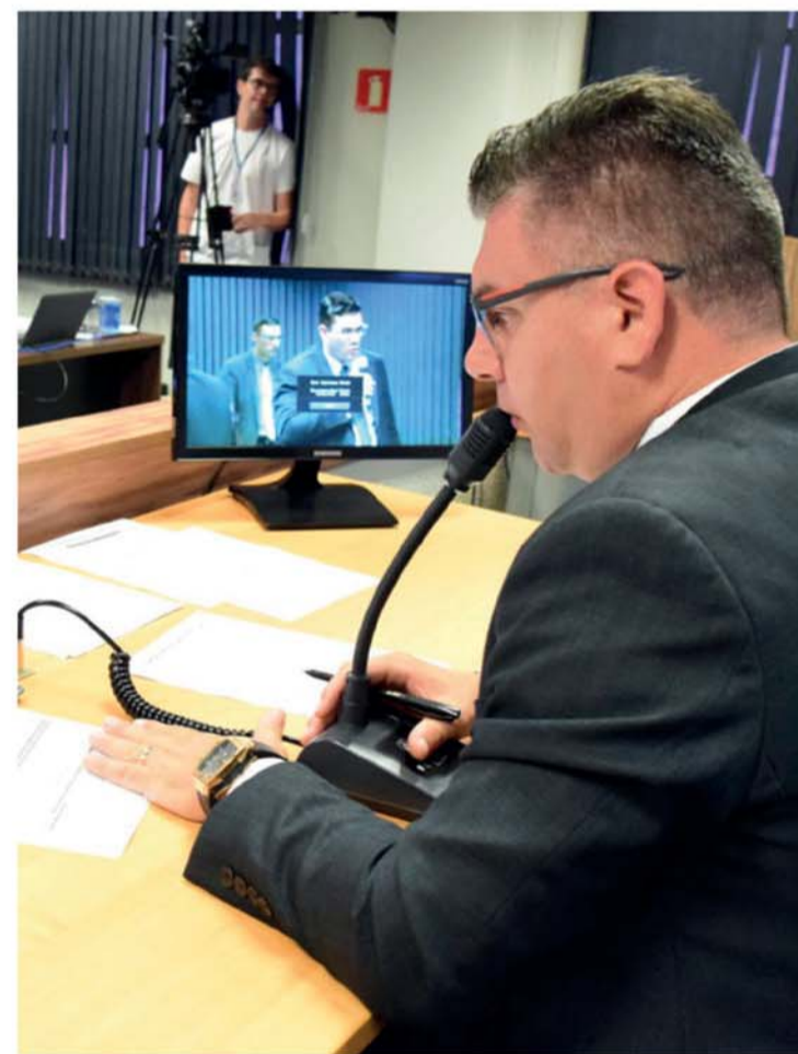
Devido ao feriado dessa segunda-feira (9), a sessão camarária acontece nesta terça