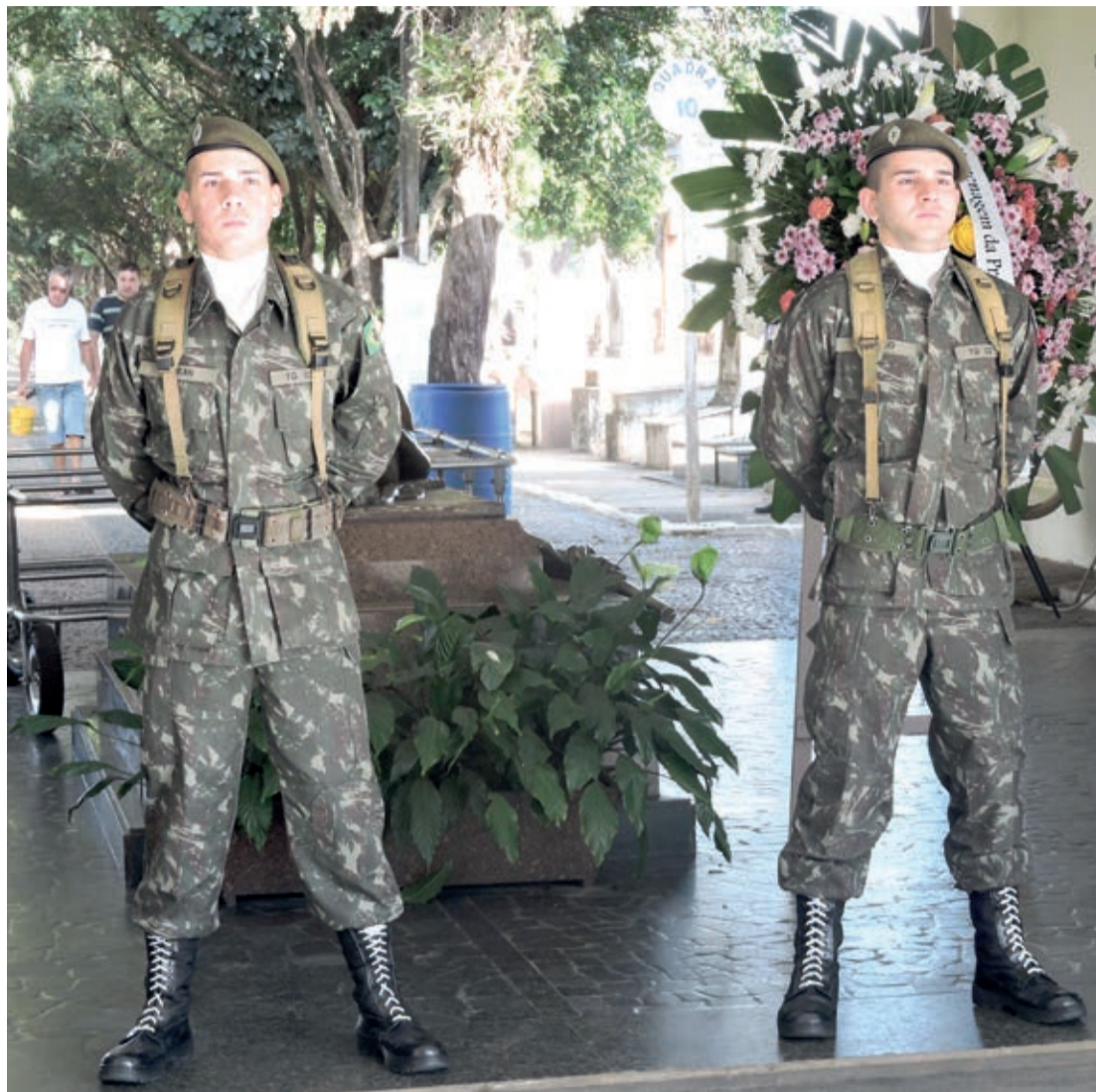
Solenidade foi realizada na manhã dessa segunda-feira (9), no Cemitério Municipal