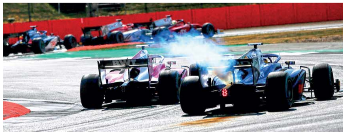
Motor do carro do piloto pegou fogo e o tirou da prova

Quem levou a melhor foi o piloto tailandês Alexander Albon, que conseguiu sua segunda vitória no campeonato.