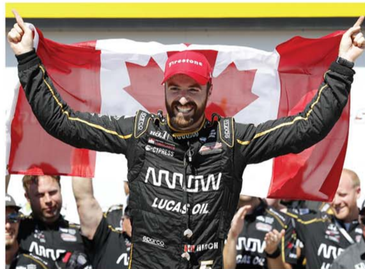
Foi a primeira vitória do piloto na atual temporada