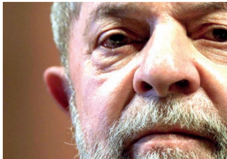
O ex-presidente Lula continua preso em Curitiba