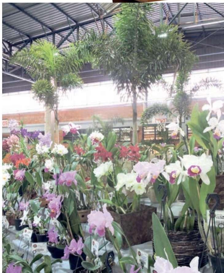
Exposição de Orquídeas continua até domingo (1º)