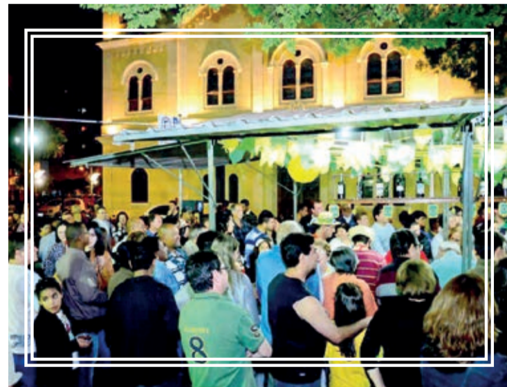
Quermesse de São João Batista termina neste sábado

O fim de semana é animado na Cidade Azul, além da tradicional Exposição de Orquídeas, neste sábado (30), acontece o último dia da concorrida Quermesse de São João Batista, na Matriz. Veja outras atrações. Página 9