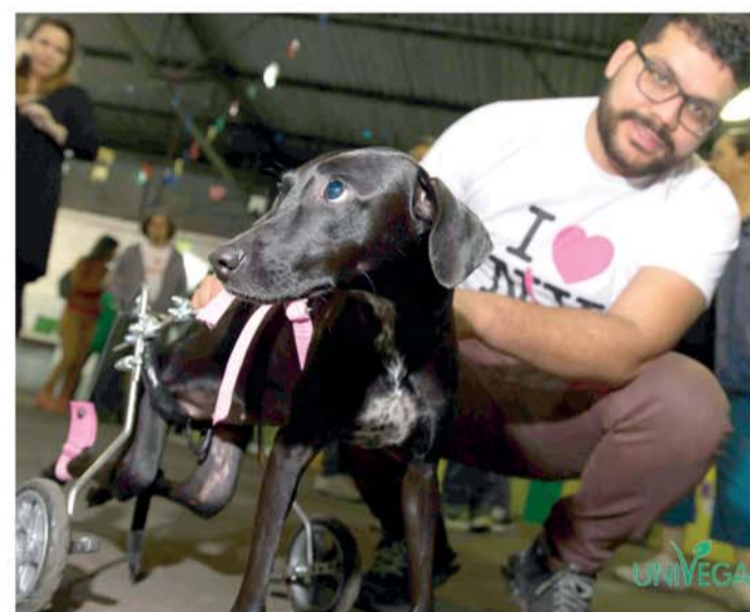
No evento, será realizada arrecadação de ração, adoção de animais e grupos de proteção da cidade irão vender seus produtos

A organização é da 'Univegan - Mas Nem Peixinho?', em parceria com a Prefeitura de Rio Claro. Além disso, é a oportunidade para que comerciantes e empresários apoiem a causa e demonstrem comprometimento com a causa animal. Interessados podem auxiliar através de investimentos em patrocínio para fazer parte dessa causa e ajudar os animais, mais informações pelo contato: feiraveganarc@gmail.com.