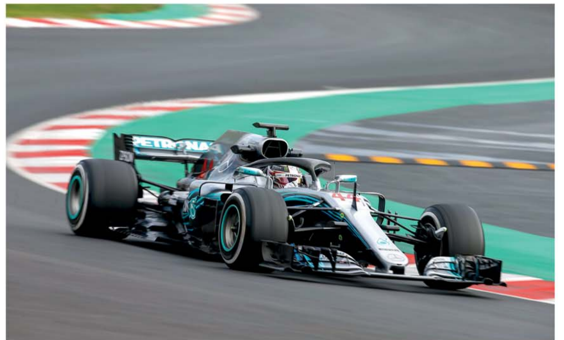
Hamilton parte com tudo para o GP da Áustria

Depois de provocar um acidente no GP da França, ele terminou a prova em uma decepcionante quinta posição, e perdeu a liderança do campeonato