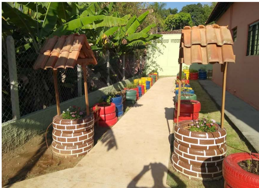
O Jardim sensorial é uma das conquistas do programa

"Nós tínhamos um espaço, vamos dizer, no quintal da biblioteca municipal que funcionava como depósito de caramujos, a vigilância não vencia passar veneno. Um lugar triste e sem vida! Então um dia dois amigos da Unesp me procuraram e falaram que gostariam de trabalhar com Meio Ambiente em Corumbataí. Na hora me veio este lugar. Depois de muita conversa, visitas, o nosso jardim está pronto",