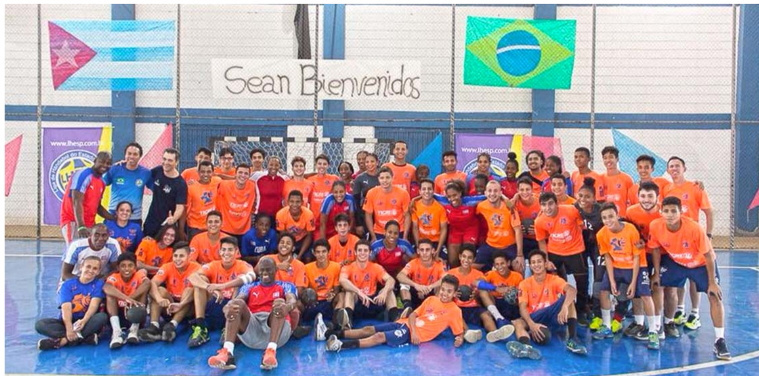
PARCERIA: de acordo com informações da assessoria de imprensa da Prefeitura de Rio Claro, a vinda da Delegação de Cuba foi viabilizada através de esforços conjuntos da Liga de Handebol do Estado de São Paulo [LHESP], do Instituto Crescer no Esporte e da Secretaria de Esportes e Turismo [Setur]