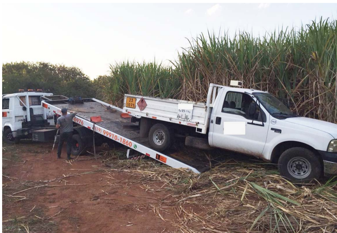
O veículo foi encontrado em meio a um canal na Avenida 11, bairro Jardim Nova Veneza

Na tarde de quinta-feira (28), através de solicitação 153, a viatura Equipe Rural, foi enviada para averiguar uma caminhonete em meio a um canal na Avenida 11, área rural, após o bairro Jardim Nova Veneza. No local indicado, a equipe se deparou com o veículo Ford F350 branca, realizada a consulta do emplacamento, cadastrado com queixa de roubo na última terça-feira (26), pertencente a uma empresa revendedora de gás. Acionado o serviço de guincho, fato apresentado no plantão de polícia. Um representante da empresa acompanhou a ocorrência, ao fim o veículo foi devolvido para empresa.