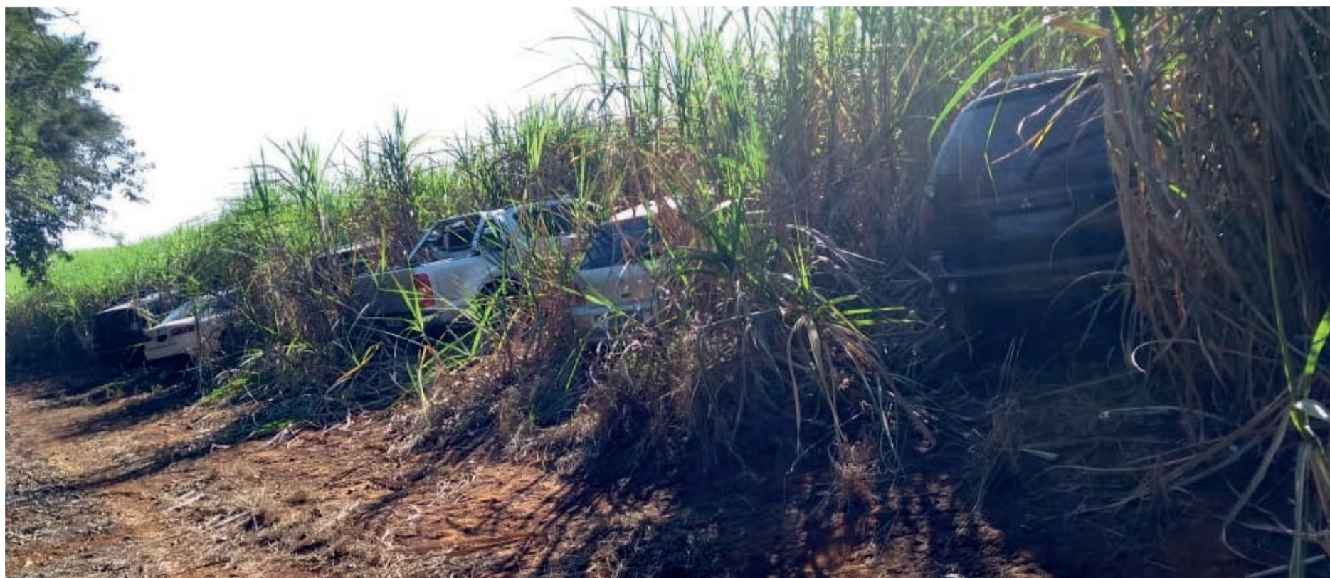
Os seis veículos utilizados pela quadrilha durante o ataque às agências na última quarta-feira (27), foram localizados em Iracemápolis